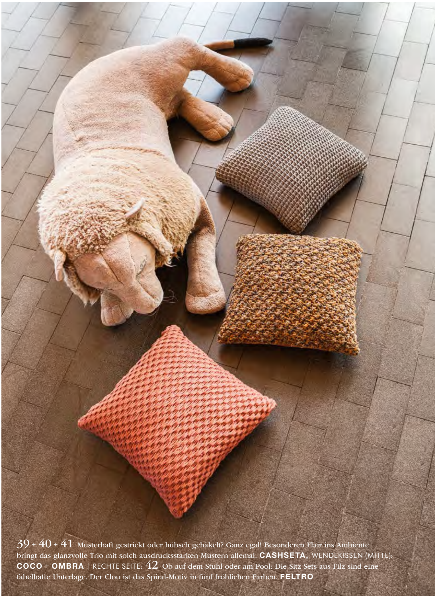
39 + 40 + 41 Musterhaft gestrickt oder hübsch gehäkelt? Ganz egal! Besonderen Flair ins Ambiente bringt das glanzvolle Trio mit solch ausdrucksstarken Mustern allemal. CASHSETA , WENDEKISSEN (MITTE) : COCO + OMBRA | RECHTE SEITE: 42 Ob auf dem Stuhl oder am Pool: Die Sitz-Sets aus Filz sind eine fabelhafte Unterlage. Der Clou ist das Spiral-Motiv in fünf fröhlichen Farben. FELTRO