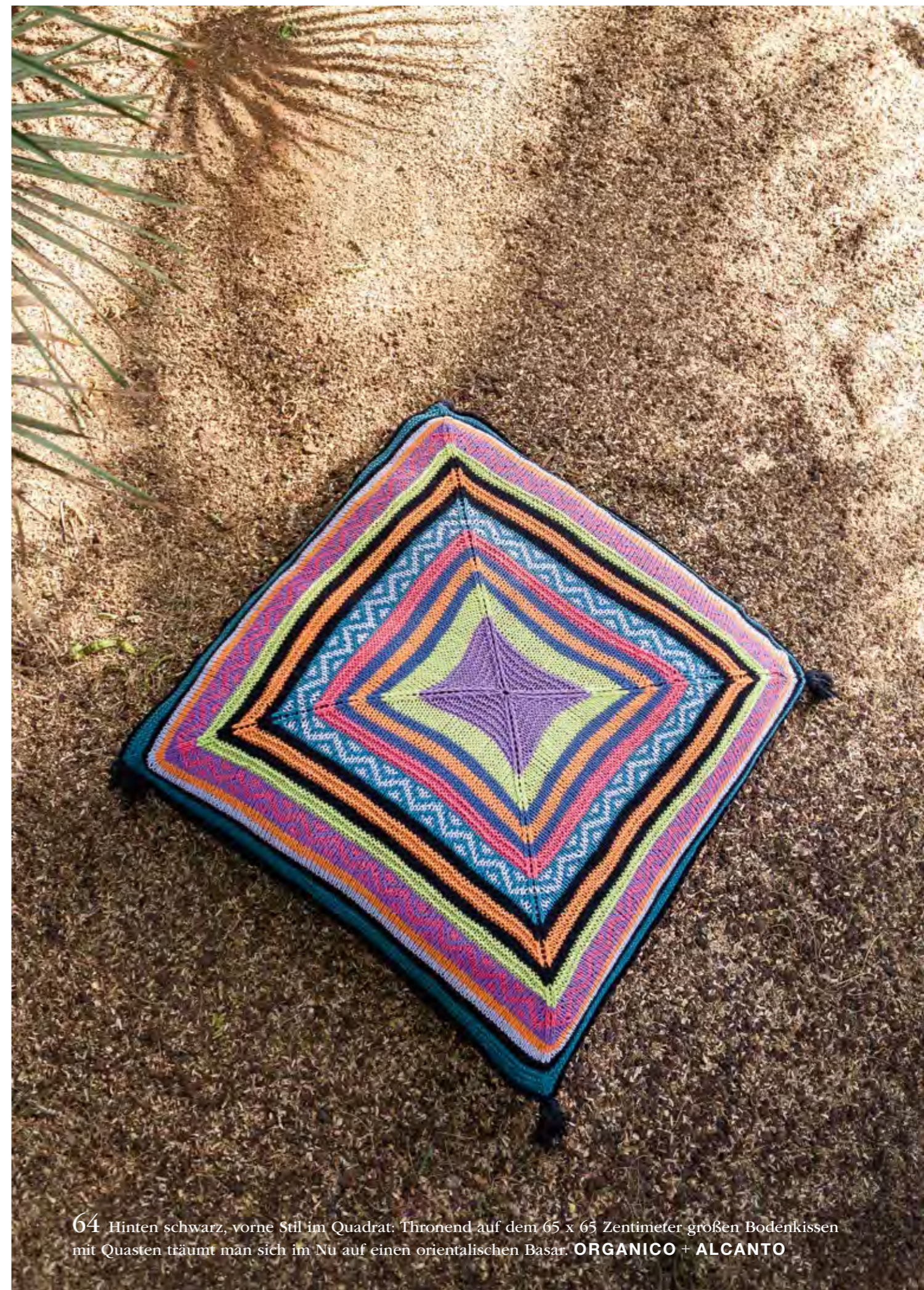
64 Hinten schwarz, vorne Stil im Quadrat: Thronend auf dem 65 x 65 Zentimeter großen Bodenkissen mit Quasten träumt man sich im Nu auf einen orientalischen Basar. ORGANICO + ALCANTO