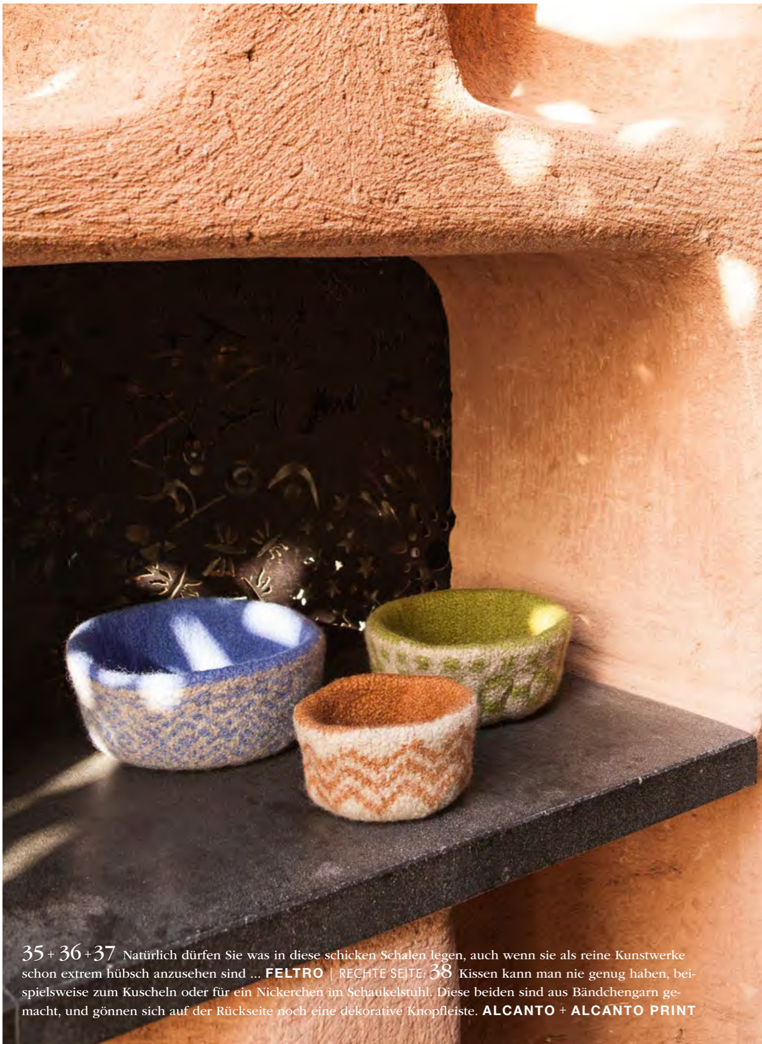
35 + 36 + 37 Natürlich dürfen Sie was in diese schicken Schalen legen, auch wenn sie als reine Kunstwerke schon extrem hübsch anzusehen sind ... FELTRO | RECHTE SEITE: 38 Kissen kann man nie genug haben, beispielsweise zum Kuscheln oder für ein Nickerchen im Schaukelstuhl. Diese beiden sind aus Bändchengarn gemacht, und gönnen sich auf der Rückseite noch eine dekorative Knopfleiste. ALCANTO + ALCANTO PRINT