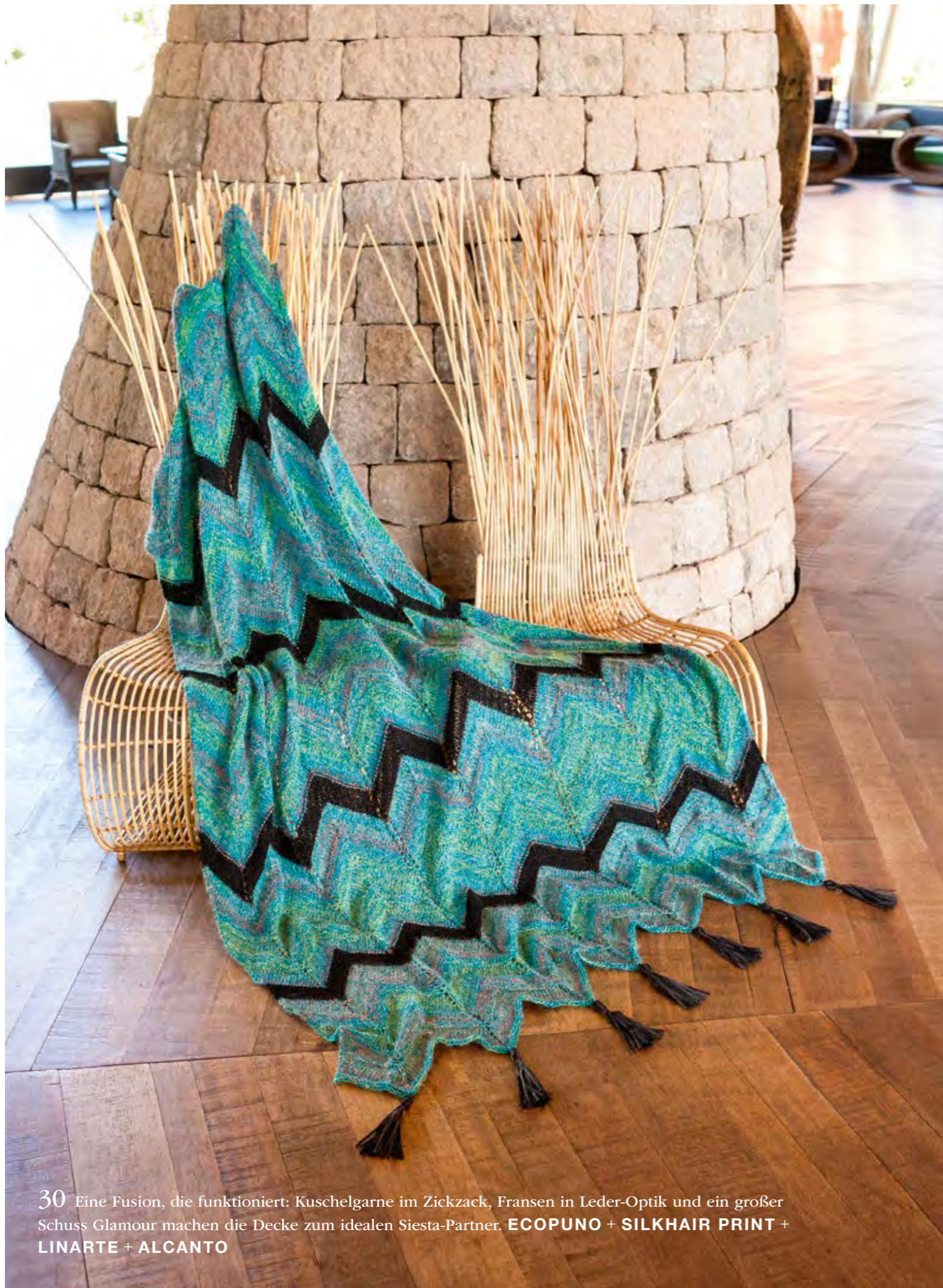
30 Eine Fusion, die funktioniert: Kuschelgarne im Zickzack, Fransen in Leder-Optik und ein großer Schuss Glamour machen die Decke zum idealen Siesta-Partner. ECOPUNO + SILKHAIR PRINT + LINARTE + ALCANTO