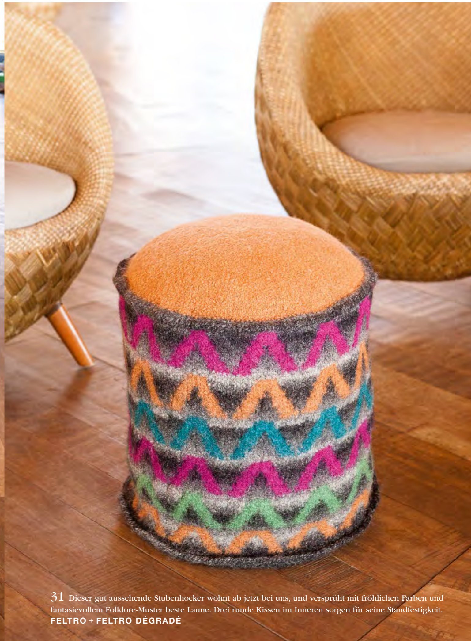
31 Dieser gut aussehende Stubenhocker wohnt ab jetzt bei uns, und versprüht mit fröhlichen Farben und fantasievollem Folklore-Muster beste Laune. Drei runde Kissen im Inneren sorgen für seine Standfestigkeit. FELTRO + FELTRO DÉGRADÉ