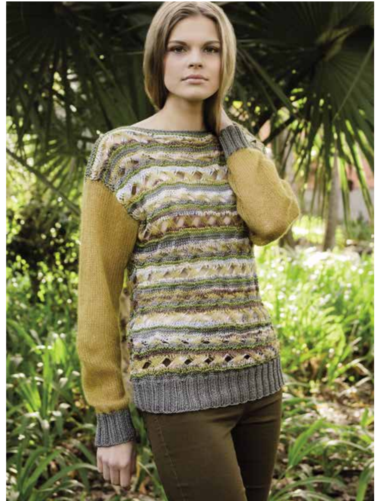
LINKE SEITE: 3 Naturschönheit: Das Ajourmuster-Top aus khakifarbenem Bändchengarn, das – hier und da – mit schillernder Bronze bedruckt ist. ROMA DÉGRADÉ | DIESE SEITE: 4 Garne, Muster, Farben – hier ist alles bunt gemischt. Warum? Weil auch der Dschungel durch Vielfalt begeistert. SETA + DIFUSO + ALLEGRO + SILKHAIR