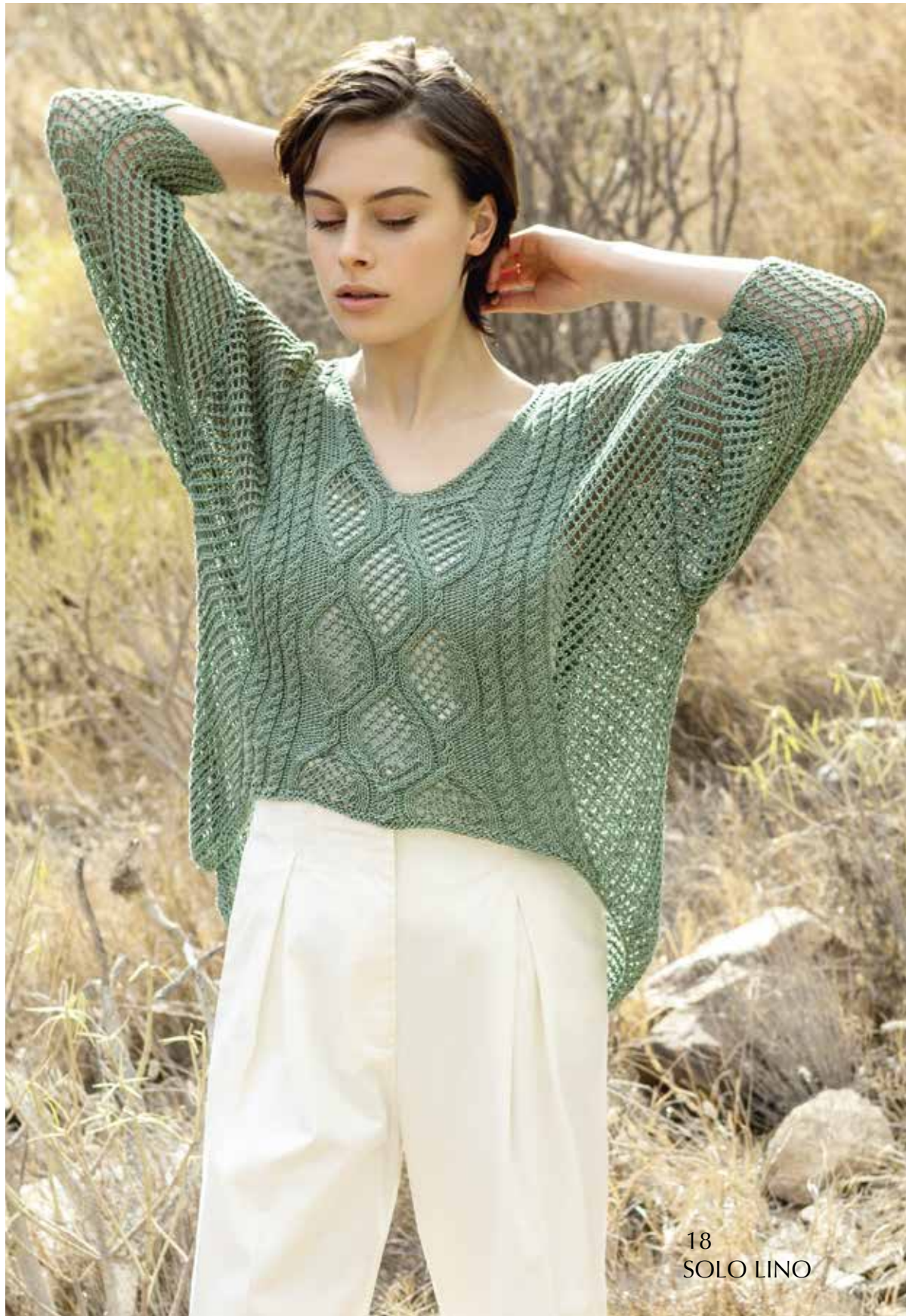
18 SOLO LINO