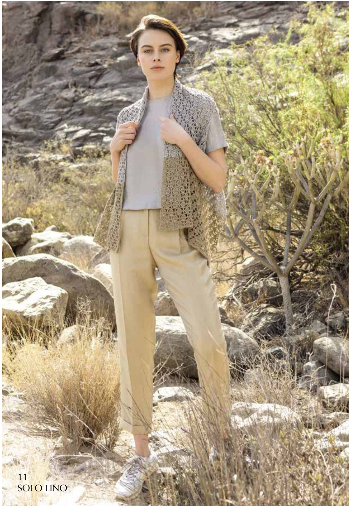
11 SOLO LINO