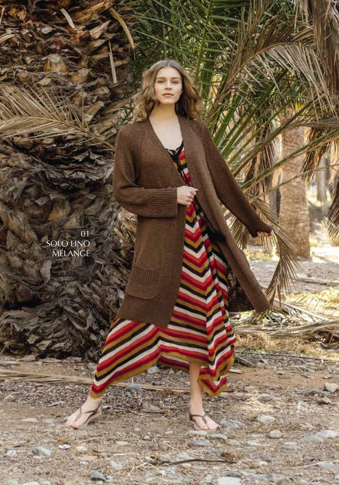
01 SOLO LINO MÉLANGE