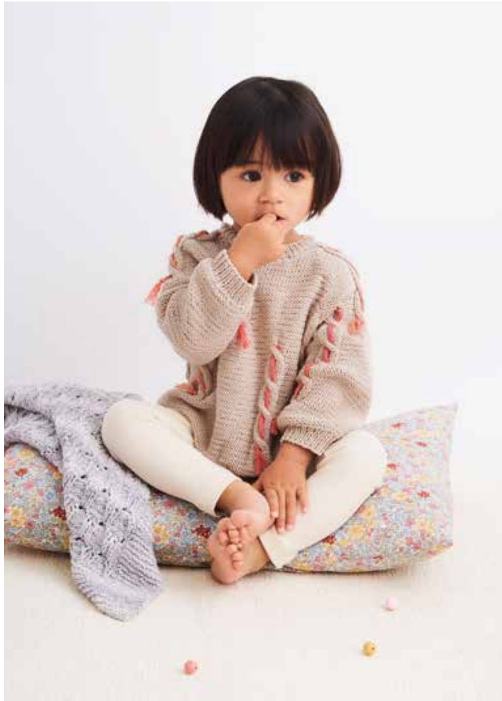
30 - Pullover • Elastico • 31 - Decke • Jolie Dégradé