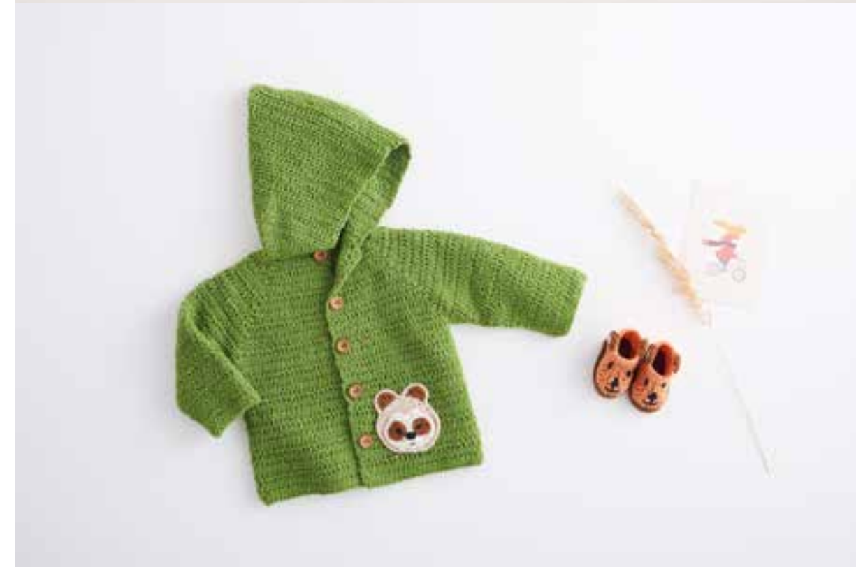
7 - Jacke • Jolie & Soft Cotton • 8 - Schühche • Soft Cotton