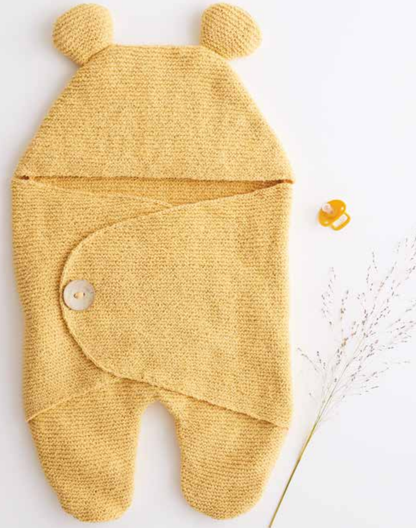
9 - Schlafsack • Jolie