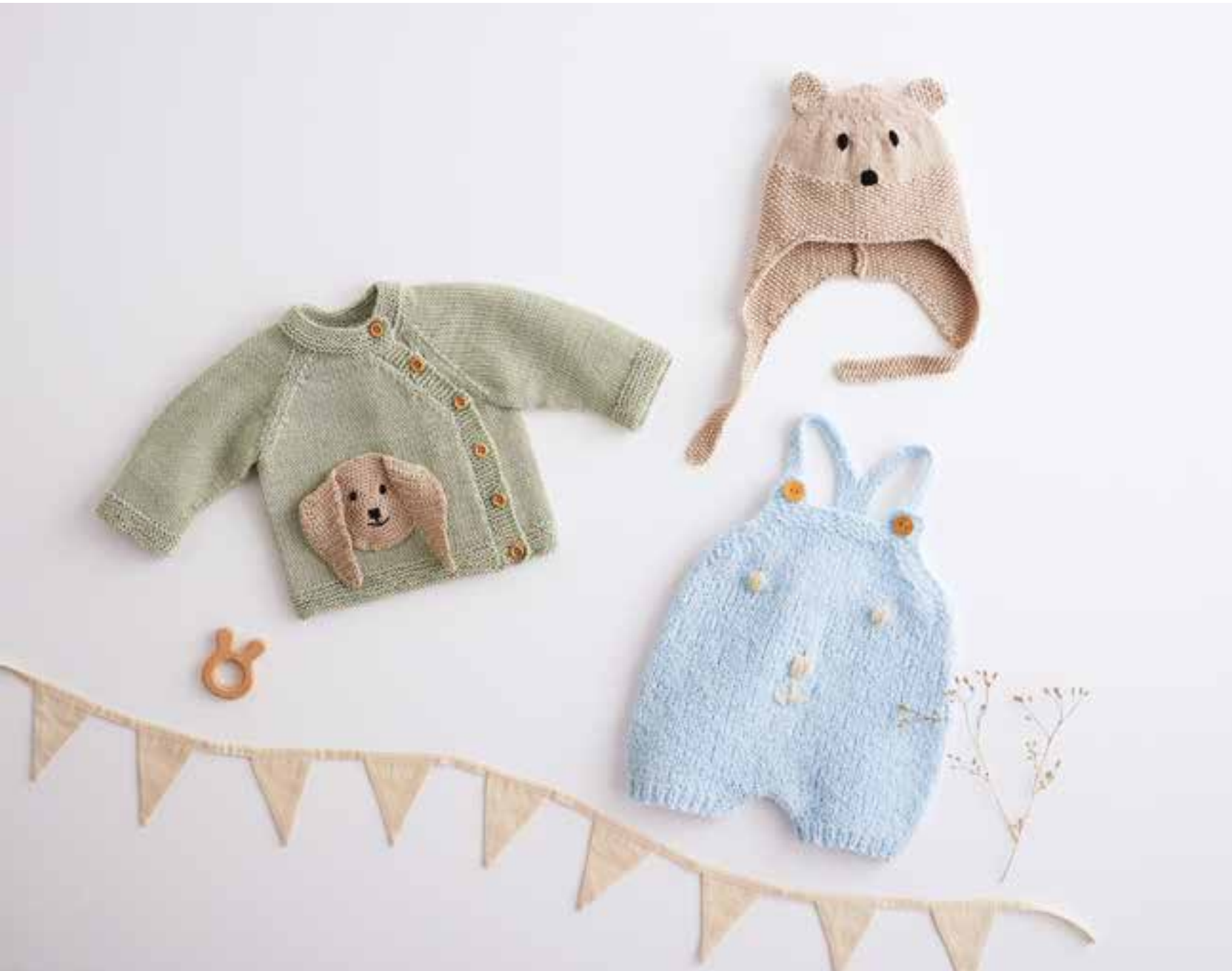
01 - Mütze • Elastico • 02 - Latzhose • Jolie • 03 - Jacke • Cotton Love