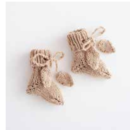
10 - Decke • Cool Wool Baby • 11- Strümpfe • Cool Wool Baby • 12 - Mütze • Cool Wool Baby