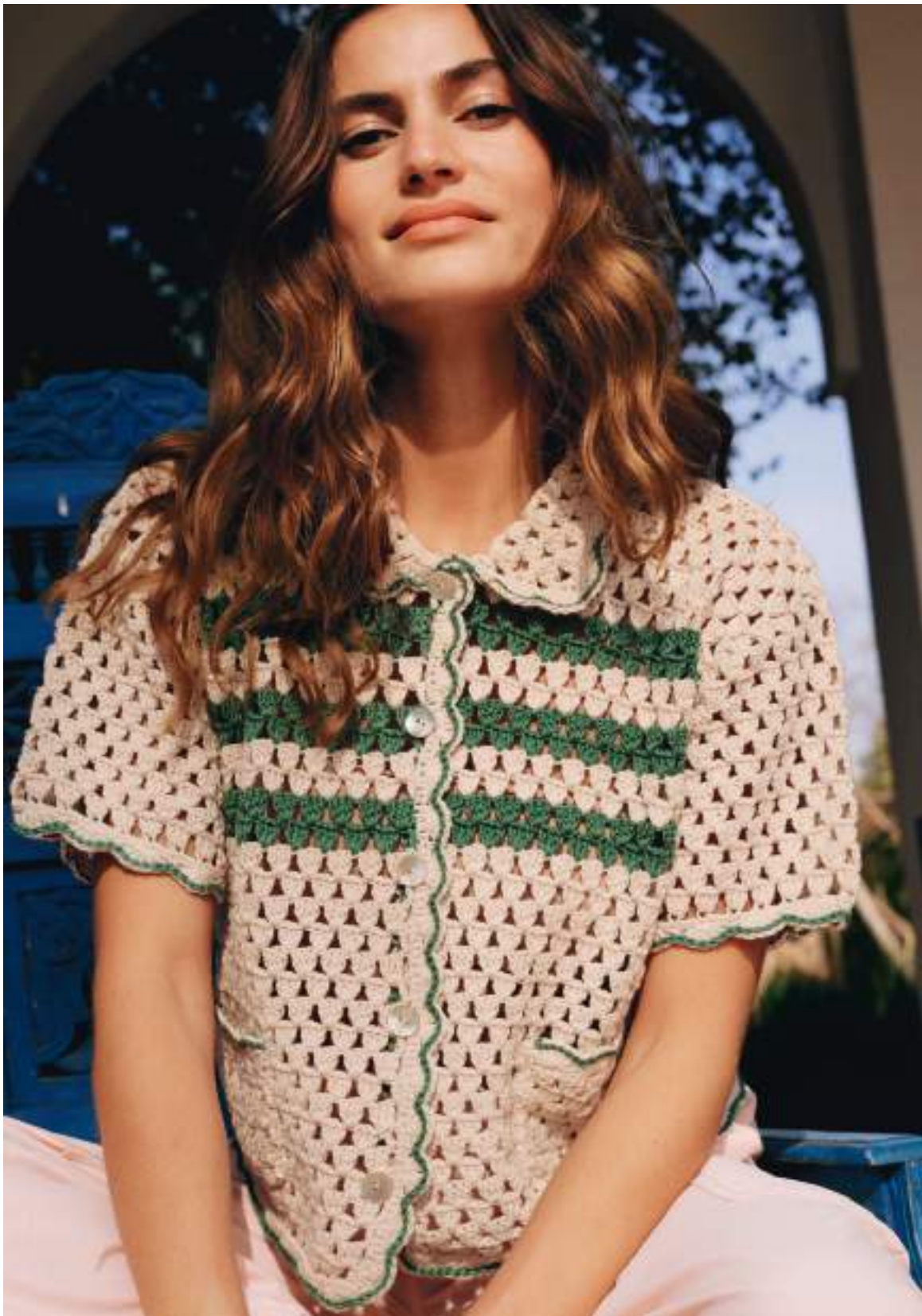
13 · Kurzes Polo-Hemd mit sportlichen Streifen aus LANDLUST BAUMWOLLE .