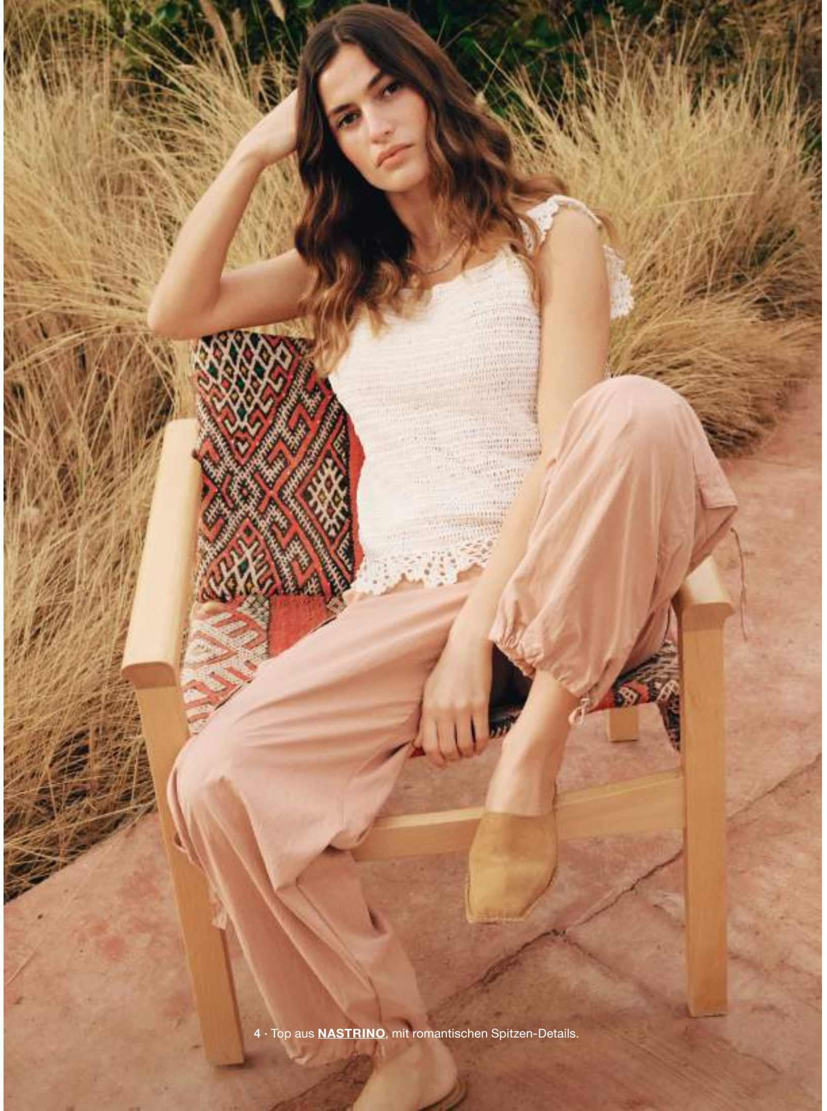
4 · Top aus NASTRINO , mit romantischen Spitzen-Details.