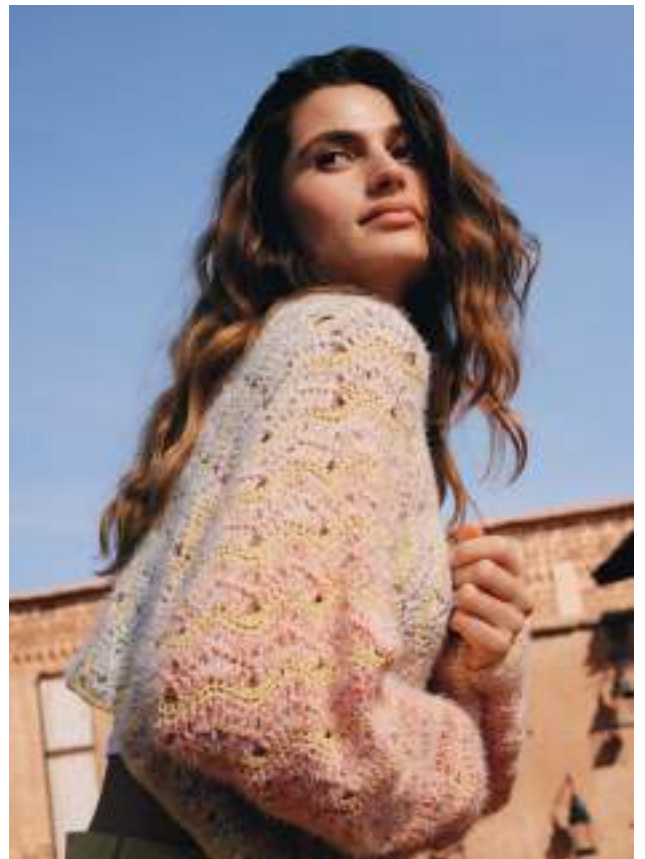
7 · Muster- und Materialmix in pastelligem Farbverlauf aus GOMITOLO SOLE, CAPRI & PER FORTUNA.