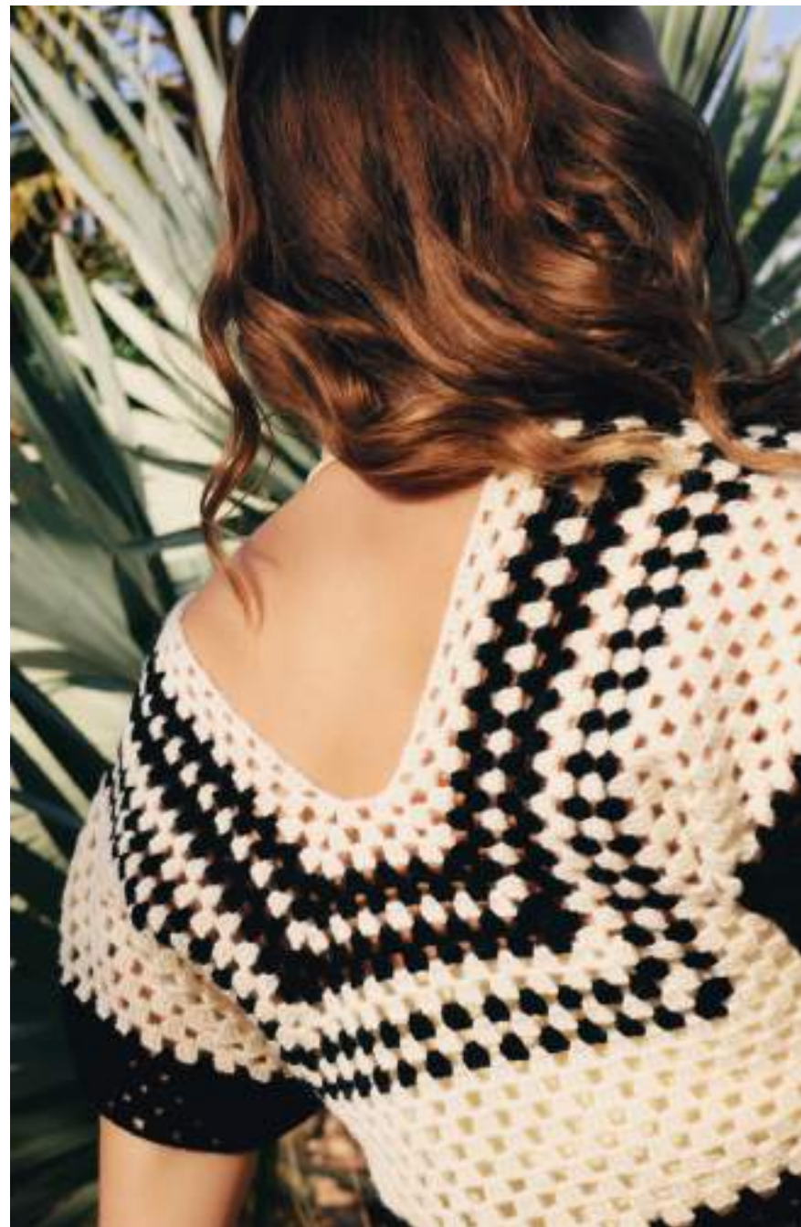
11 · Legere Passform, grafisches Muster und ultraleicht – Top aus ECOPUNO .