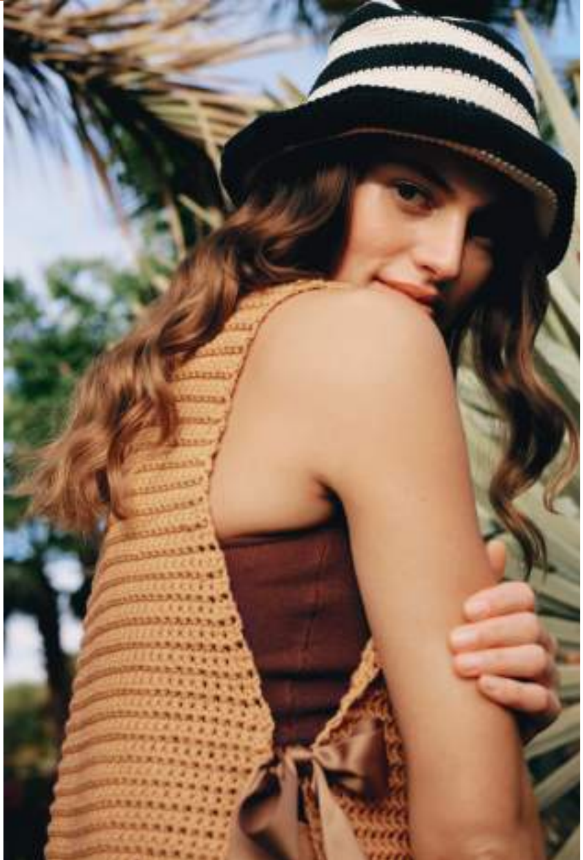
10 · Süßer Sommerhut, gestreift aus ORGANICO .