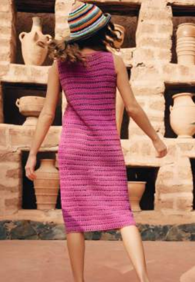
21 · Hut in bunten Ringeln aus ORGANICO .