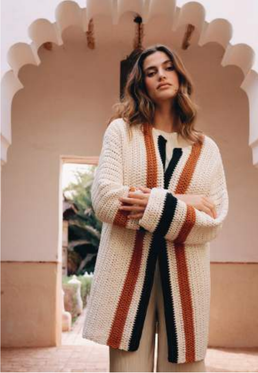
14 · Cardigan mit Kontraststreifen aus THE TUBE FINE .