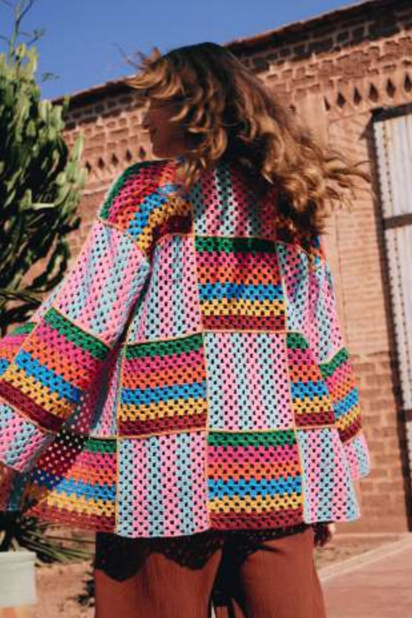
18 · Übergroßer, doppelreihiger Cardigan mit gestreiften Squares für den ultimativen Patchwork-Look aus ELASTICO .