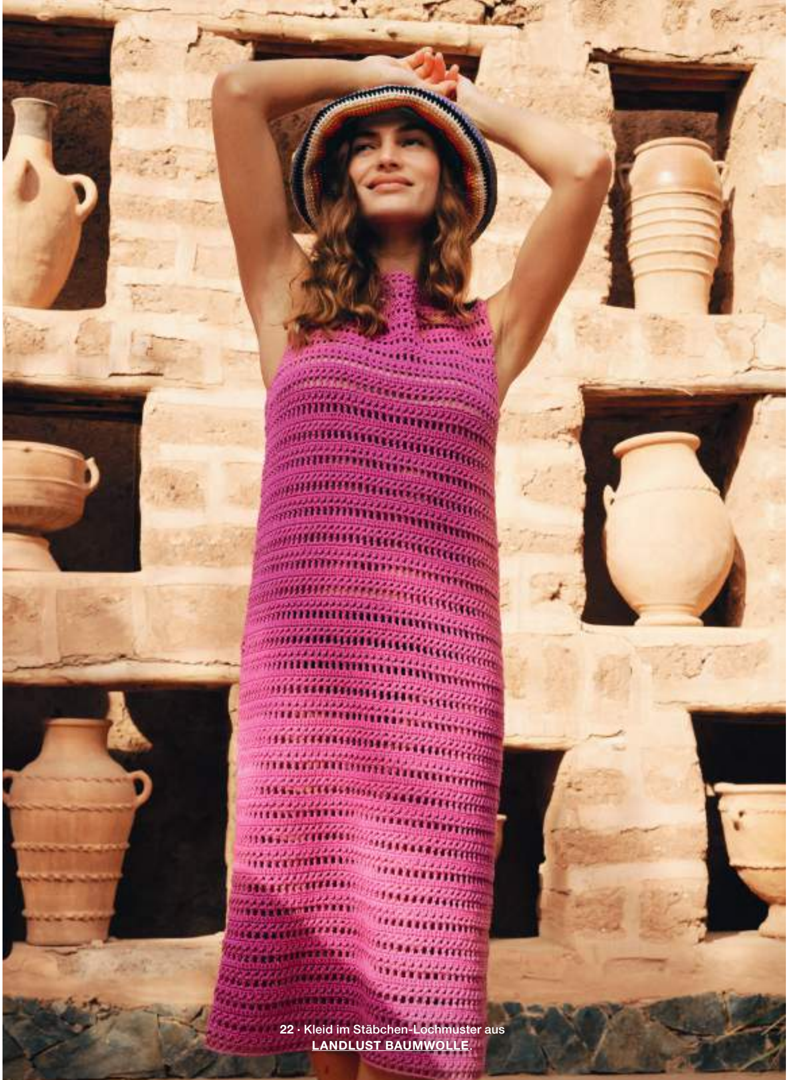
22 · Kleid im Stäbchen-Lochmuster aus LANDLUST BAUMWOLLE.