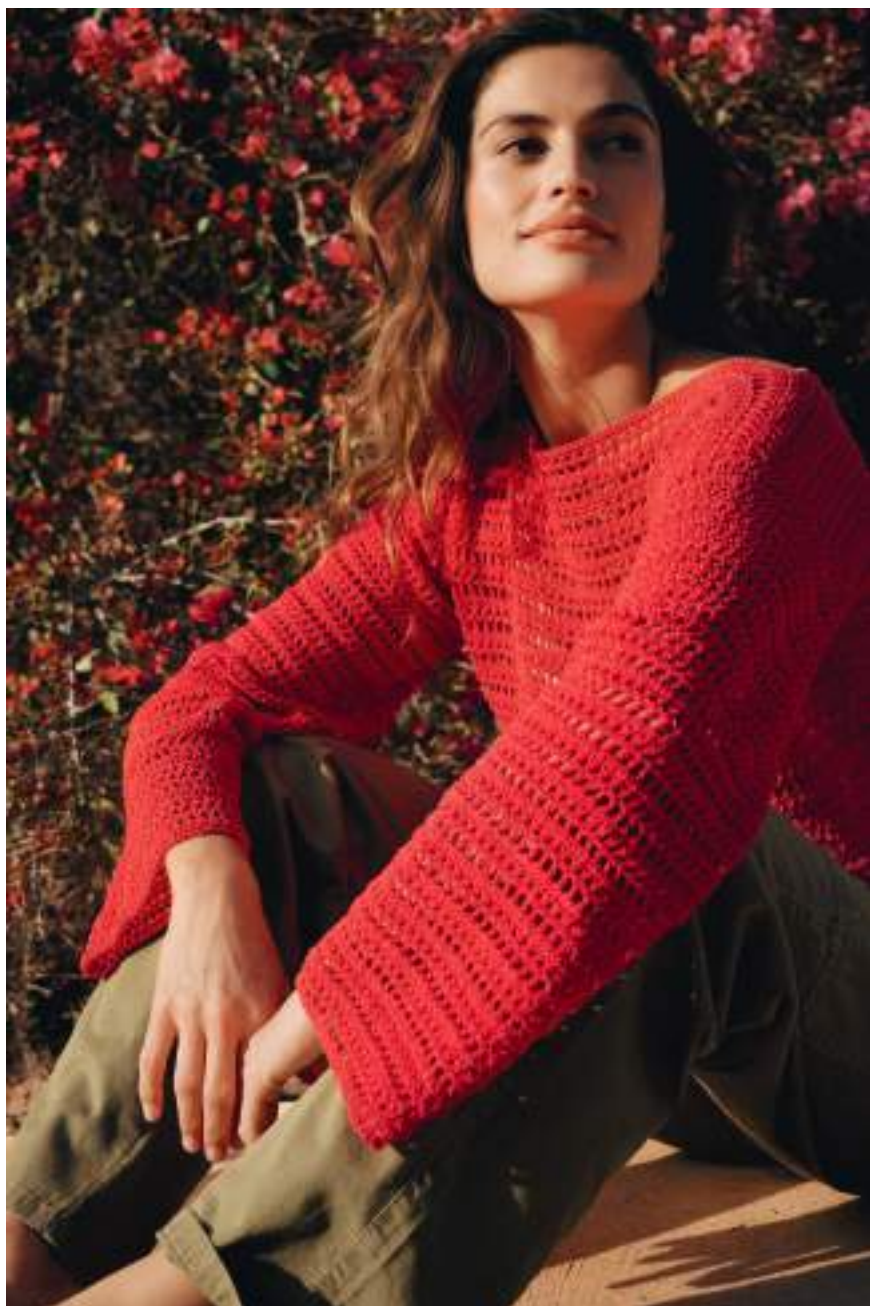
30 · Pullover mit U-Boot-Ausschnitt und geraden Ärmeln aus CAPRI .