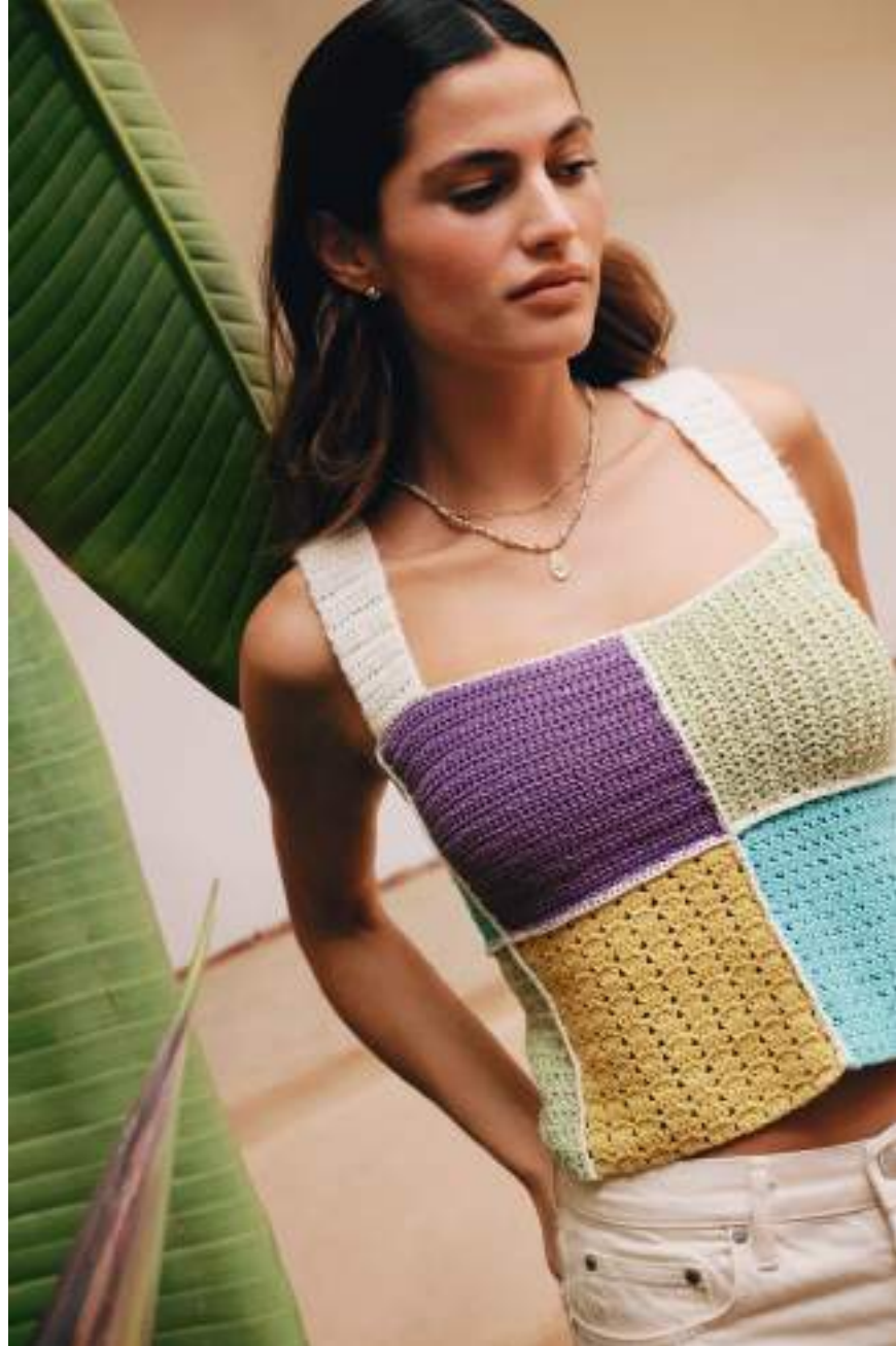
26 · Muster-Patchwork aus SOLO LINO mit Flausch auf den Trägern aus PER FORTUNA .