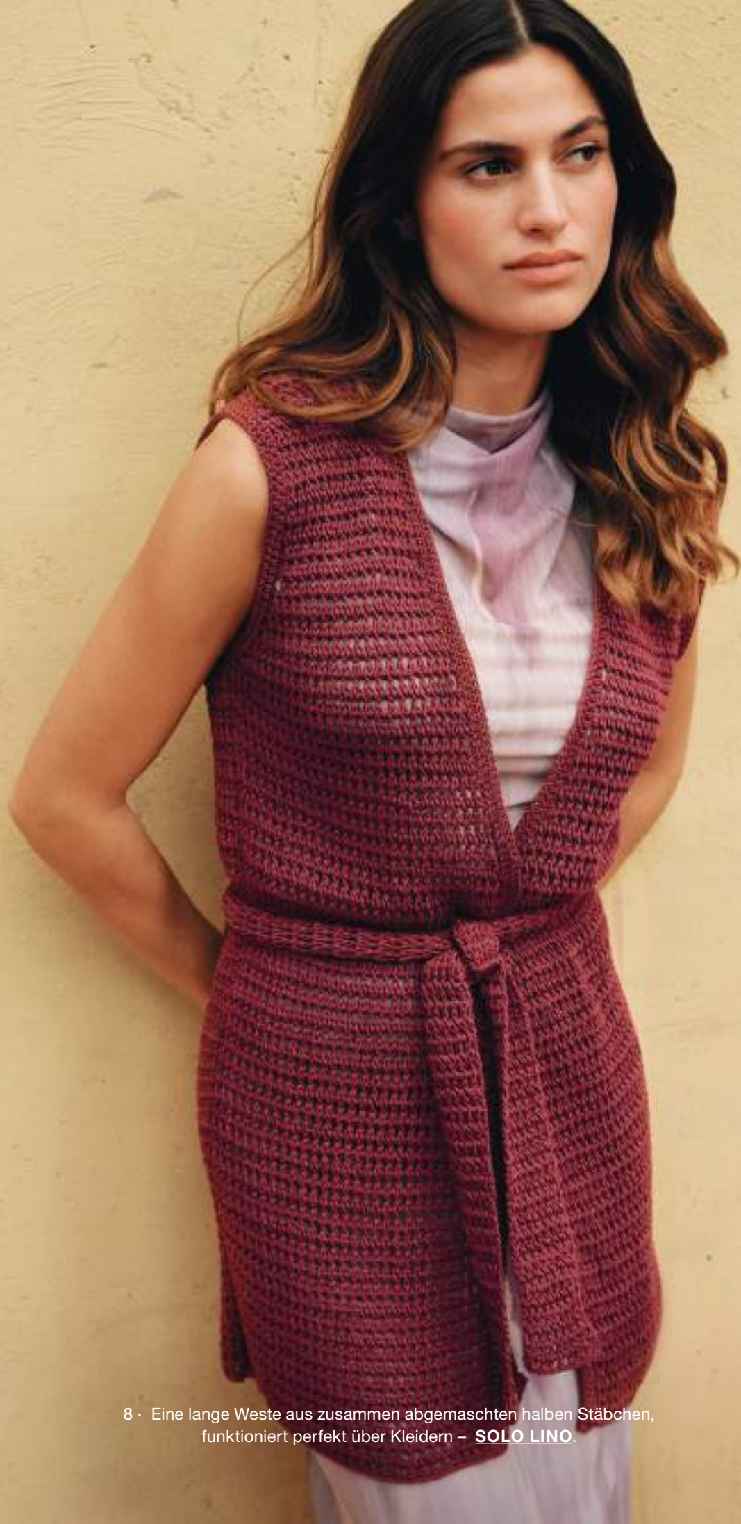
8 · Eine lange Weste aus zusammen abgemaschten halben Stäbchen, funktioniert perfekt über Kleidern – SOLO LINO.