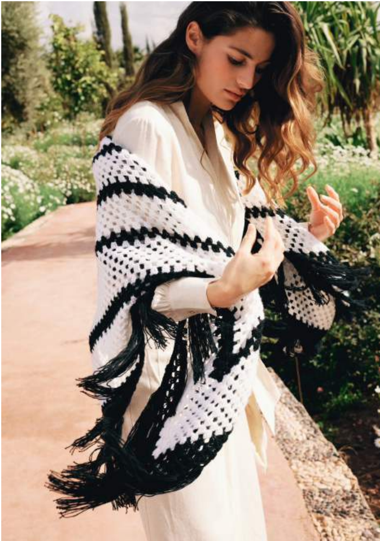
5 · Ein riesengroßes Granny aus ECOPUNO – bei uns als Tuch mit Fransen getragen.