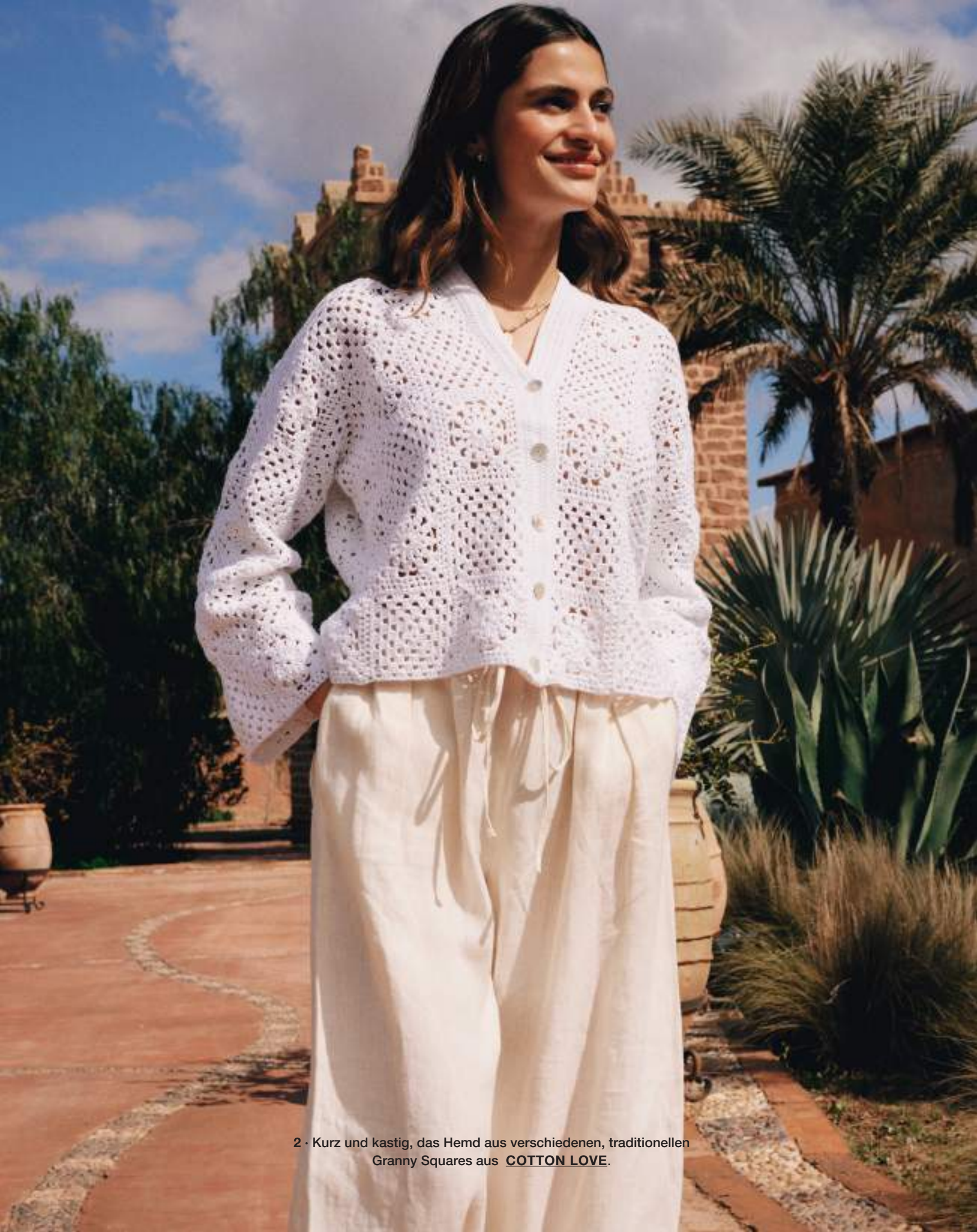
2 · Kurz und kastig, das Hemd aus verschiedenen, traditionellen Granny Squares aus COTTON LOVE .