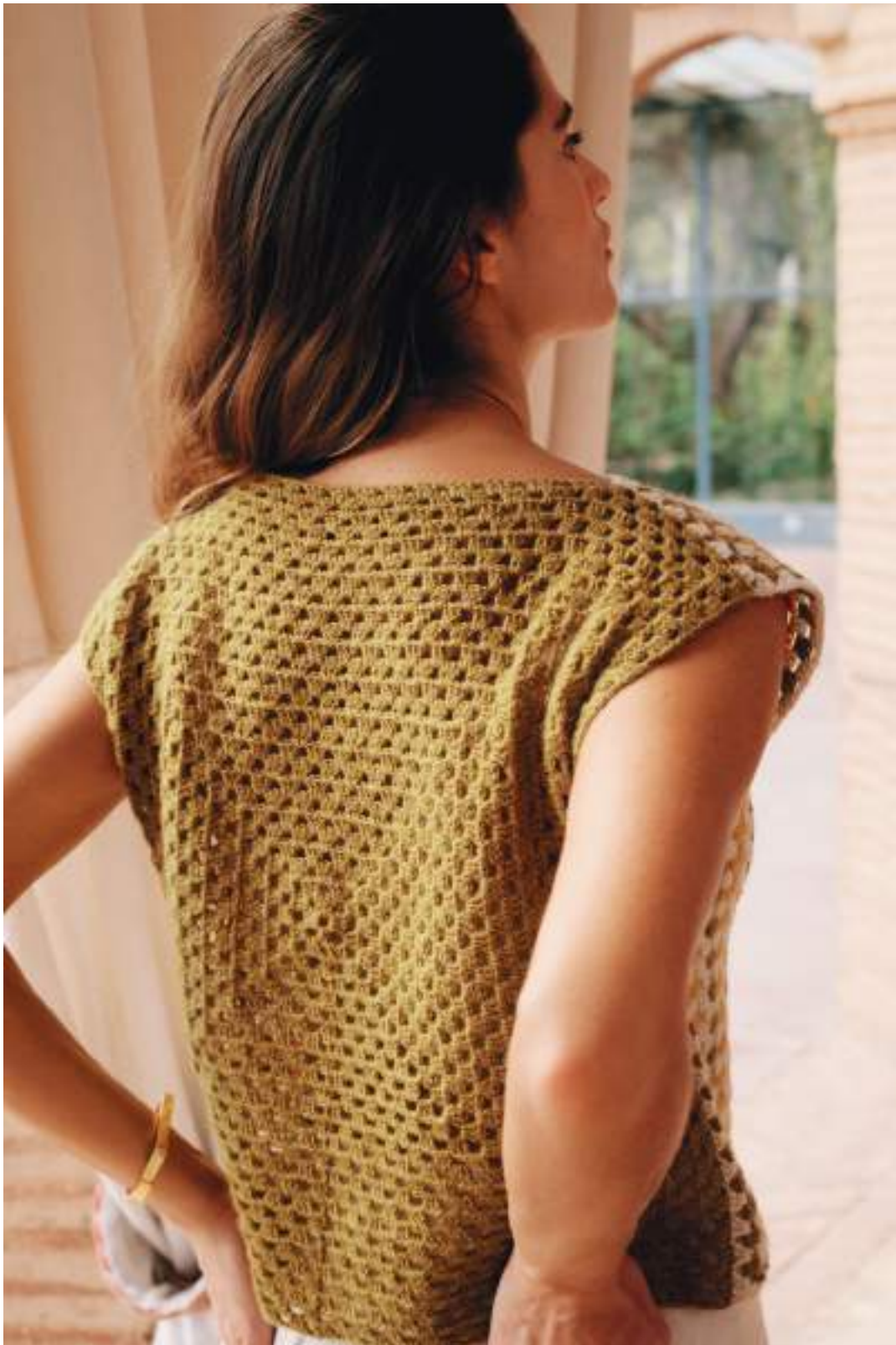
17 · Easy für Einsteiger – Top aus zwei Granny Squares, vorne gemustert, hinten uni – aus ECOPUNO .