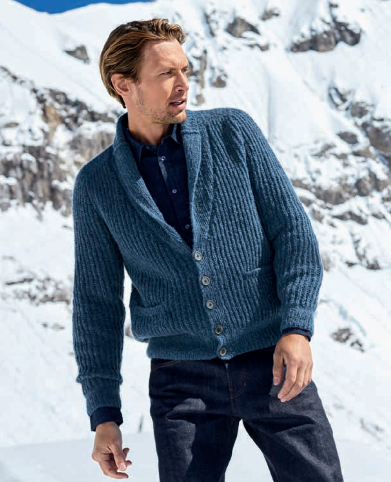
Cool Air Fine 05 | 06 Slow Wool Canapa (hand dyed) & Slow Wool Canapa

Patentgestrickt und mit schmalem Schalkragen ist diese klassische Strickjacke mit schickem Hemd darunter durchaus in der Lage, es in die Chefetage zu schaffen, zumindest an Casual Fridays, sodass man nach Büroschluss ohne Verzögerung in die Berge düsen kann.