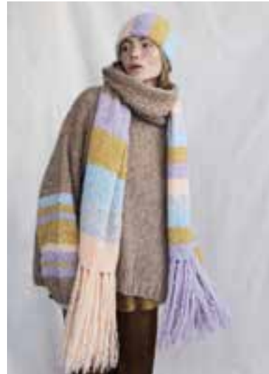
24 S. 43 LALA BERLIN HARMONY