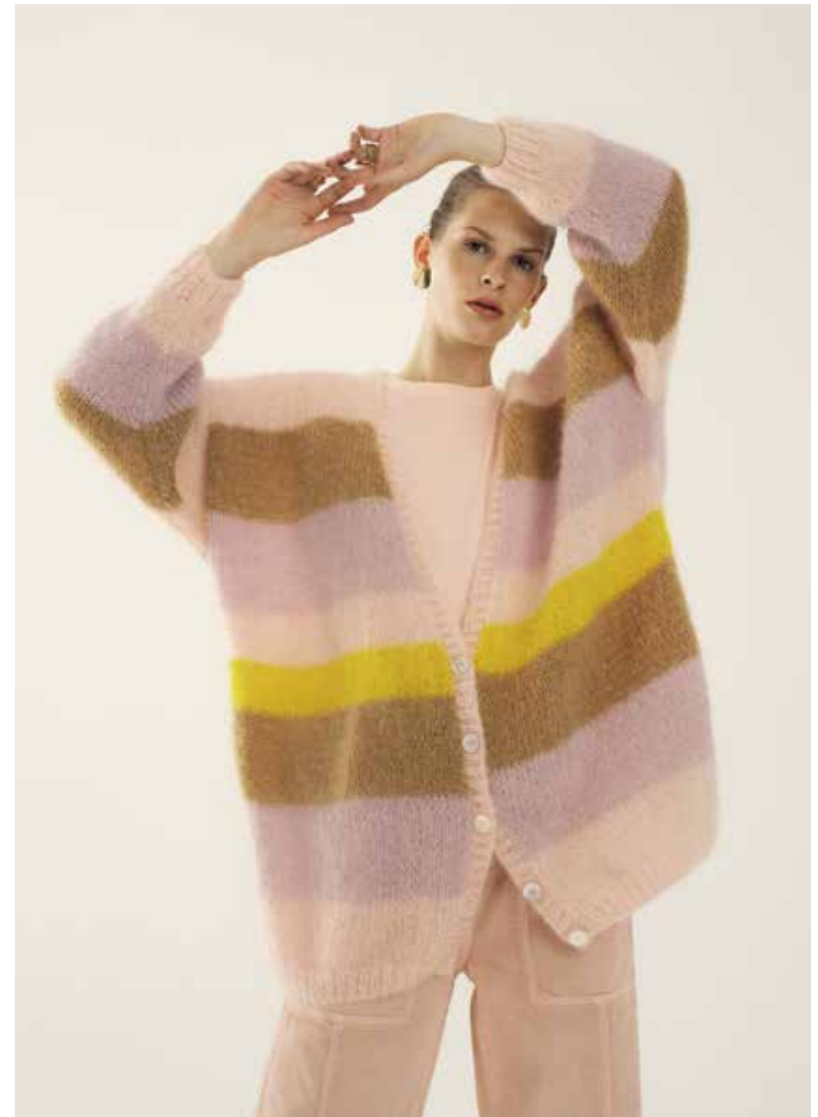
Left & Right 32 Jacke / Cardigan BRIGITTE NO. 3