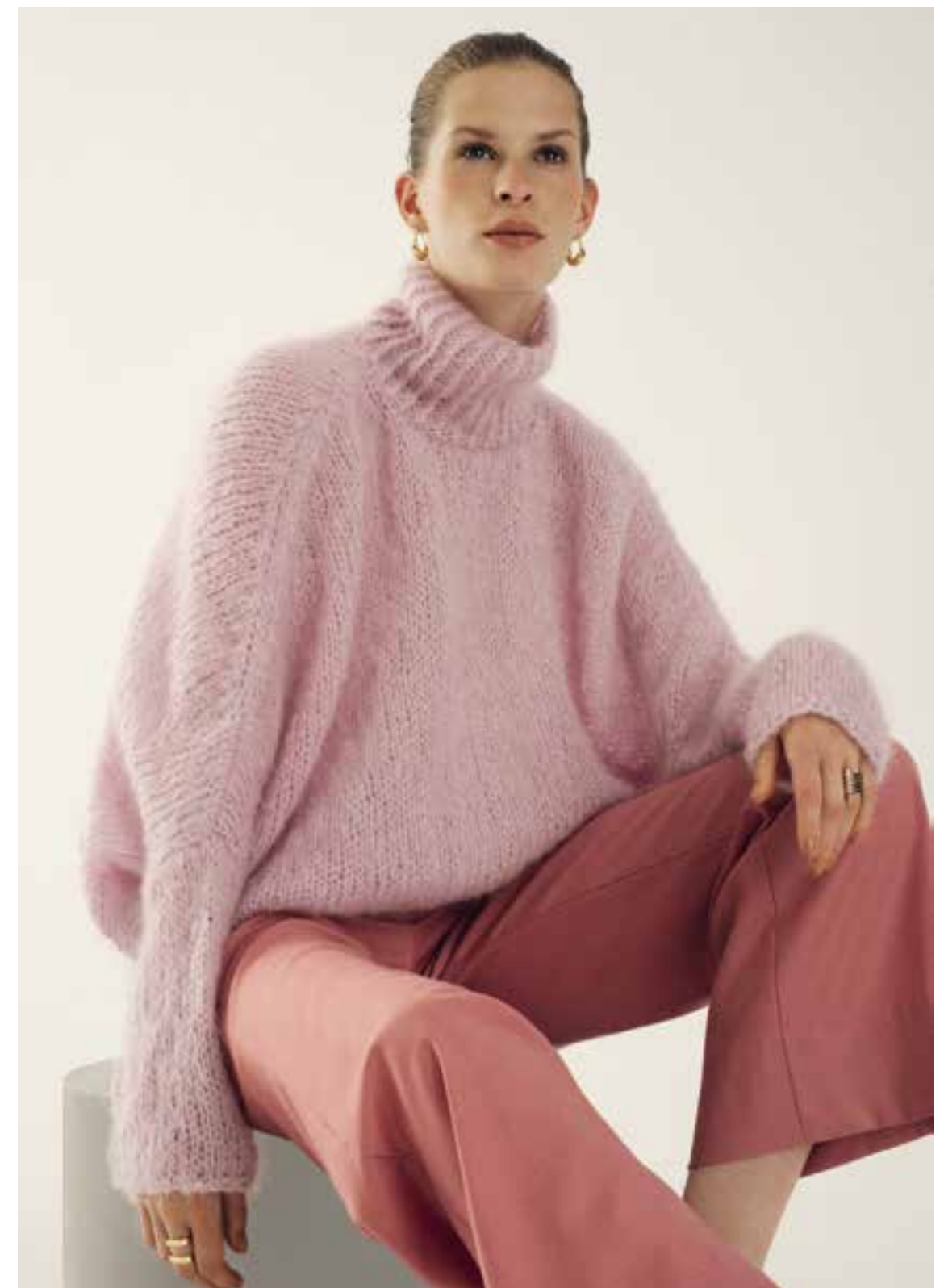
Left 38 Schal / Scarf BRIGITTE NO. 3