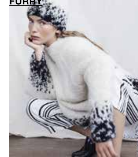
14 LALA BERLIN FURRY BICOLOR & LALA BERLIN FURRY S. 31