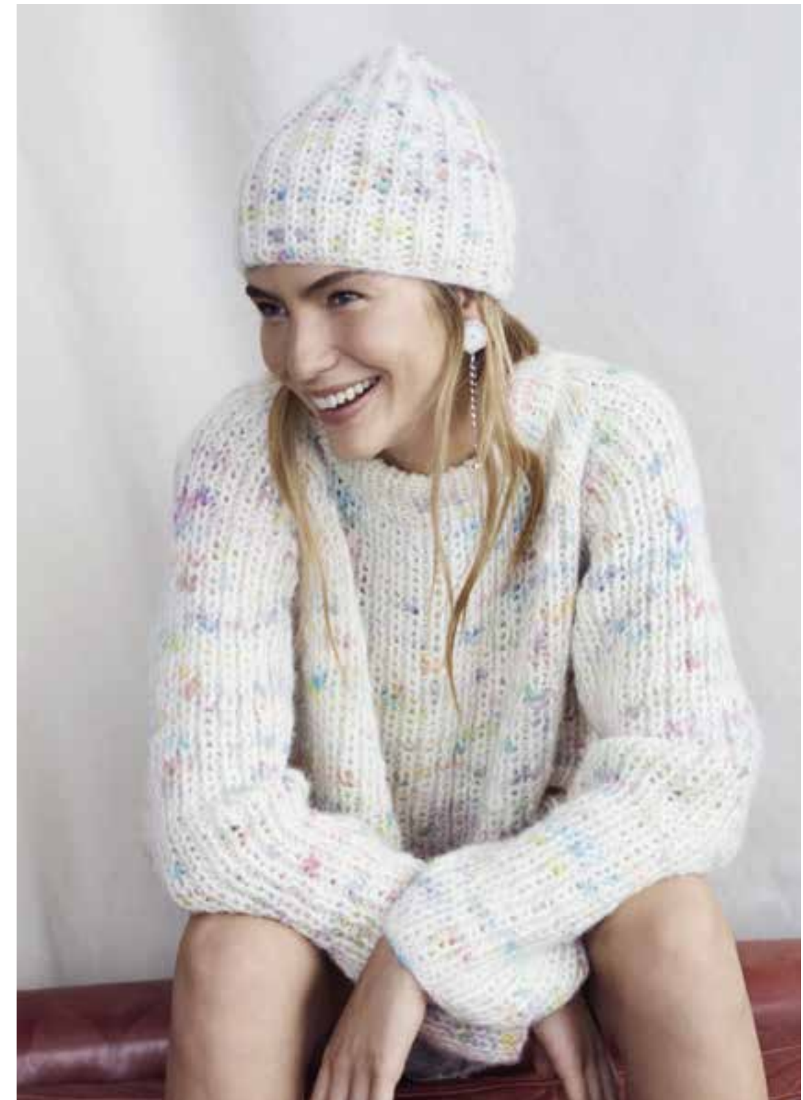
Left & Right 30 Pullover / Jumper LALA BERLIN LOVELY COTTON INSERTO 31 Mütze / Cap LALA BERLIN LOVELY COTTON INSERTO