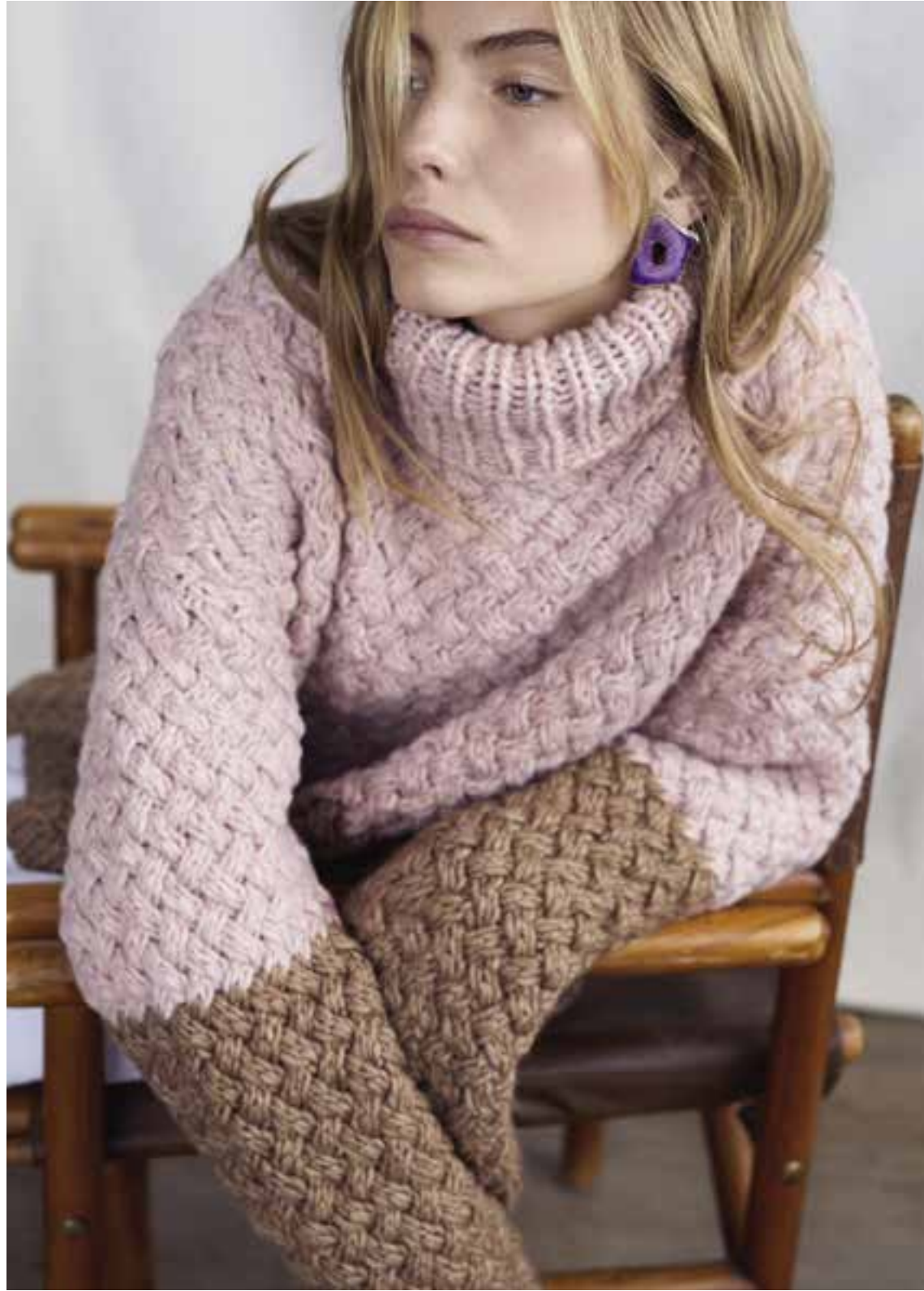
Left & Right 26 Pullover / Jumper LALA BERLIN LOVELY COTTON