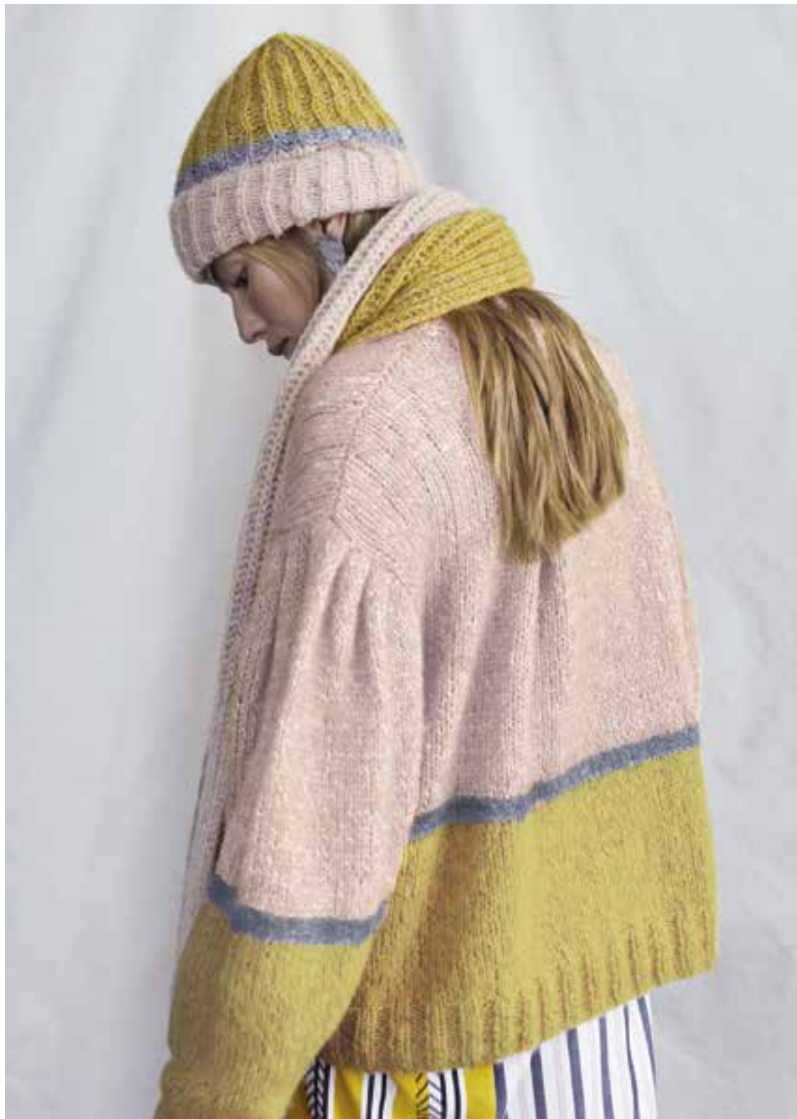
Left & Right 17 Mütze / Cap LALA BERLIN TWEEDY 18 Schal / Scarf LALA BERLIN TWEEDY 19 Pullover / Jumper LALA BERLIN TWEEDY