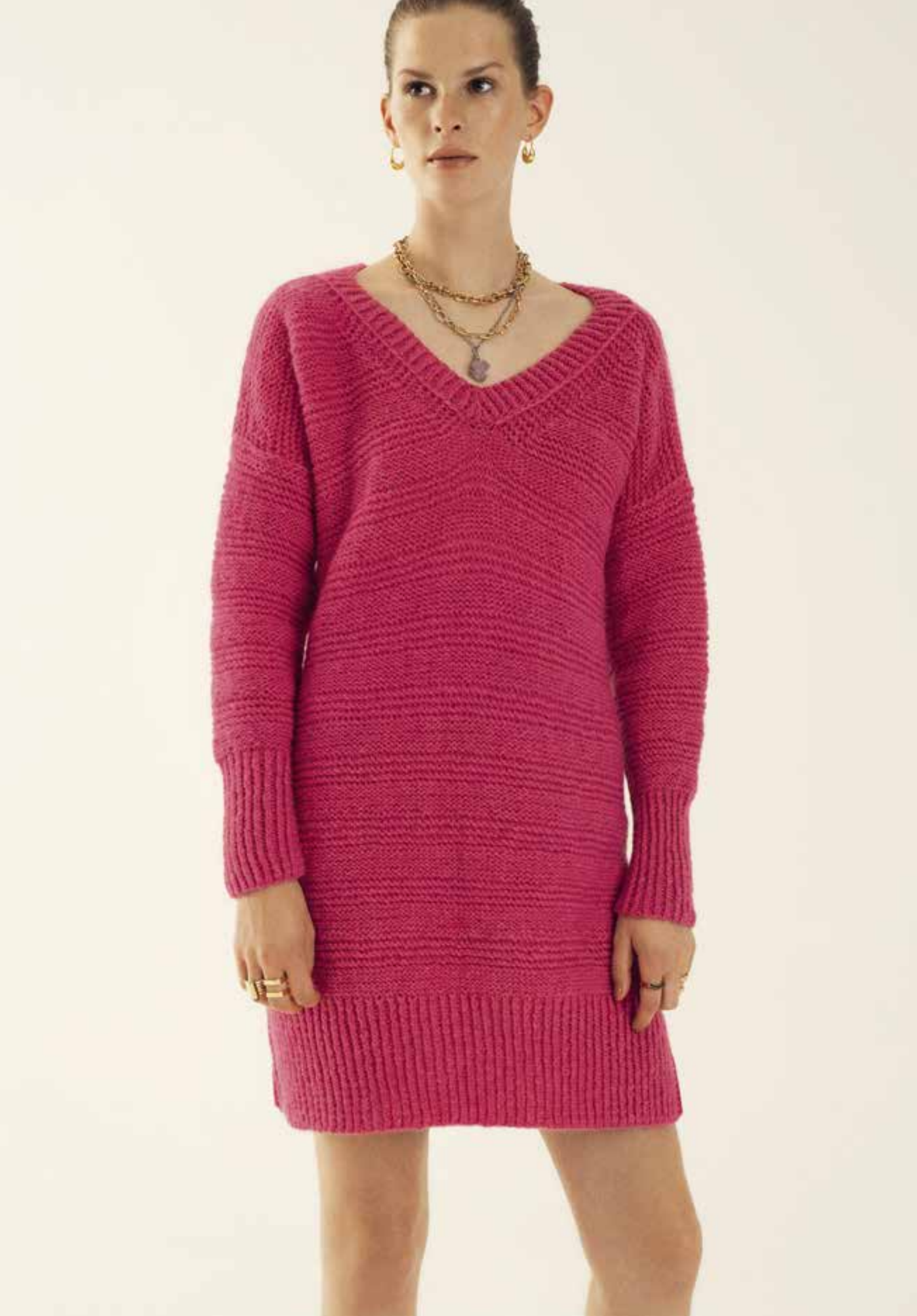
Left & Right 12 Kleid / Dress BRIGITTE NO. 2