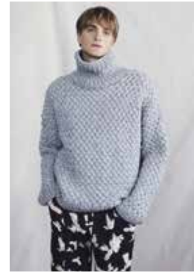
29 S. 46 LALA BERLIN LOVELY COTTON