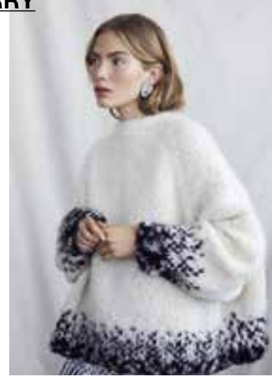
15 LALA BERLIN FURRY BICOLOR & LALA BERLIN FURRY S. 33