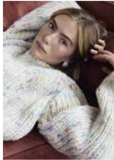
30 S. 48 LALA BERLIN LOVELY COTTON INSERTO