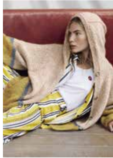
21 S. 39 LALA BERLIN TWEEDY