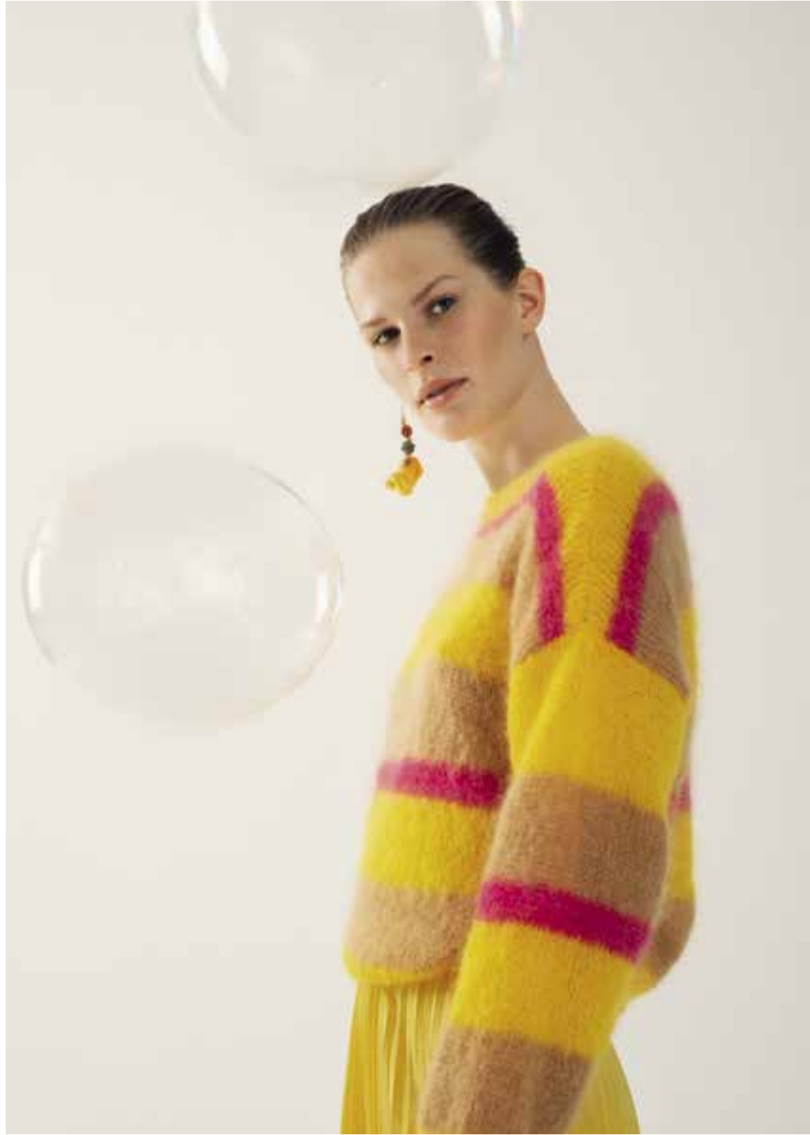
Left & Right 35 Pullover / Jumper BRIGITTE NO. 3