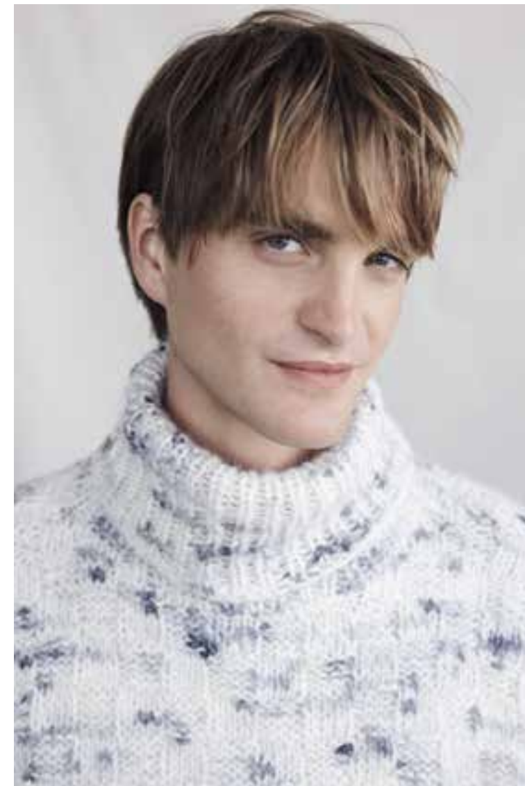
Right 16 Pullover / Jumper LALA BERLIN LOVELY COTTON INSERTO