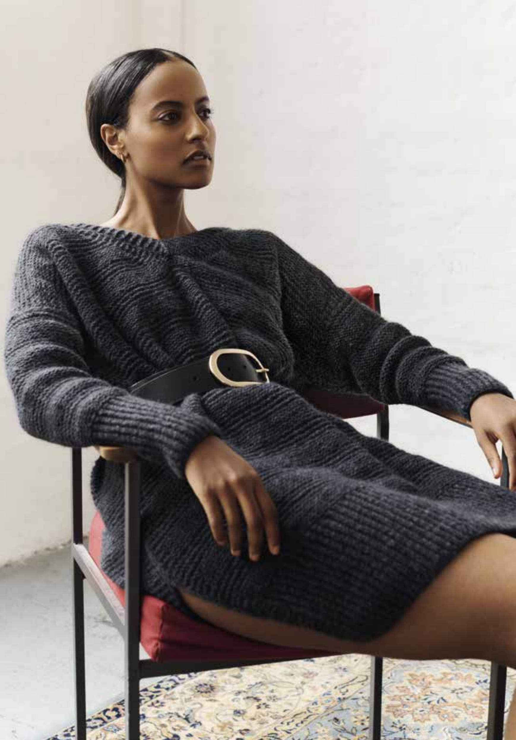
Left & Right 12 Kleid / Dress BRIGITTE NO. 2