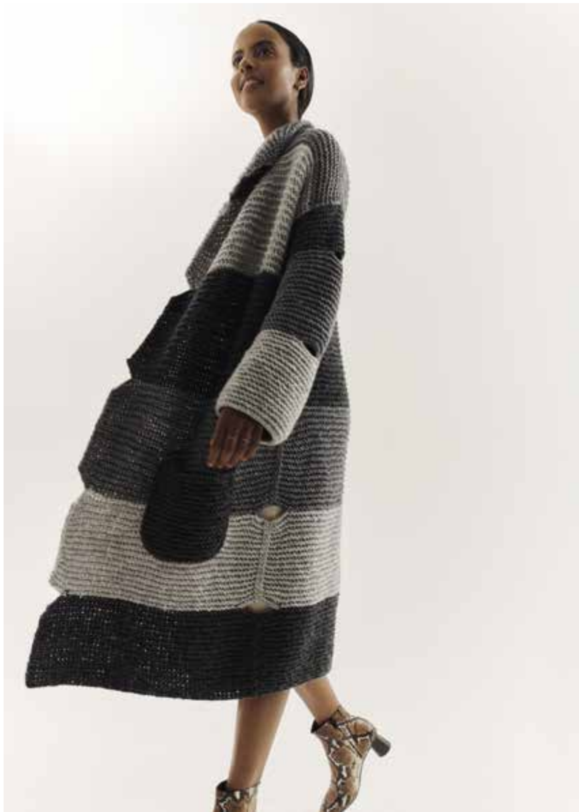
Left 08 Mantel / Coat LALA BERLIN LOVELY COTTON