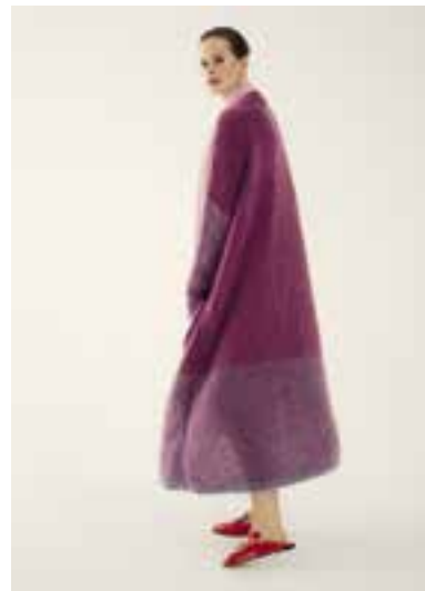
41 S. 69 BRIGITTE NO. 3