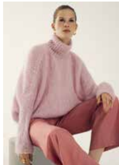
39 S. 65 BRIGITTE NO. 3