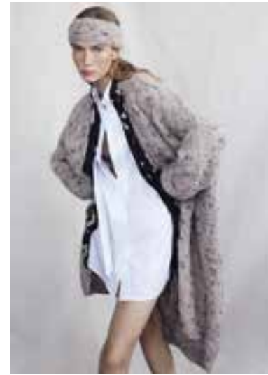
28 S. 46 LALA BERLIN LOVELY COTTON INSERTO