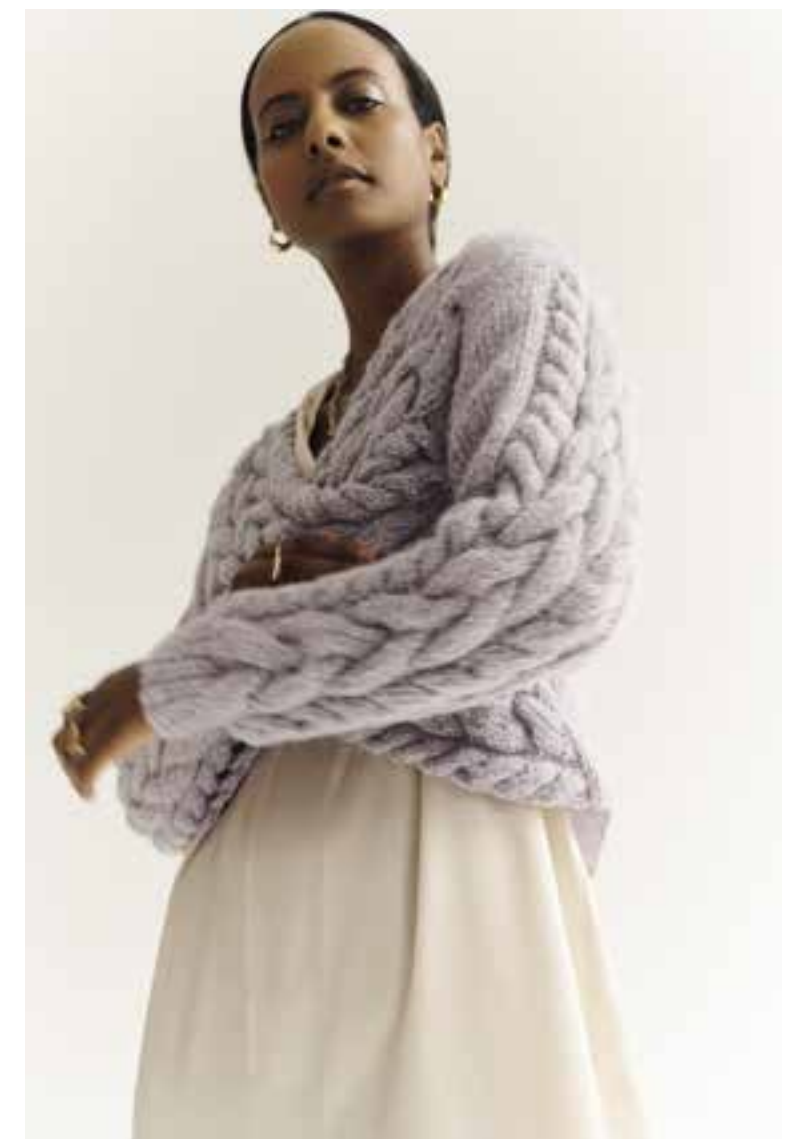
Left & Right 04 Pullover / Jumper SARA