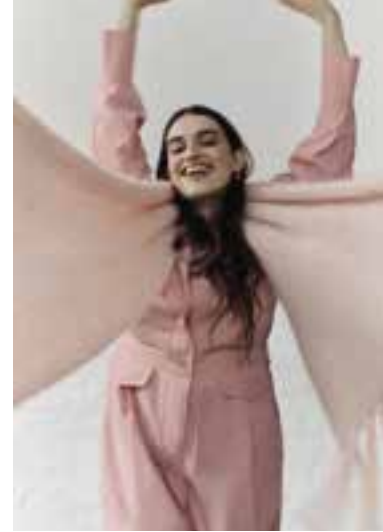
06 BRIGITTE NO. 3 & DIAMANTE S. 17