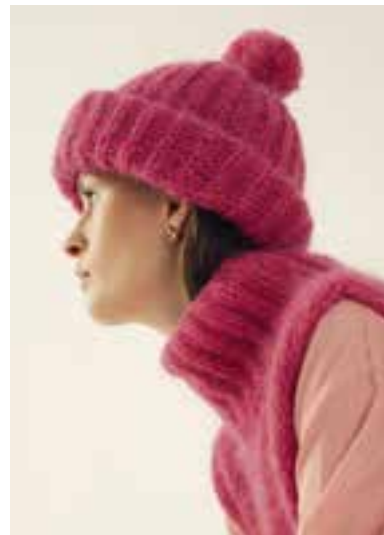
36 S. 63 BRIGITTE NO. 2 & BRIGITTE NO. 3