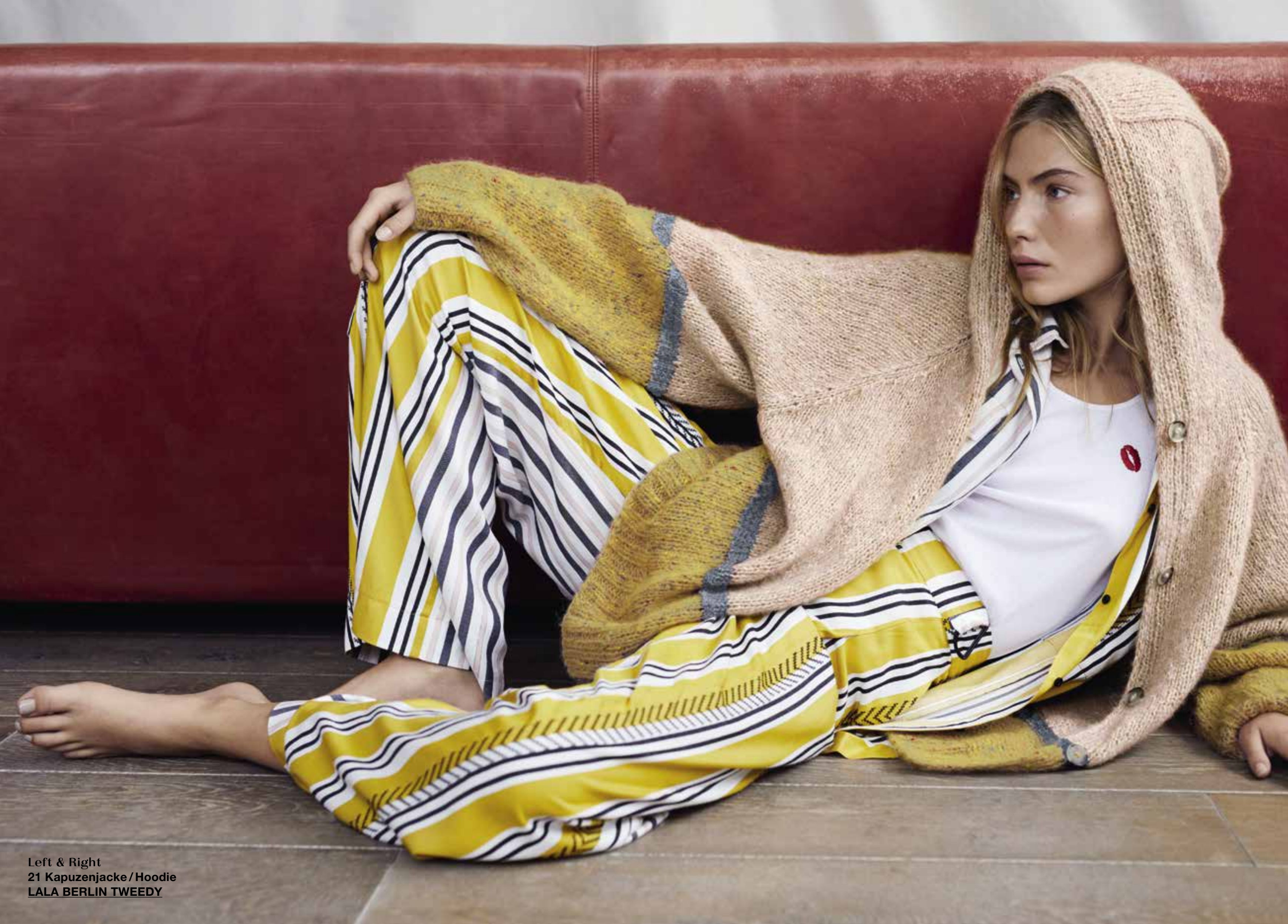
Left & Right 21 Kapuzenjacke/Hoodie LALA BERLIN TWEEDY