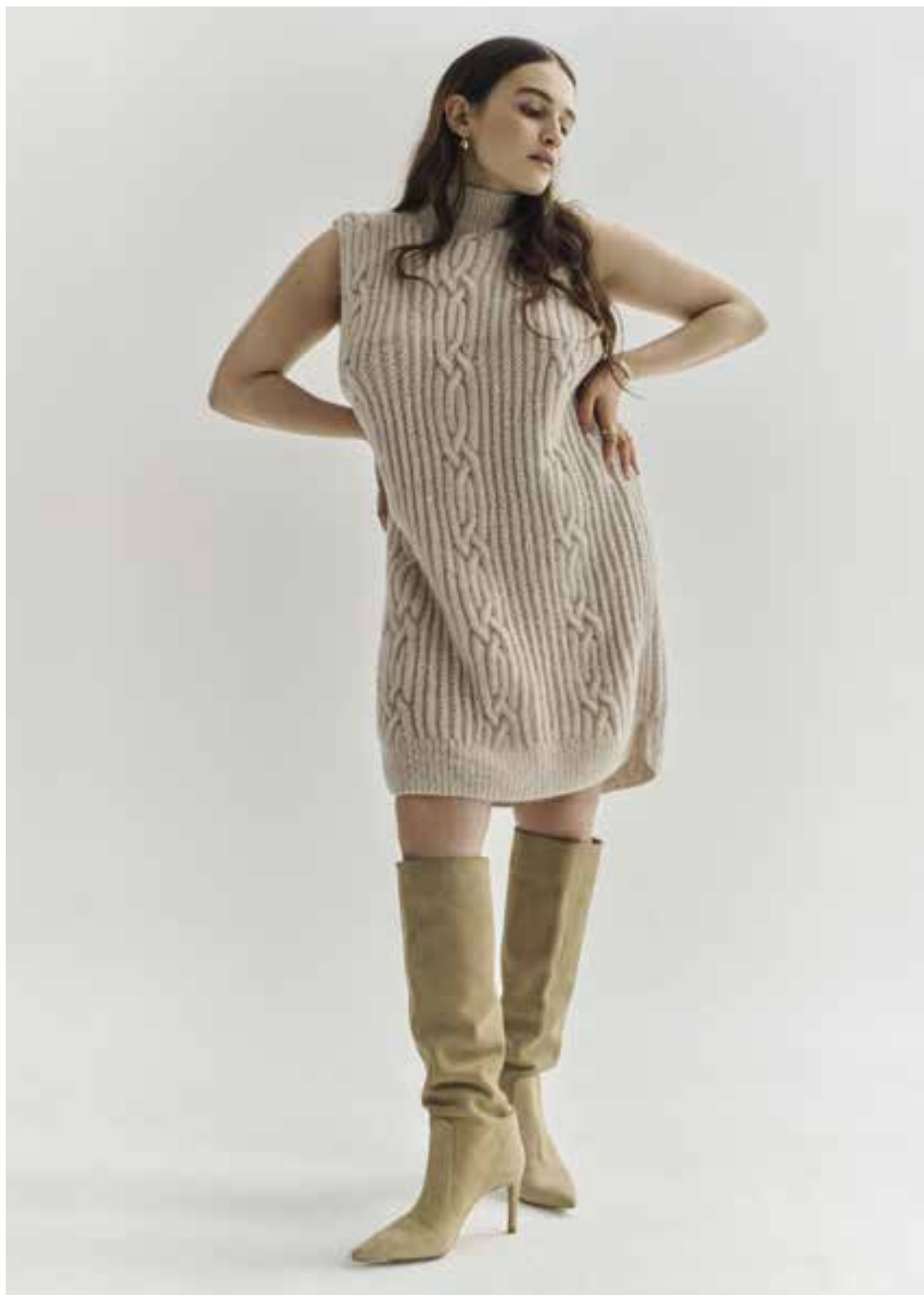
Left & Right 11 Kleid / Dress BABY LIGHT