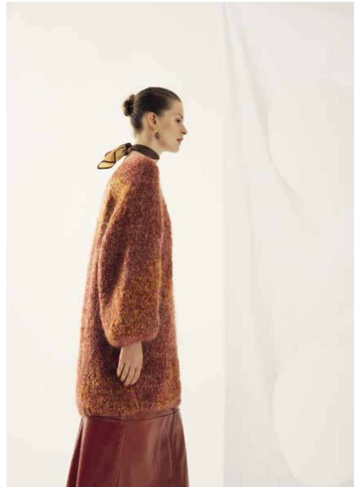
Left & Right 40 Pullover / Jumper LALA BERLIN HARMONY & BRIGITTE NO. 3