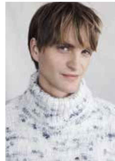
16 LALA BERLIN LOVELY COTTON INSERTO S. 33