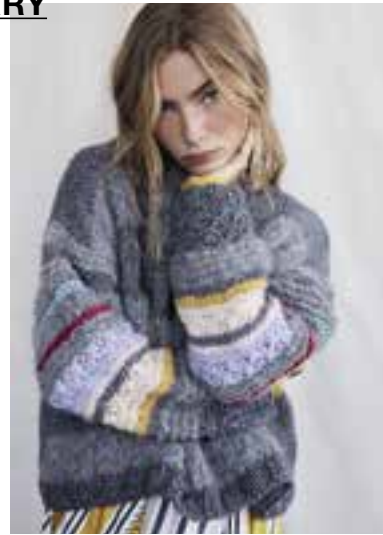
20 S. 36 LALA BERLIN LOVELY COTTON & LALA BERLIN FURRY