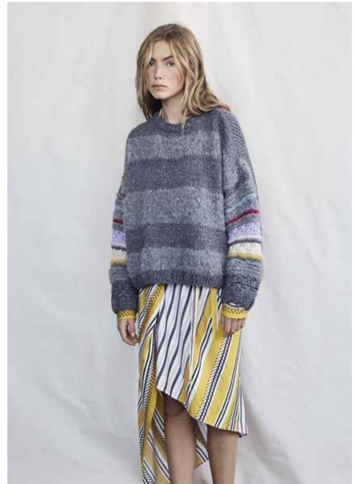
Left & Right 20 Pullover / Jumper LALA BERLIN LOVELY COTTON & LALA BERLIN FURRY