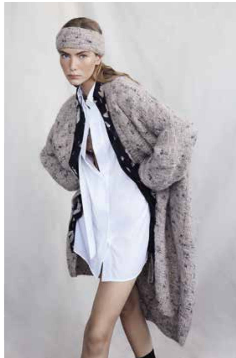
Right 27 Stirnband / Headband LALA BERLIN LOVELY COTTON INSERTO 28 Mantel / Coat LALA BERLIN LOVELY COTTON INSERTO