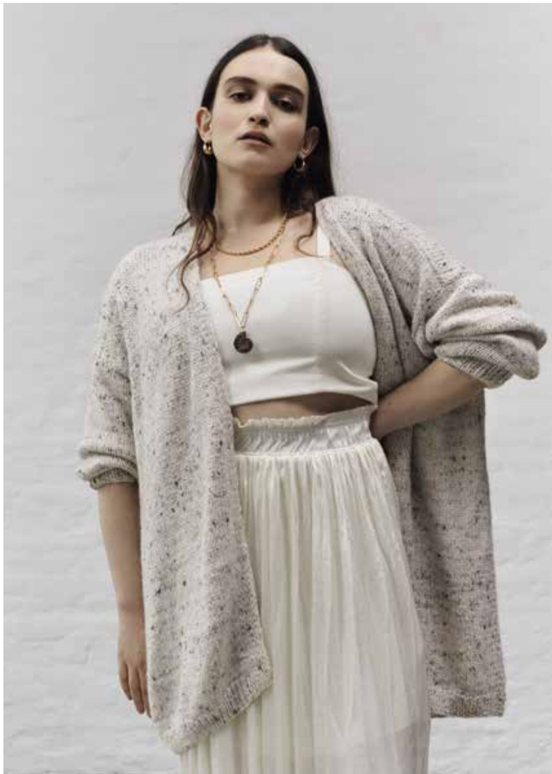
Left & Right 03 Jacke / Cardigan BENESSERE TWEED