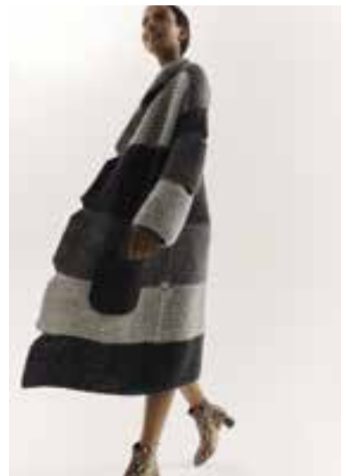
08 LALA BERLIN LOVELY COTTON S. 20