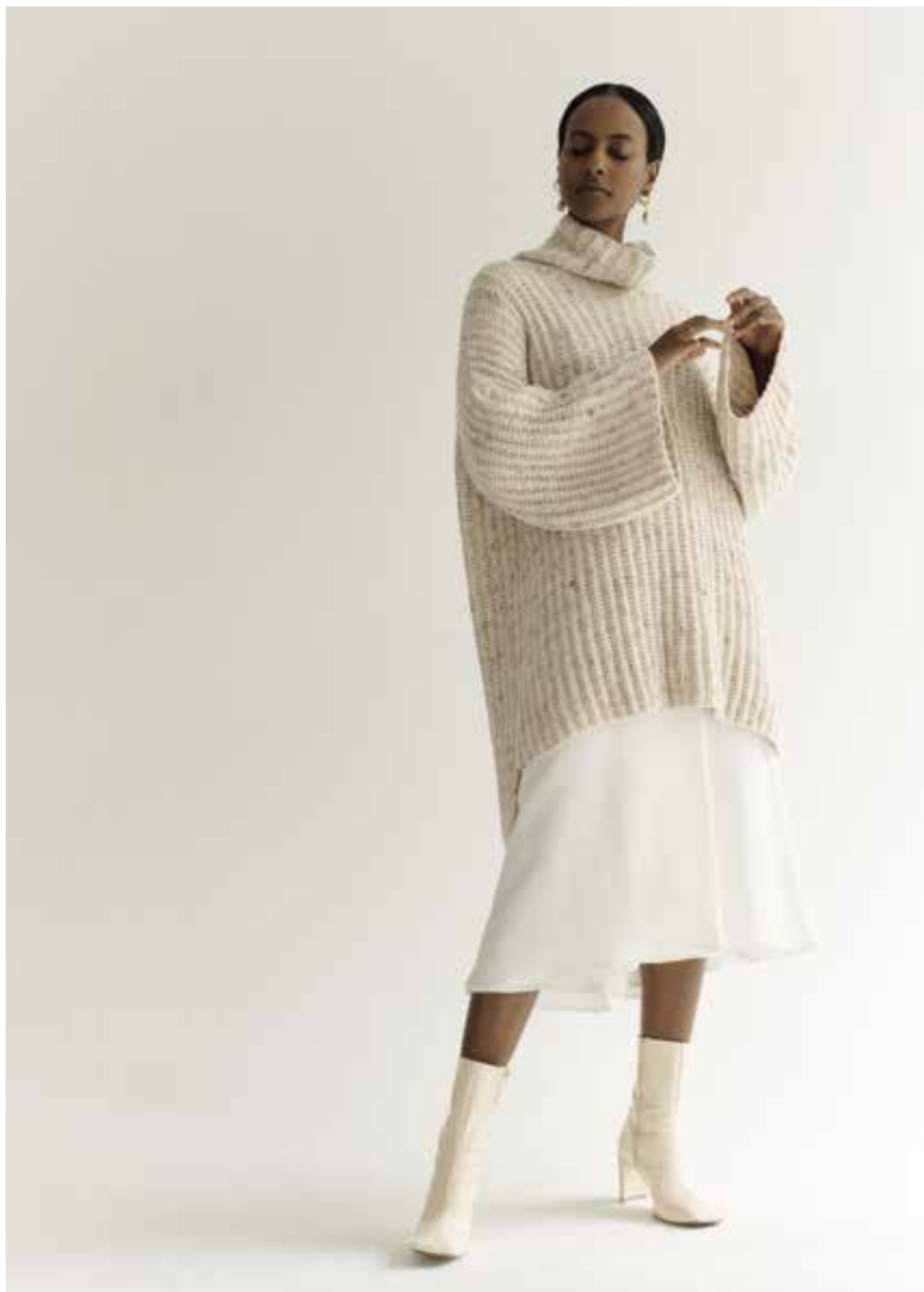
Left & Right 05 Pullover/Jumper BENESSERE TWEED