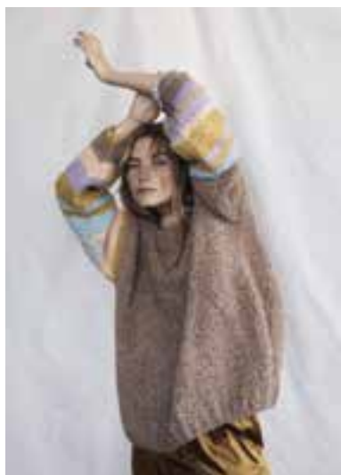
25 S. 43 LALA BERLIN HARMONY