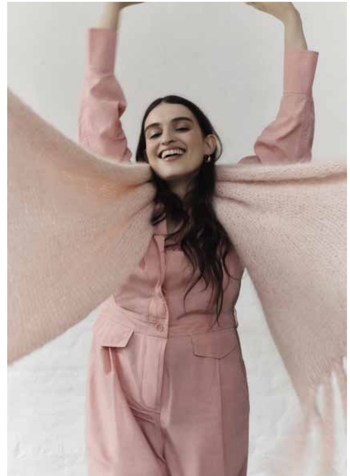
Left 07 Loop Schal / Scarf LALA BERLIN LOVELY COTTON INSERTO