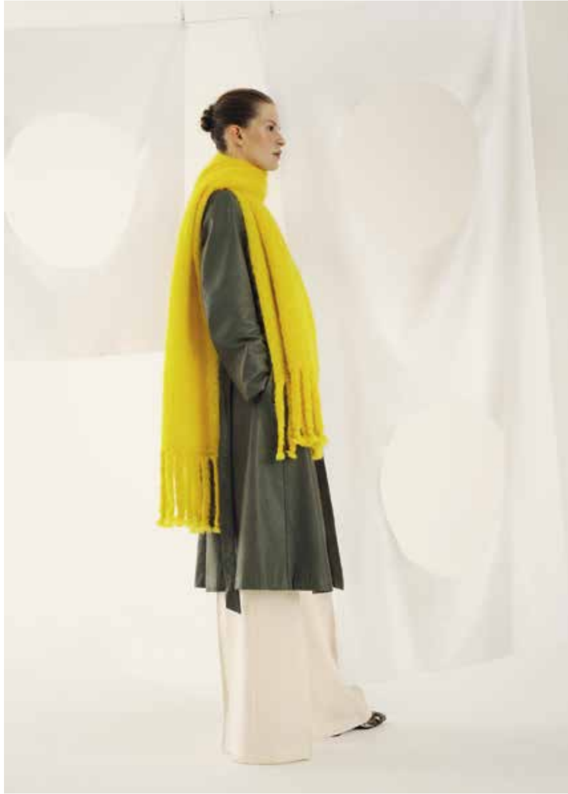
Left & Right 34 Schal / Scarf BRIGITTE NO. 3