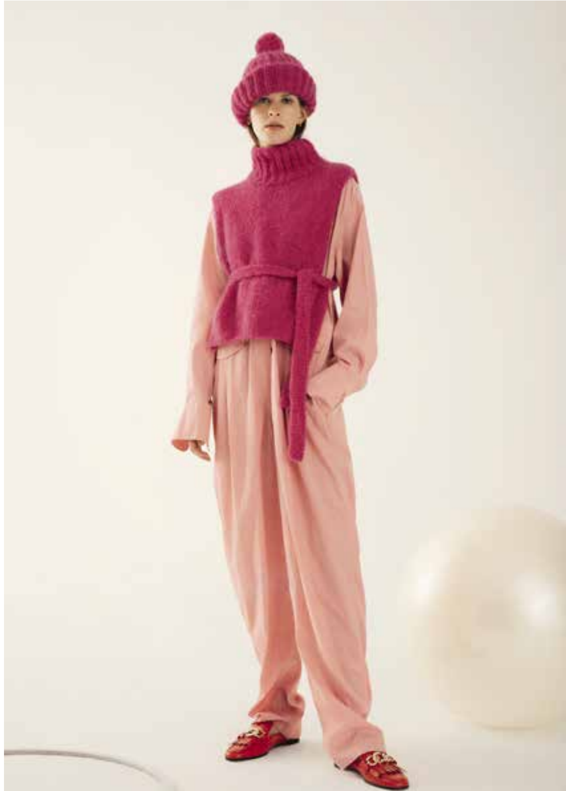
Left & Right 36 Mütze / Cap BRIGITTE NO. 2 & BRIGITTE NO. 3 37 Weste / Vest BRIGITTE NO. 2 & BRIGITTE NO. 3