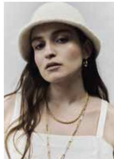
09 FELTRO S. 21