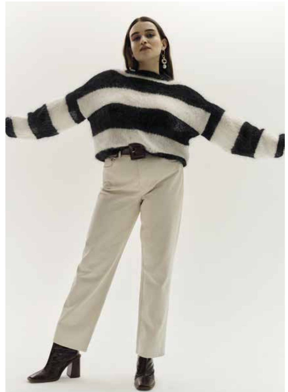
Left & Right 02 Pullover / Jumper BRIGITTE NO. 3 & DIAMANTE