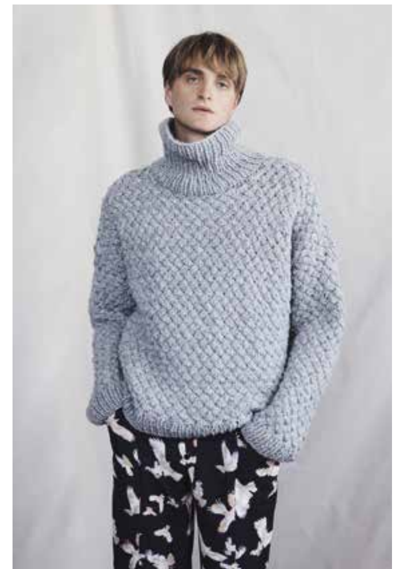
Right 29 Pullover / Jumper LALA BERLIN LOVELY COTTON