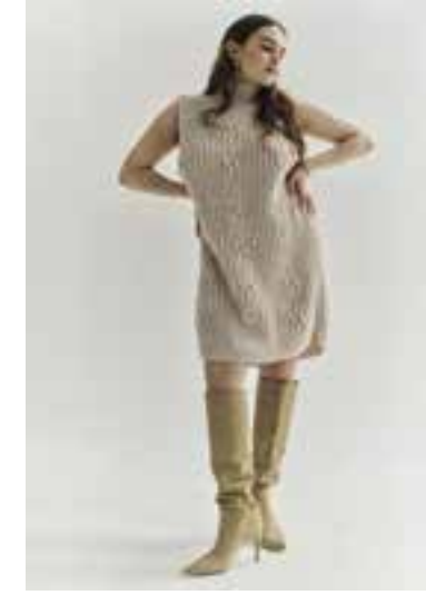
11 BABY LIGHT S. 24