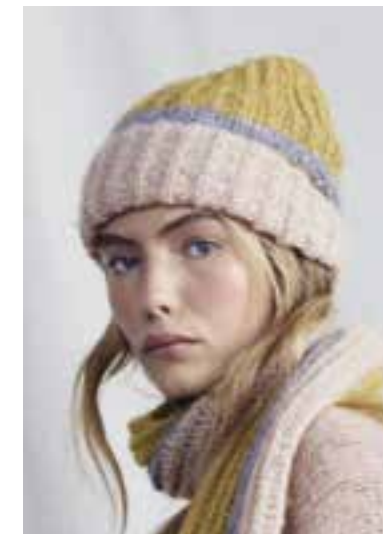
17 LALA BERLIN TWEEDY S. 35