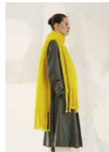
34 S. 58 BRIGITTE NO. 3