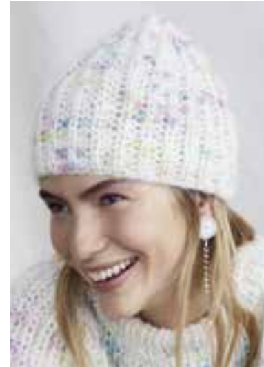
31 S. 49 LALA BERLIN LOVELY COTTON INSERTO