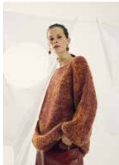
40 S. 66 LALA BERLIN HARMONY & BRIGITTE NO. 3