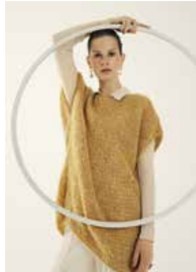
33 S. 55 BRIGITTE NO. 3