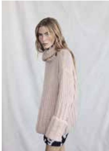
22 S. 41 LALA BERLIN TWEEDY