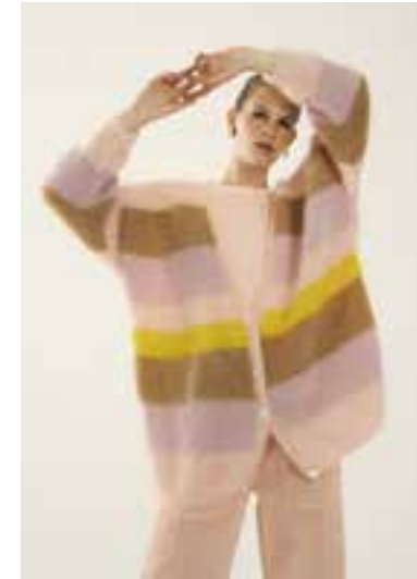
32 S. 53 BRIGITTE NO. 3