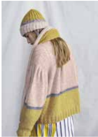
19 S. 34 LALA BERLIN TWEEDY