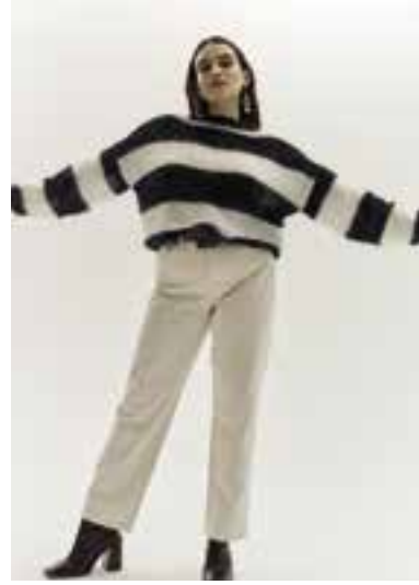
02 BRIGITTE NO. 3 & DIAMANTE S. 9