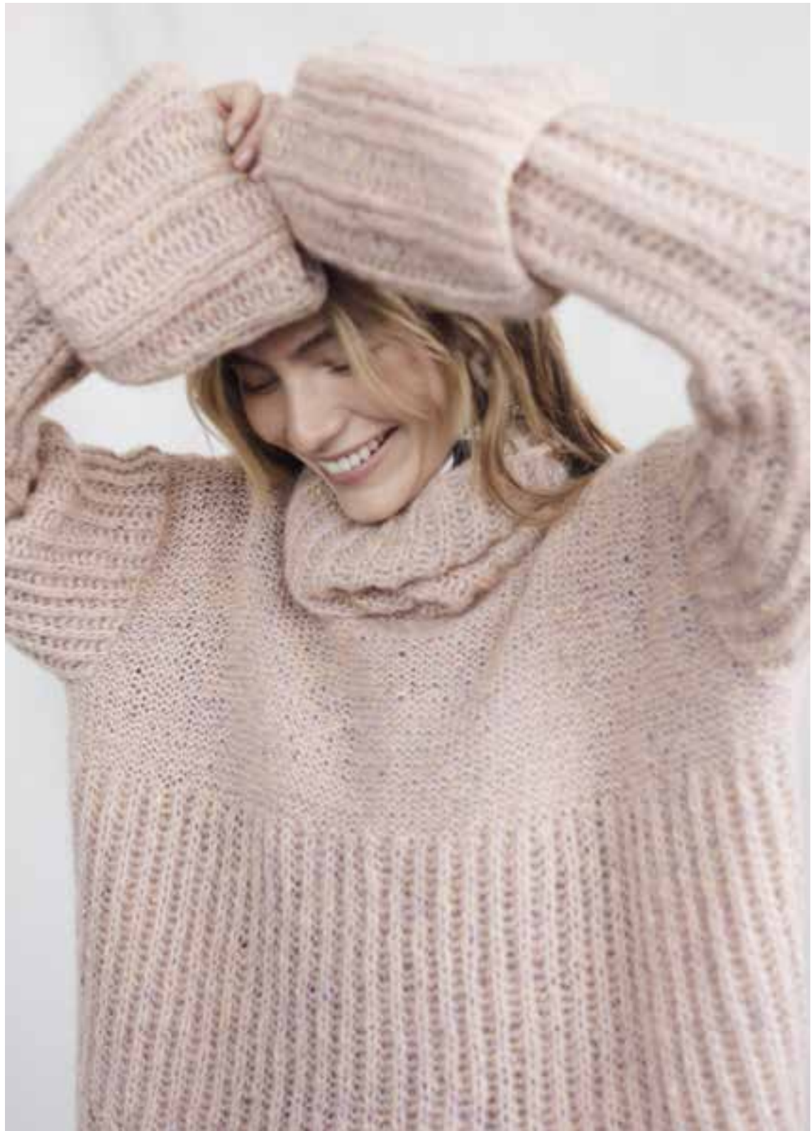
Left & Right 22 Pullover / Jumper LALA BERLIN TWEEDY