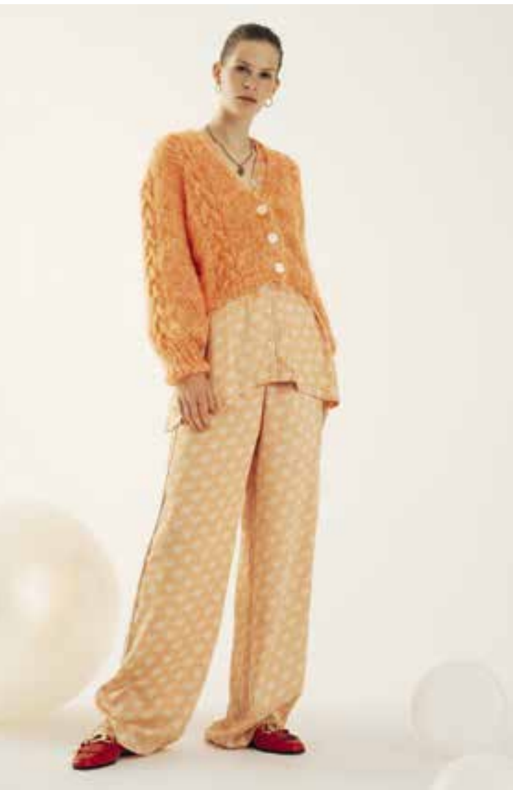
Left & Right 42 Jacke / Cardigan BRIGITTE NO. 3