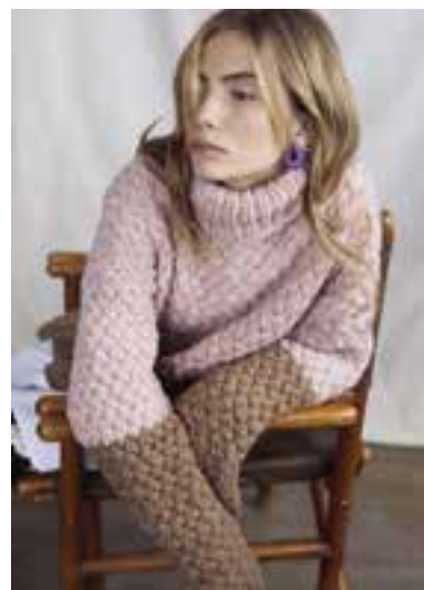
26 S. 44 LALA BERLIN LOVELY COTTON