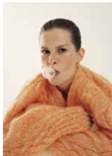
42 S. 71 BRIGITTE NO. 3