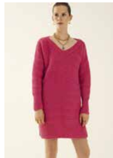
12 S. 56 BRIGITTE NO. 2