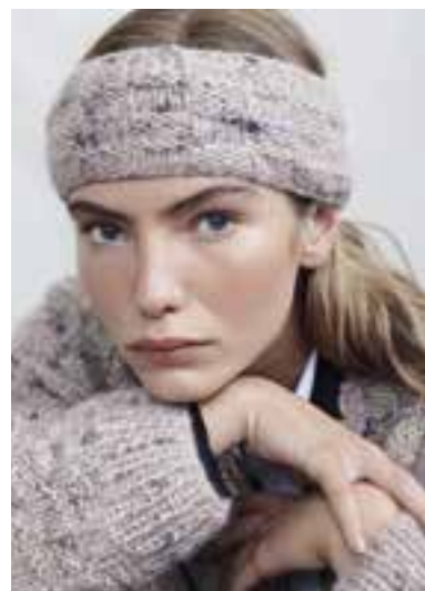
27 S. 46 LALA BERLIN LOVELY COTTON INSERTO