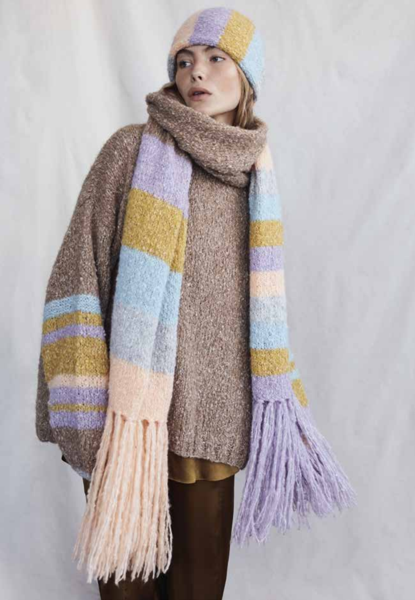
Left & Right 23 Mütze / Cap LALA BERLIN HARMONY 24 Schal / Scarf LALA BERLIN HARMONY 25 Pullover / Jumper LALA BERLIN HARMONY