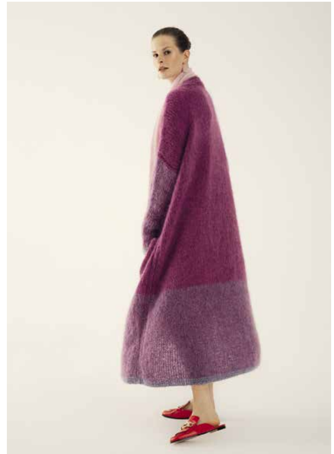
Left & Right 38 Schal / Scarf BRIGITTE NO. 3 41 Mantel / Coat BRIGITTE NO. 3