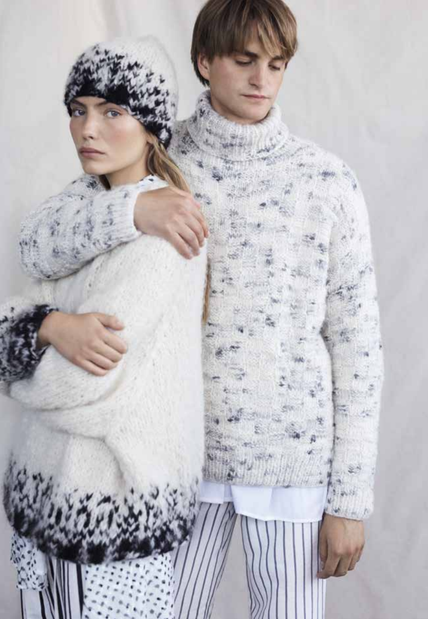
Right 15 Pullover / Jumper LALA BERLIN FURRY BICOLOR & LALA BERLIN FURRY