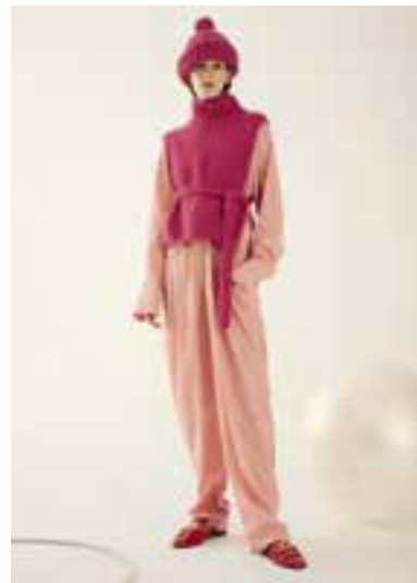
37 S. 62 BRIGITTE NO. 2 & BRIGITTE NO. 3