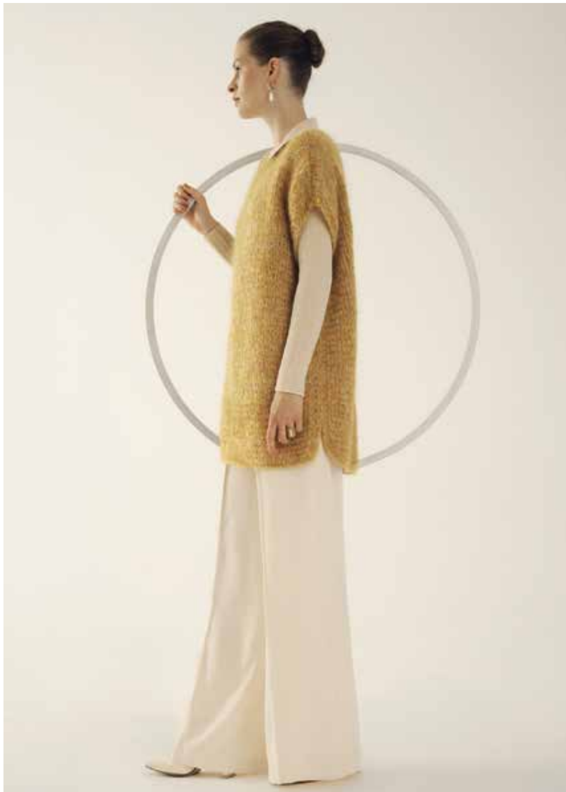
Left & Right 33 Top BRIGITTE NO. 3