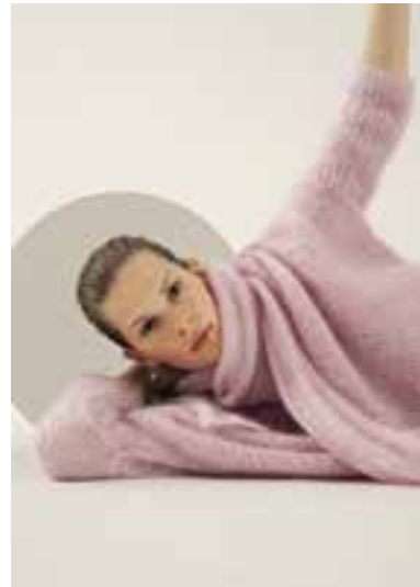
38 S. 64 BRIGITTE NO. 3