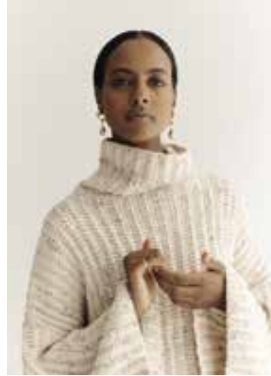
05 BENESSERE TWEED S. 15