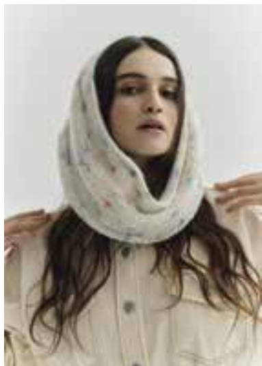
07 LALA BERLIN LOVELY COTTON INSERTO S. 18