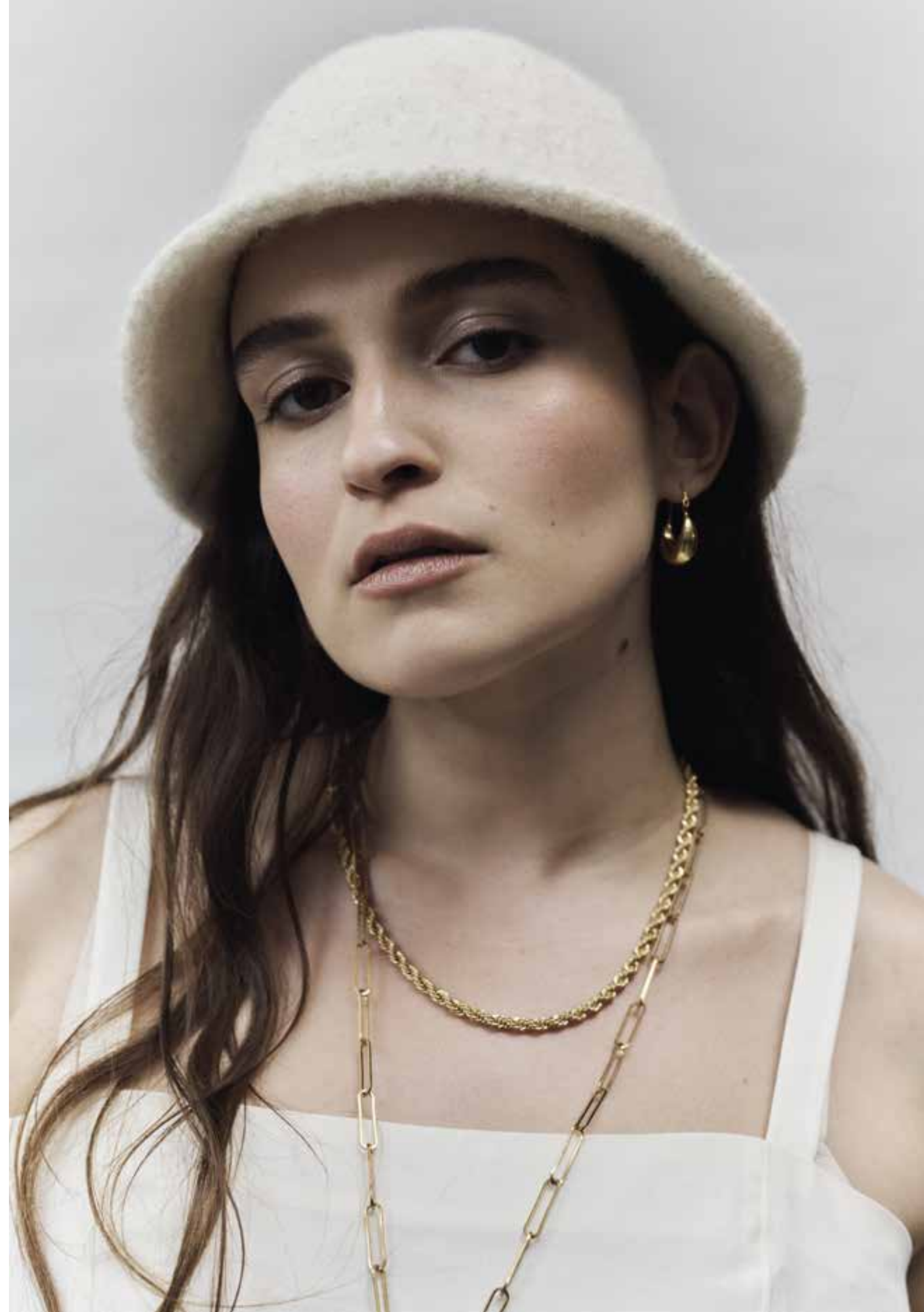
Right 09 Hut / Hat FELTRO