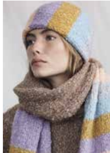
23 S. 42 LALA BERLIN HARMONY