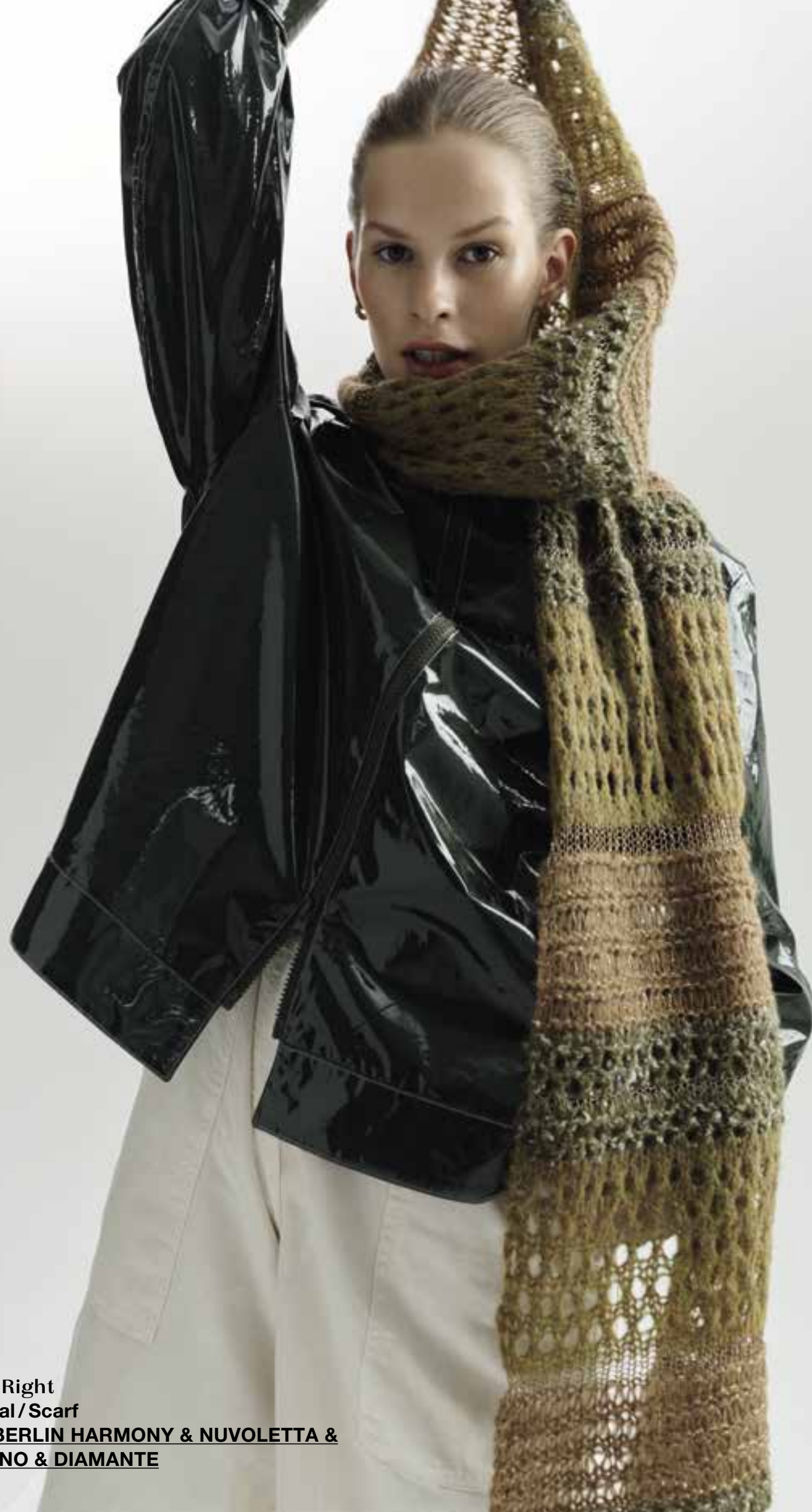
Left & Right 43 Schal / Scarf LALA BERLIN HARMONY & NUVOLETTA & BRILLINO & DIAMANTE