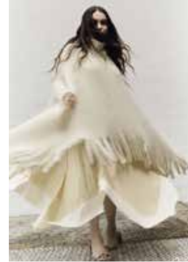
13 BRIGITTE NO. 2 & BRIGITTE NO. 3 S. 29