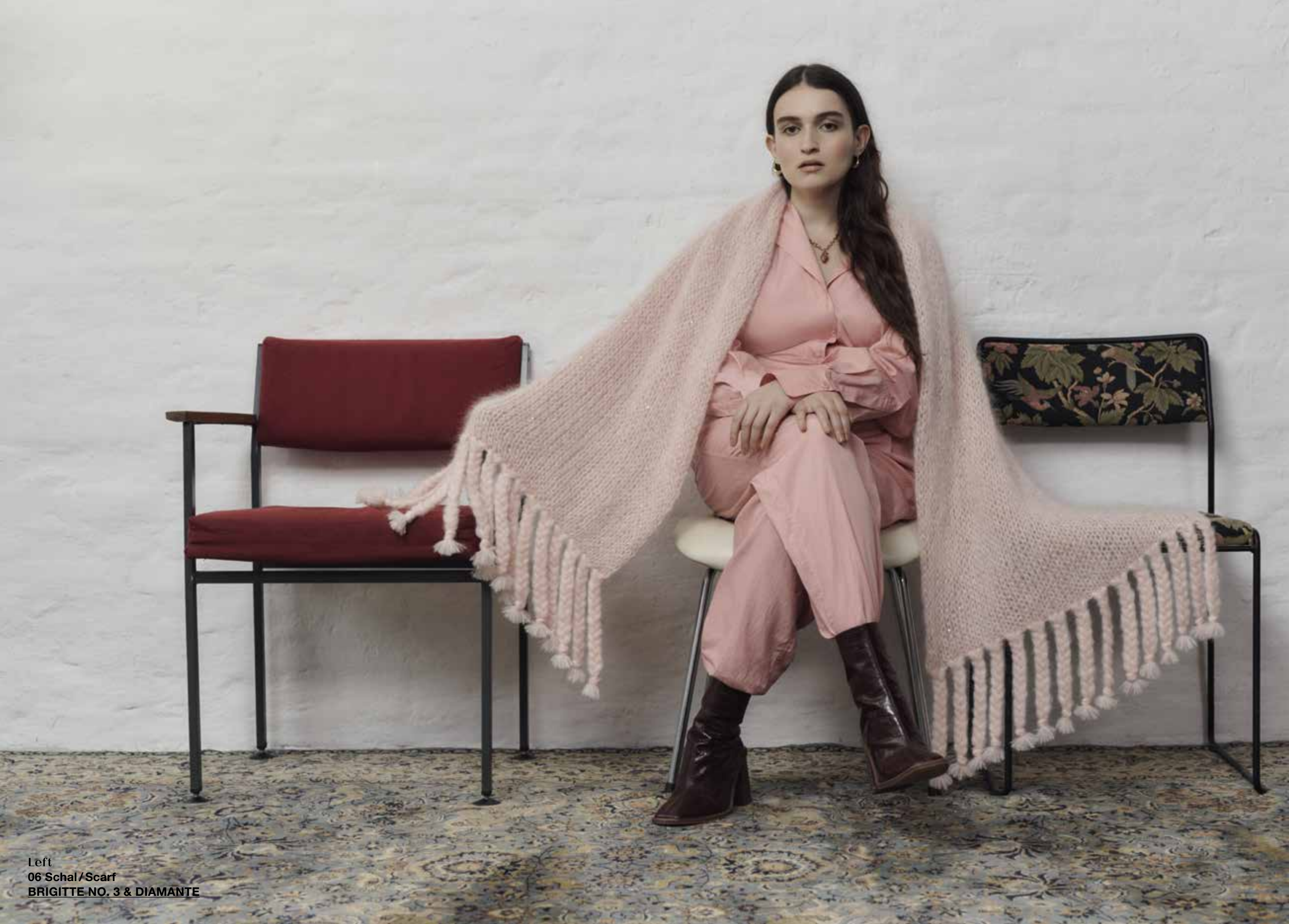
Left 06 Schal / Scarf BRIGITTE NO. 3 & DIAMANTE