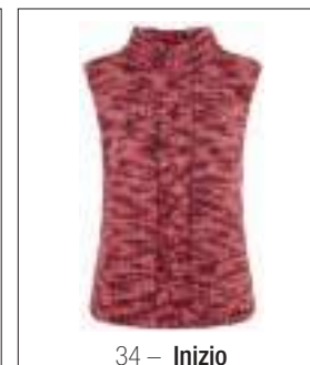
34 – Inizio