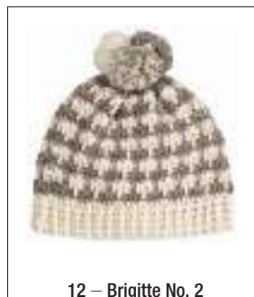
12 – Brigitte No. 2