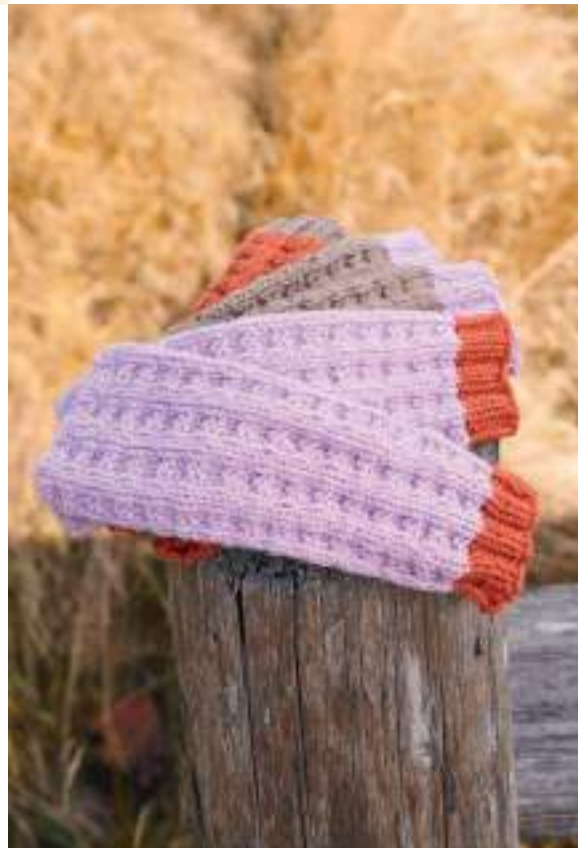
26 + 27 + 28 – Mütze, Loop und Stulpen Landlust Alpaka Merino 100