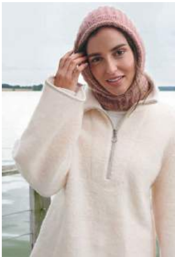
2 – Kapuzenloop Alpaca Moda rechte Seite: 3 + 4 – Mütze und Schal Puno Due