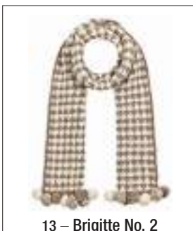
13 – Brigitte No. 2