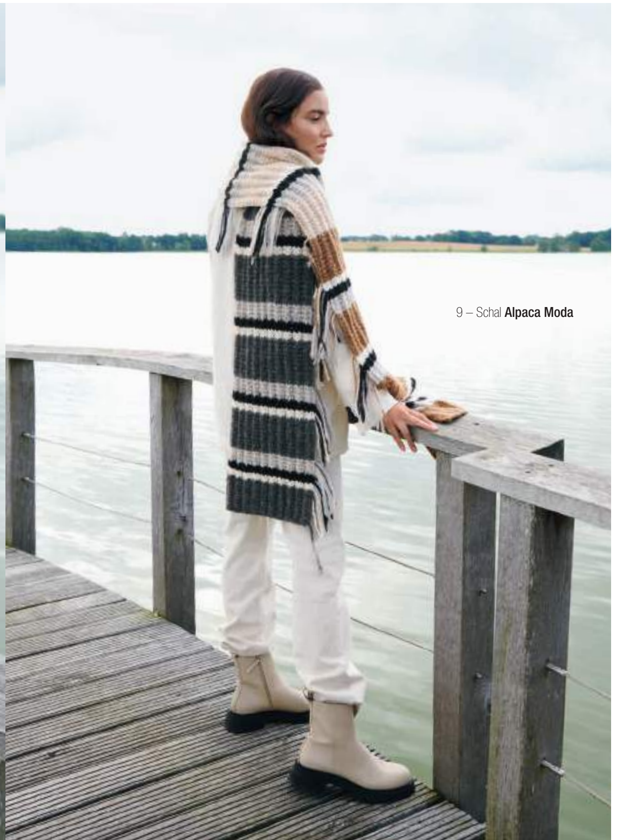
9 – Schal Alpaca Moda