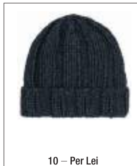
10 – Per Lei