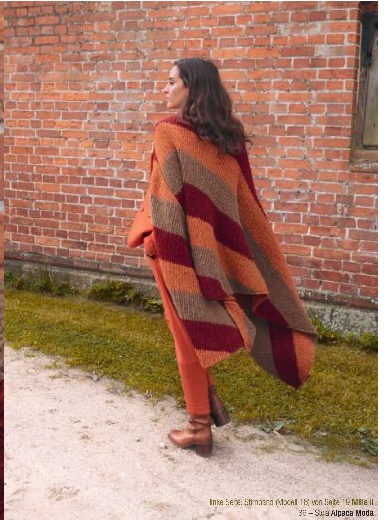
linke Seite: Stirnband (Modell 18) von Seite 19 Mille II 36 – Stola Alpaca Moda