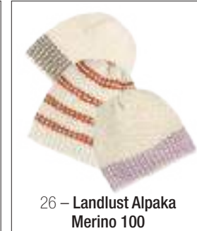
26 – Landlust Alpaka Merino 100