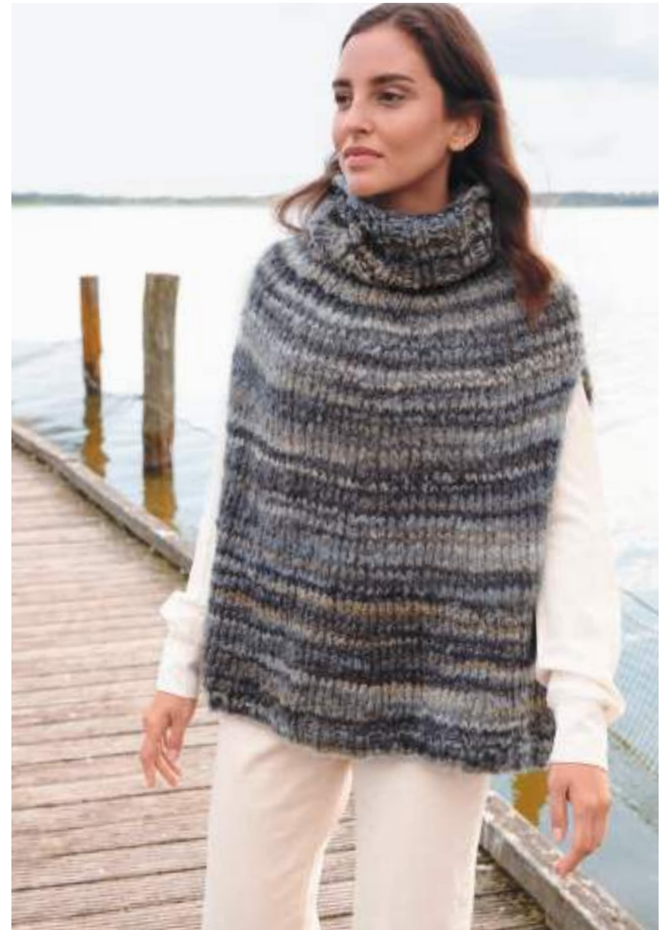
links: 12 + 13 – Mütze und Schal Brigitte No. 2 14 – Poncho Twin 50 g