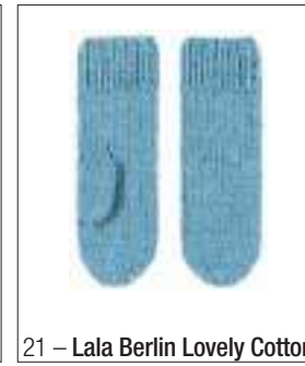
21 – Lala Berlin Lovely Cotton