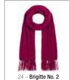
24 – Brigitte No. 2