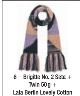
6 – Brigitte No. 2 Seta + Twin 50 g + Lala Berlin Lovely Cotton