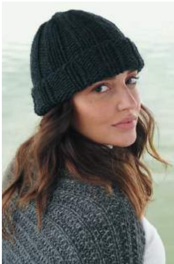
10 – Mütze Per Lei rechts: 11 – Shrug Puno Due