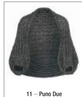
11 – Puno Due