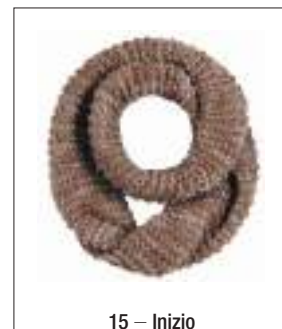
15 – Inizio