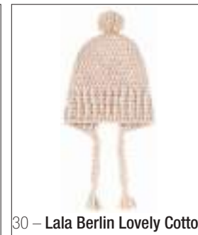
30 – Lala Berlin Lovely Cotton