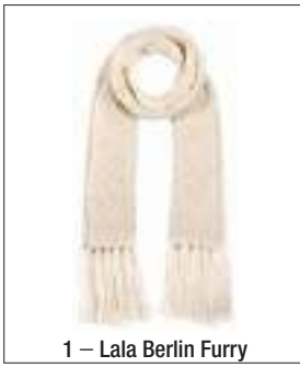
1 – Lala Berlin Furry