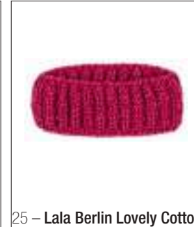
25 – Lala Berlin Lovely Cotton