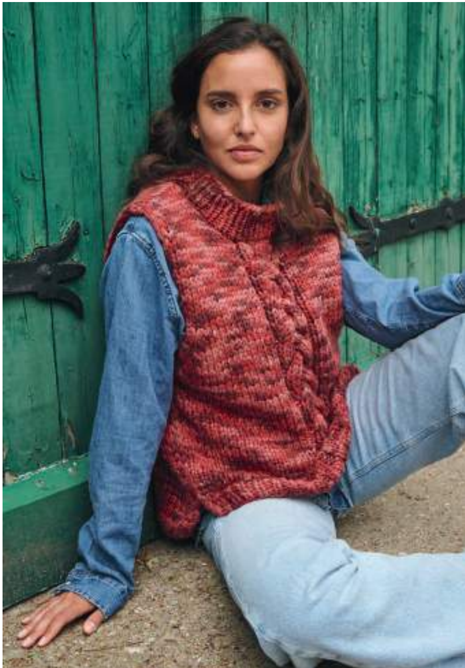
34 – Pullunder Inizio 35 – Mütze Inizio