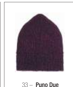
33 – Puno Due