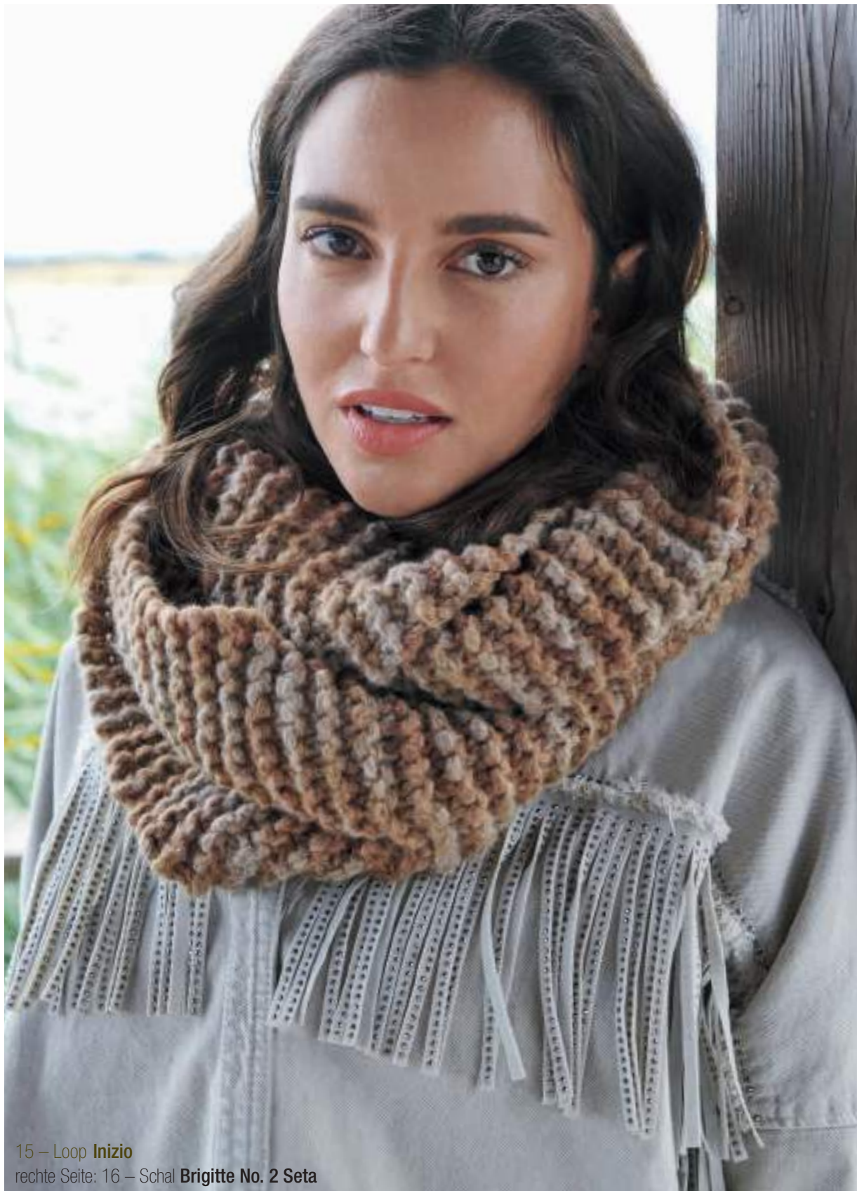
15 – Loop Inizio rechte Seite: 16 – Schal Brigitte No. 2 Seta