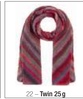
22 – Twin 25 g