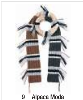
9 – Alpaca Moda