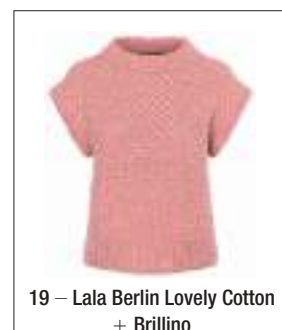
19 – Lala Berlin Lovely Cotton + Brillino