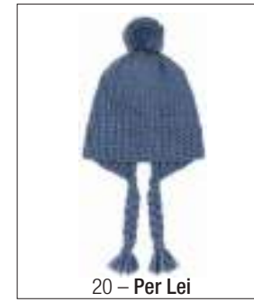
20 – Per Lei