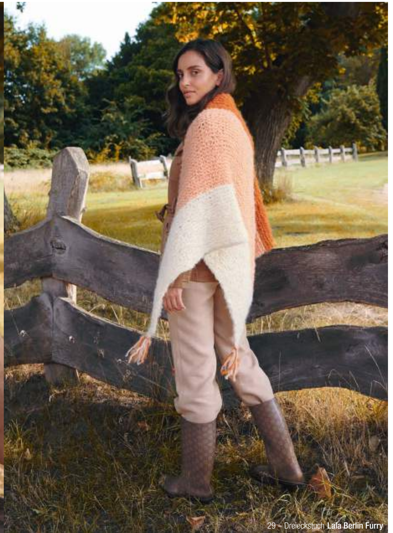
29 – Dreieckstuch Lala Berlin Furry