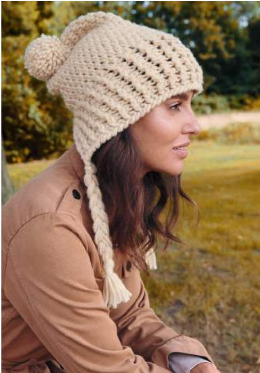
30 – Mütze Lala Berlin Lovely Cotton rechte Seite: 31 – Schal Lala Berlin Furry + Sara + Alta Moda Alpaca