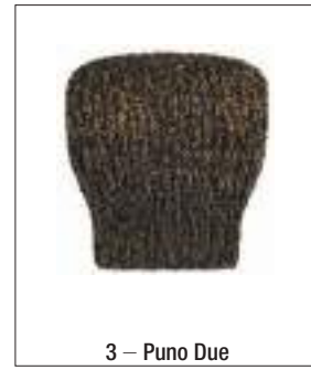
3 – Puno Due