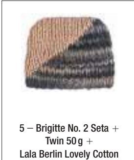
5 – Brigitte No. 2 Seta + Twin 50 g + Lala Berlin Lovely Cotton