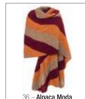
36 – Alpaca Moda