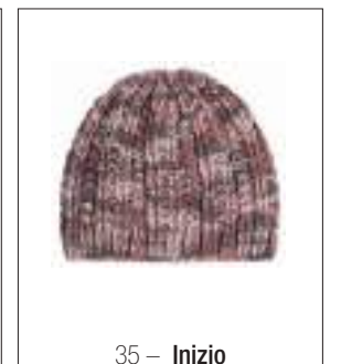
35 – Inizio