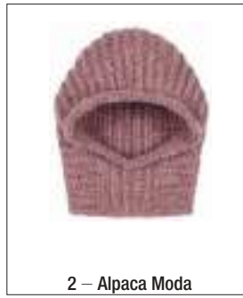
2 – Alpaca Moda