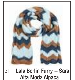
31 – Lala Berlin Furry + Sara + Alta Moda Alpaca