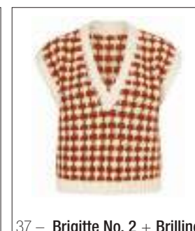
37 – Brigitte No. 2 + Brillino