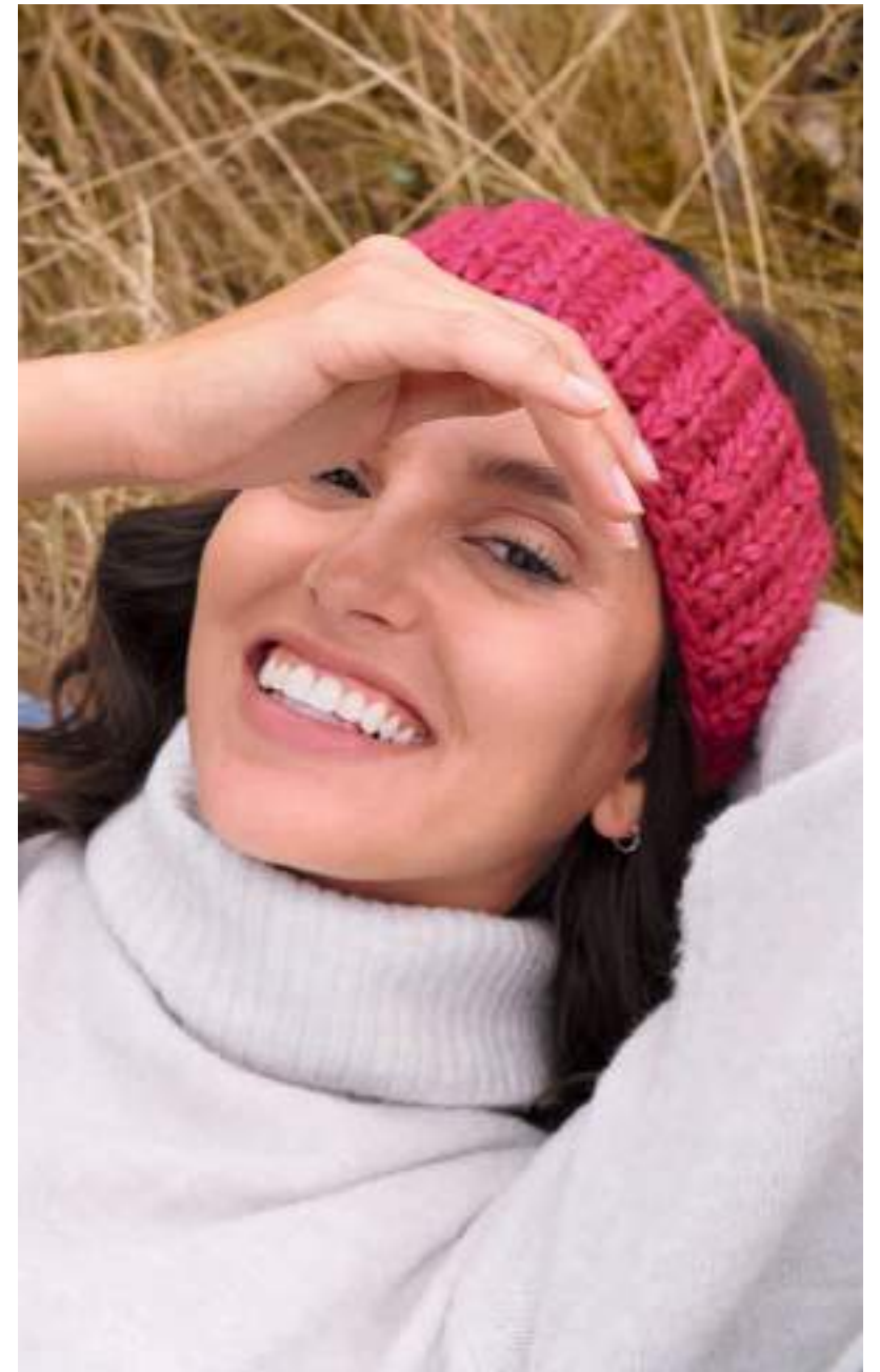
linke Seite: 23 + 24 – Mütze + Schal Brigitte No. 2 25 – Stirnband Lala Berlin Lovely Cotton