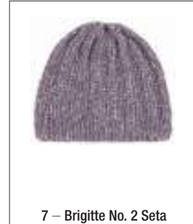
7 – Brigitte No. 2 Seta