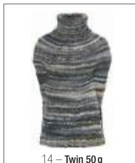
14 – Twin 50 g