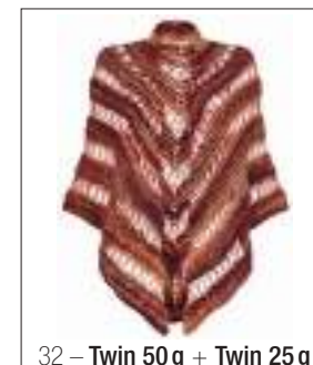
32 – Twin 50 g + Twin 25 g