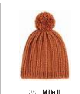
38 – Mille II