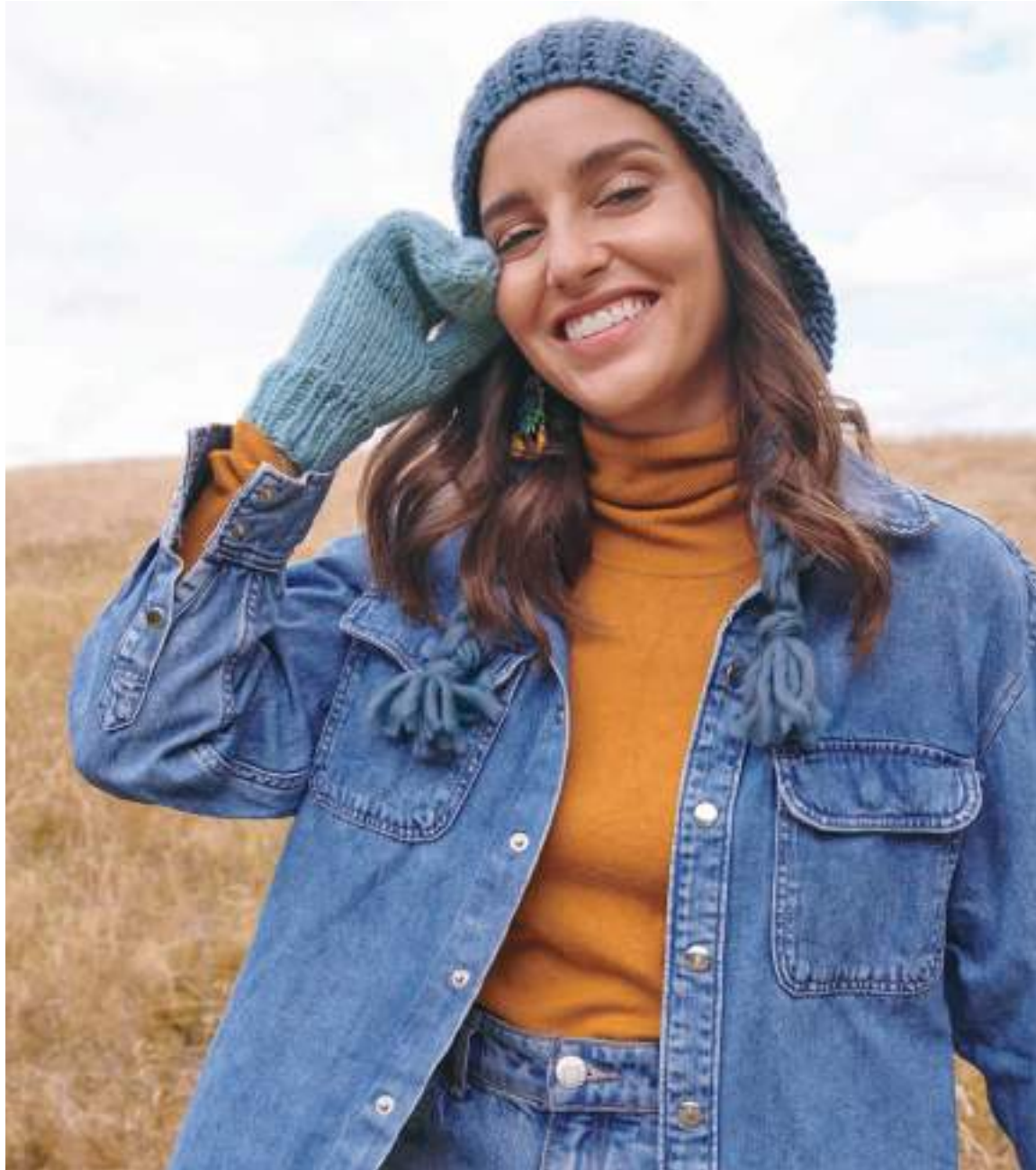
20 – Mütze mit Zöpfen Per Lei | 21 – Fäustlinge Lala Berlin Lovely Cotton rechte Seite: 22 – Schal Twin 25 g