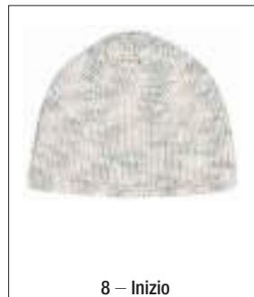
8 – Inizio