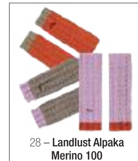
28 – Landlust Alpaka Merino 100