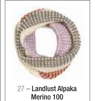
27 – Landlust Alpaka Merino 100