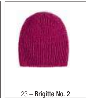
23 – Brigitte No. 2