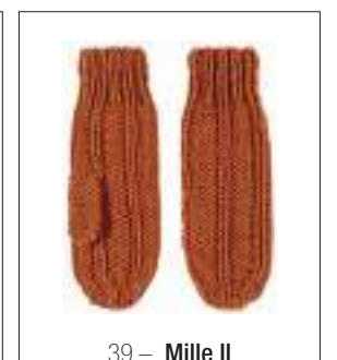
39 – Mille II