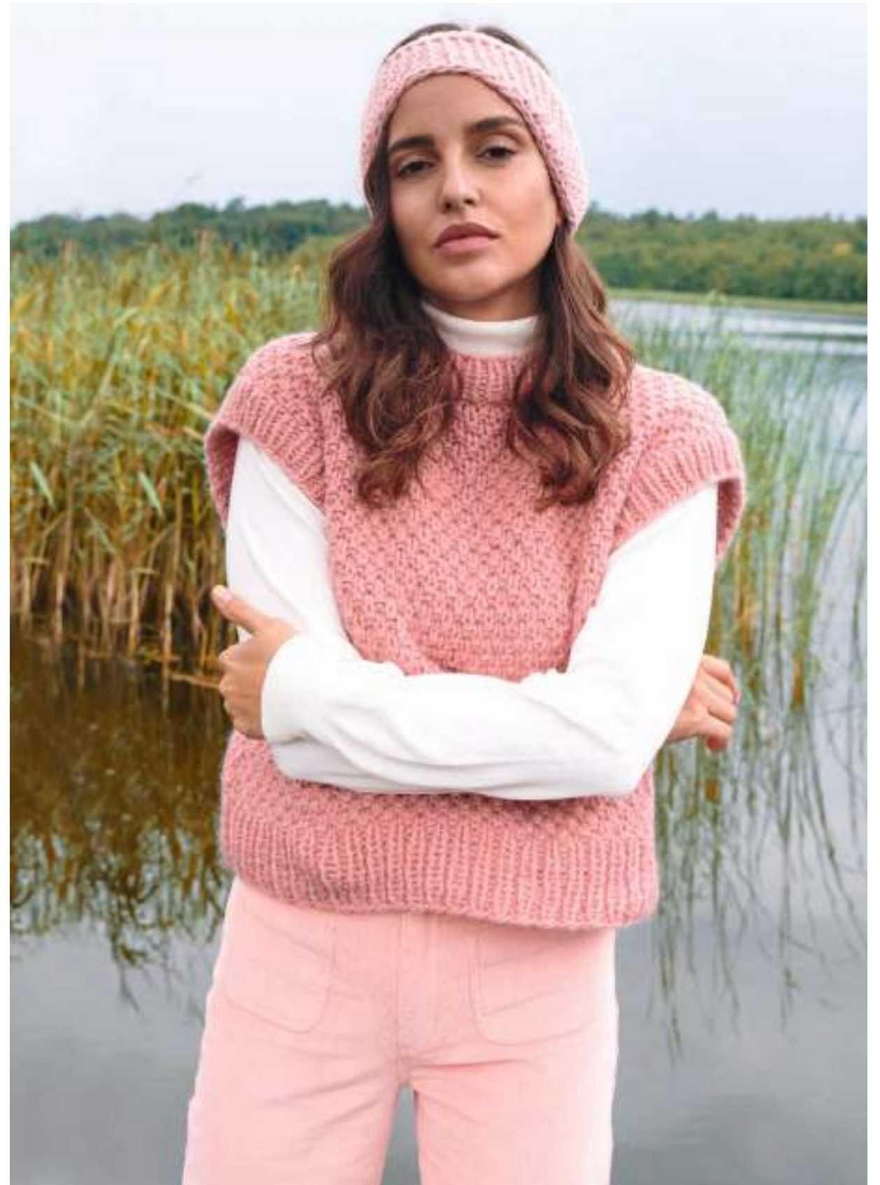
rechte Seite: 18 – Stirnband Mille II | 19 – Pullunder Lala Berlin Lovely Cotton + Brillino