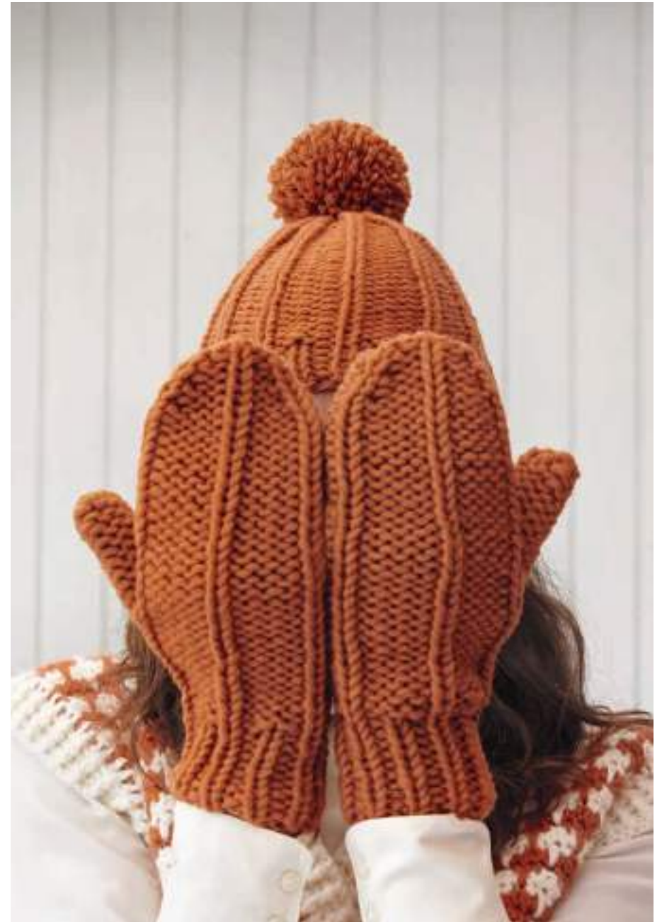
linke Seite: 37 – Pullunder Brigitte No. 2 + Brillino 38 + 39 – Mütze und Handschuhe Mille II