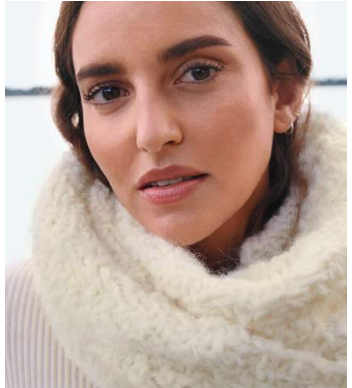
1 – Schal Lala Berlin Furry