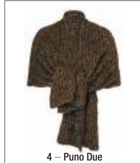
4 – Puno Due