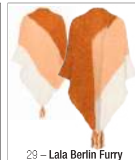
29 – Lala Berlin Furry