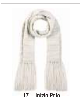
17 – Inizio Pelo