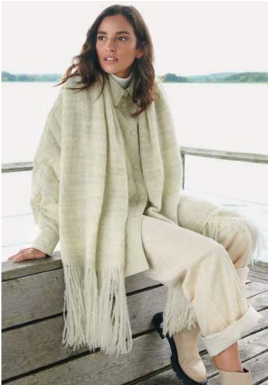
17 – Schal Inizio Pelo