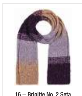
16 – Brigitte No. 2 Seta