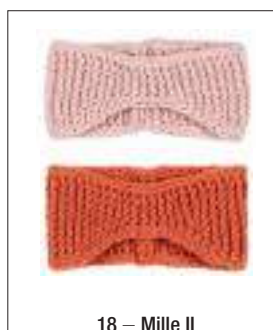
18 – Mille II