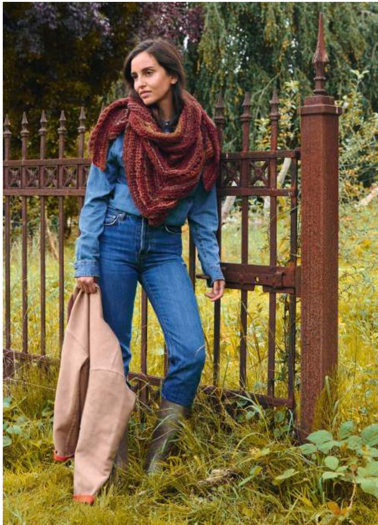
32 – Dreieckstuch Twin 50g + Twin 25g unten rechts: 33 – Mütze Puno Due