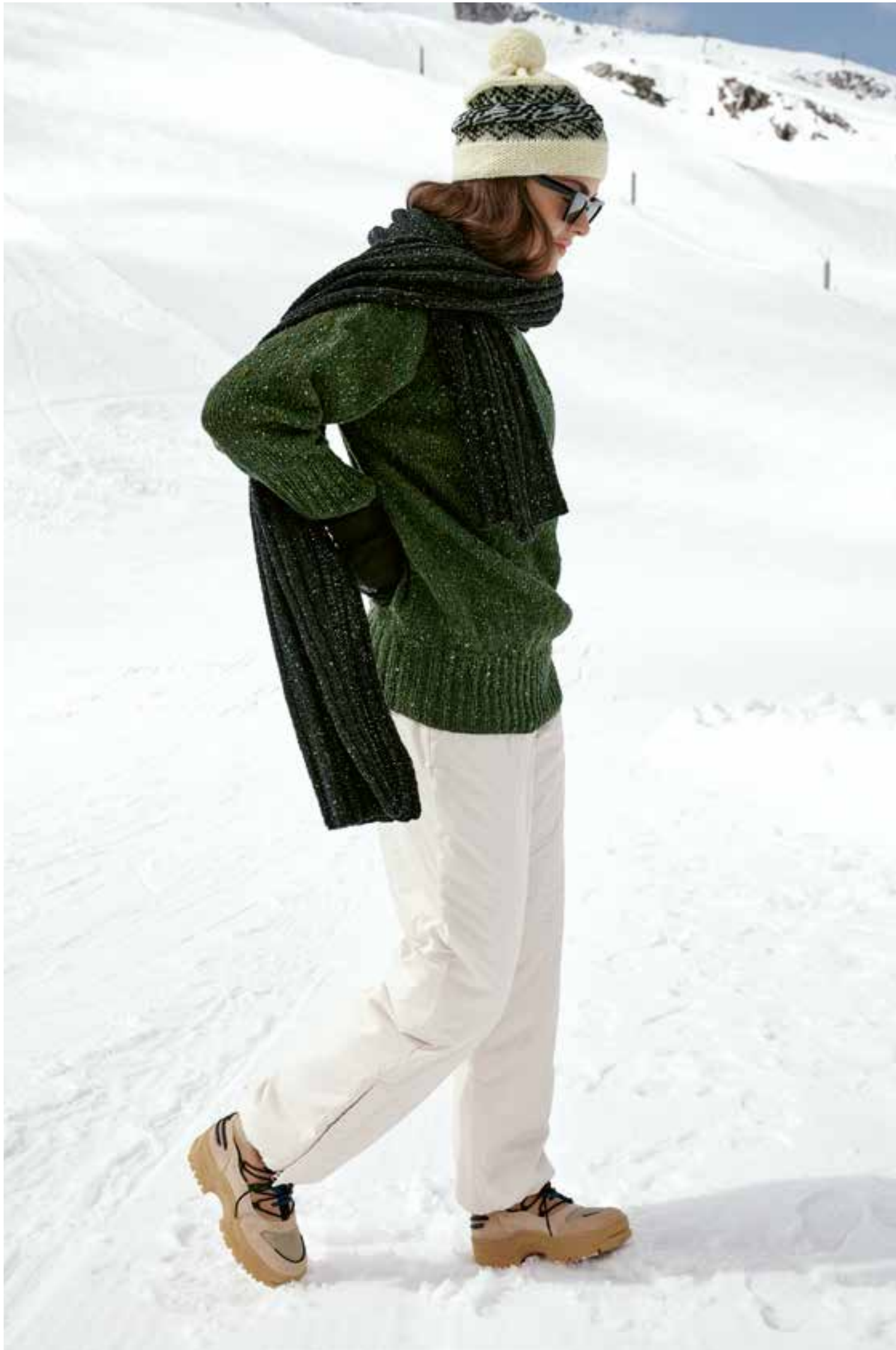
34 // SCHAL_Country Tweed Fine 35 // MÜTZE_Cool Merino 36 // PULLOVER_Country Tweed Fine