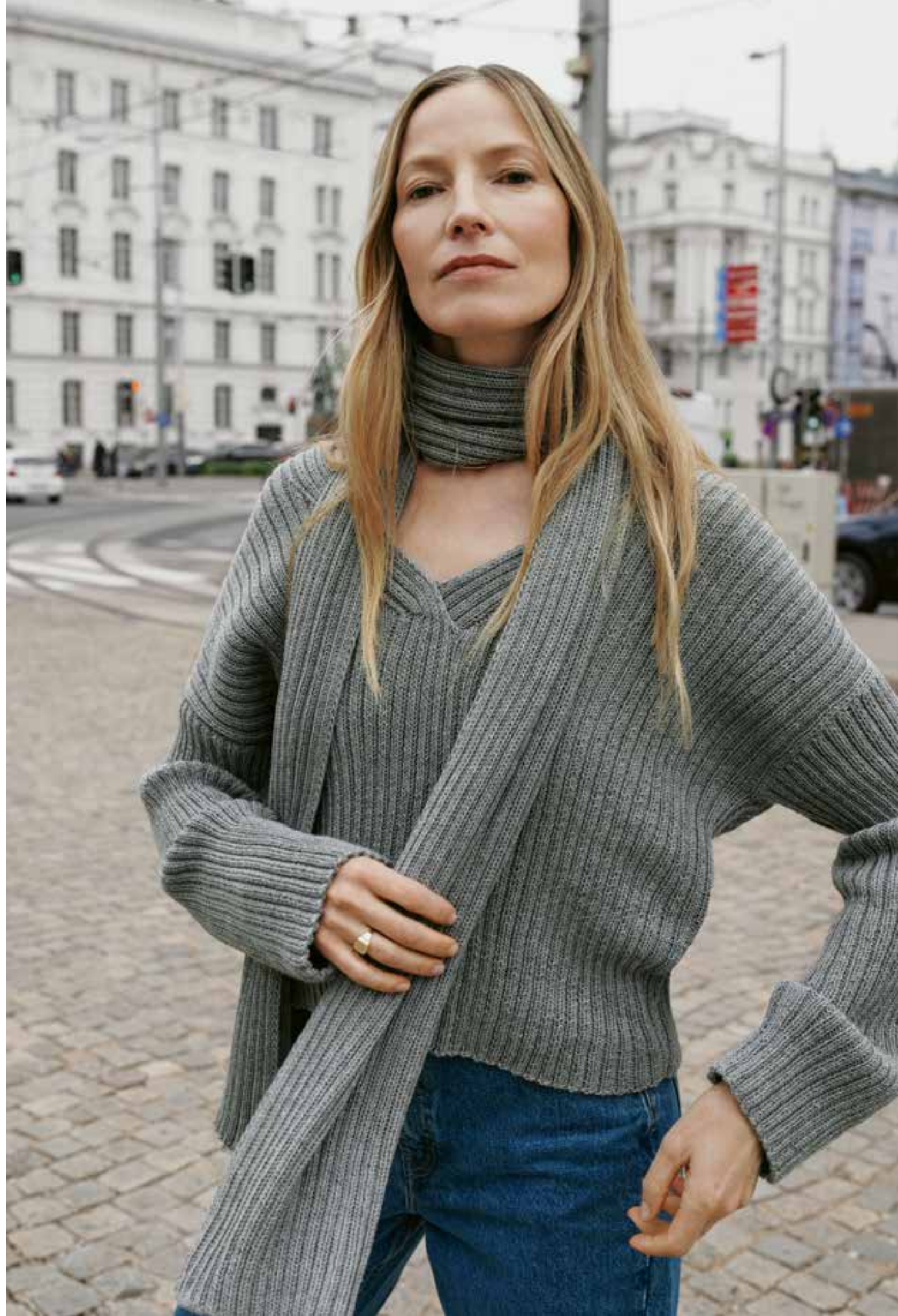
19 // SCHAL_Merino Superiore 20 // PULLOVER_Merino Superiore