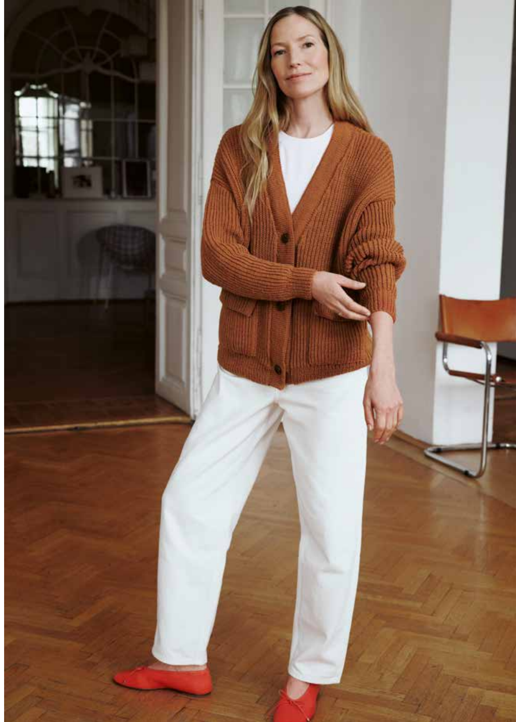
3 // CARDIGAN_Cool Wool