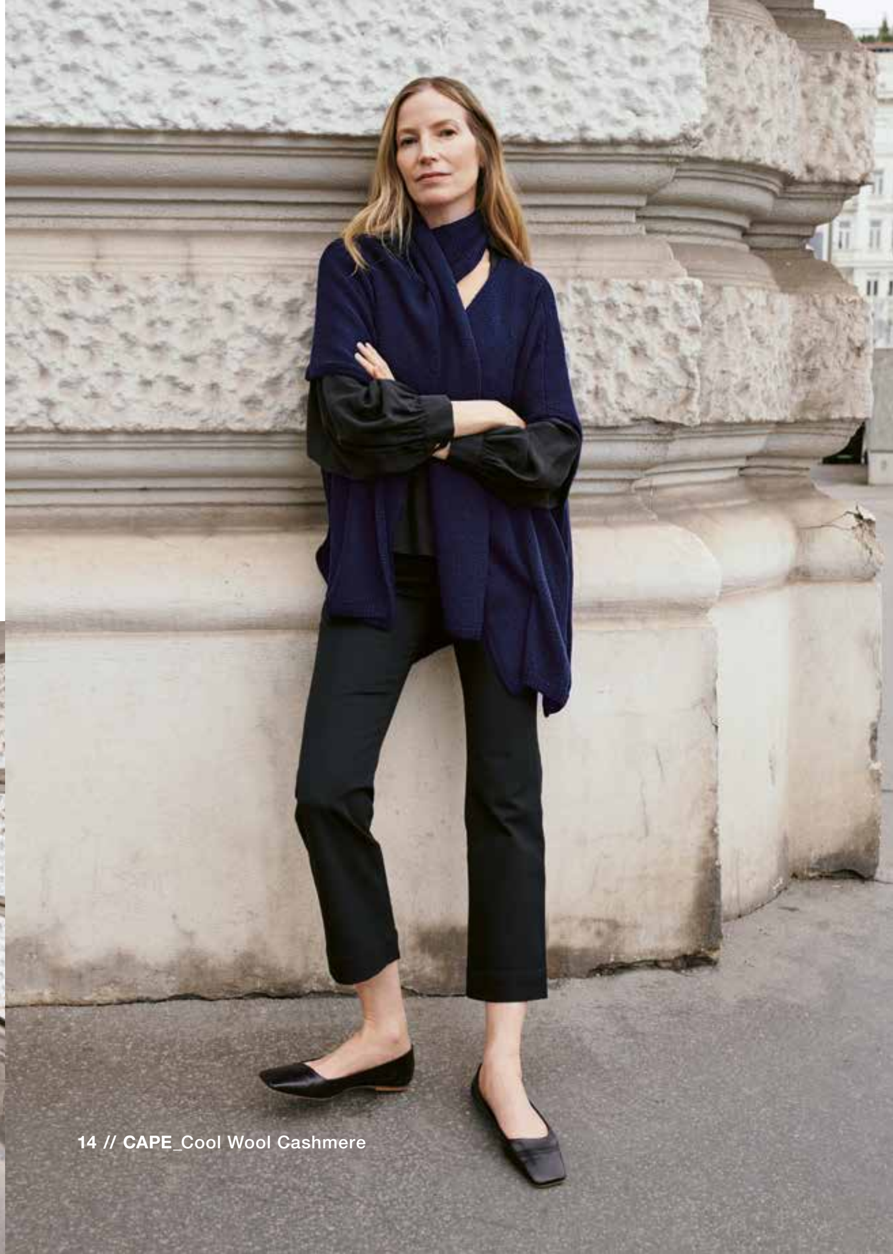
14 // CAPE_Cool Wool Cashmere