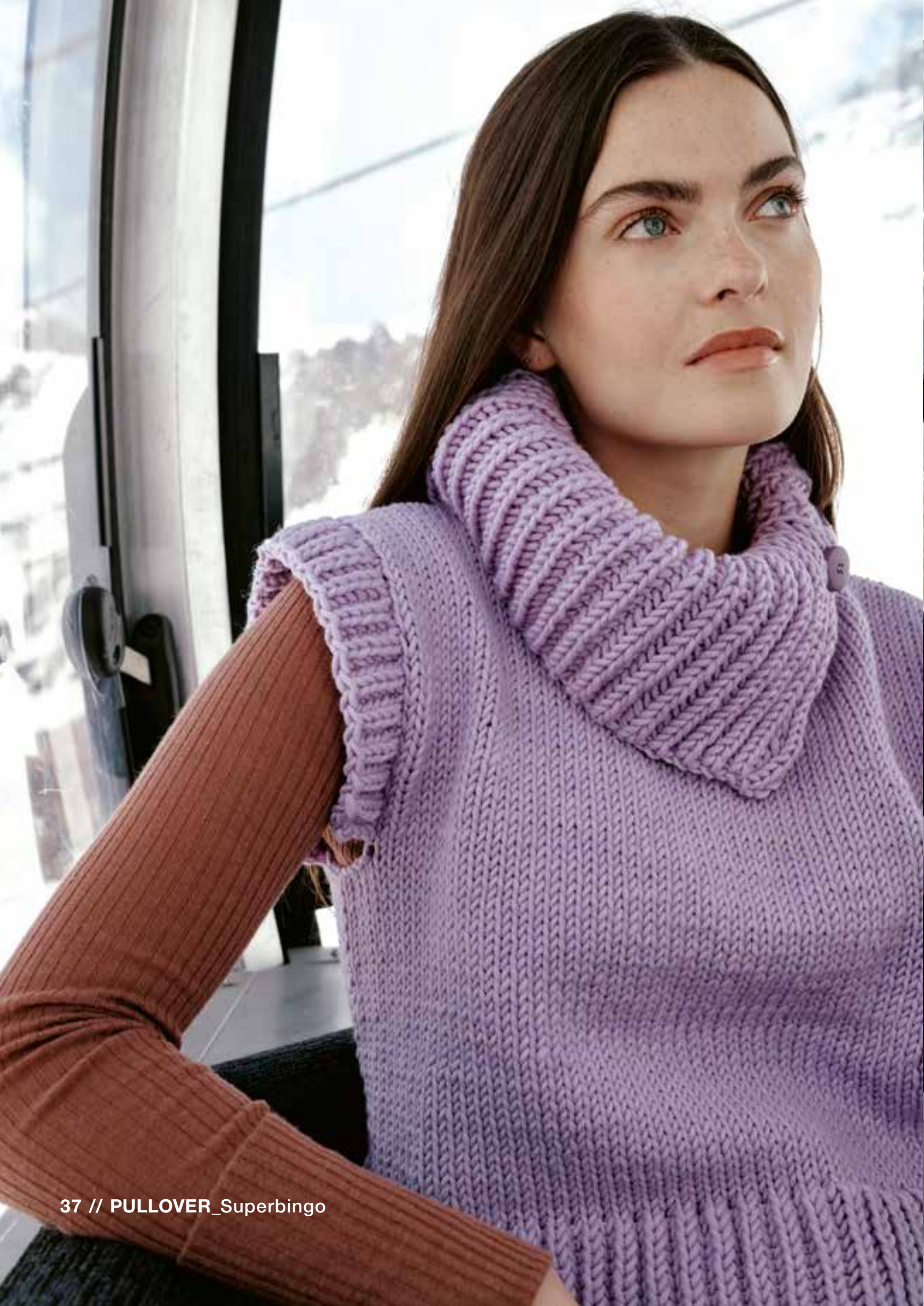
37 // PULLOVER_Superbingo