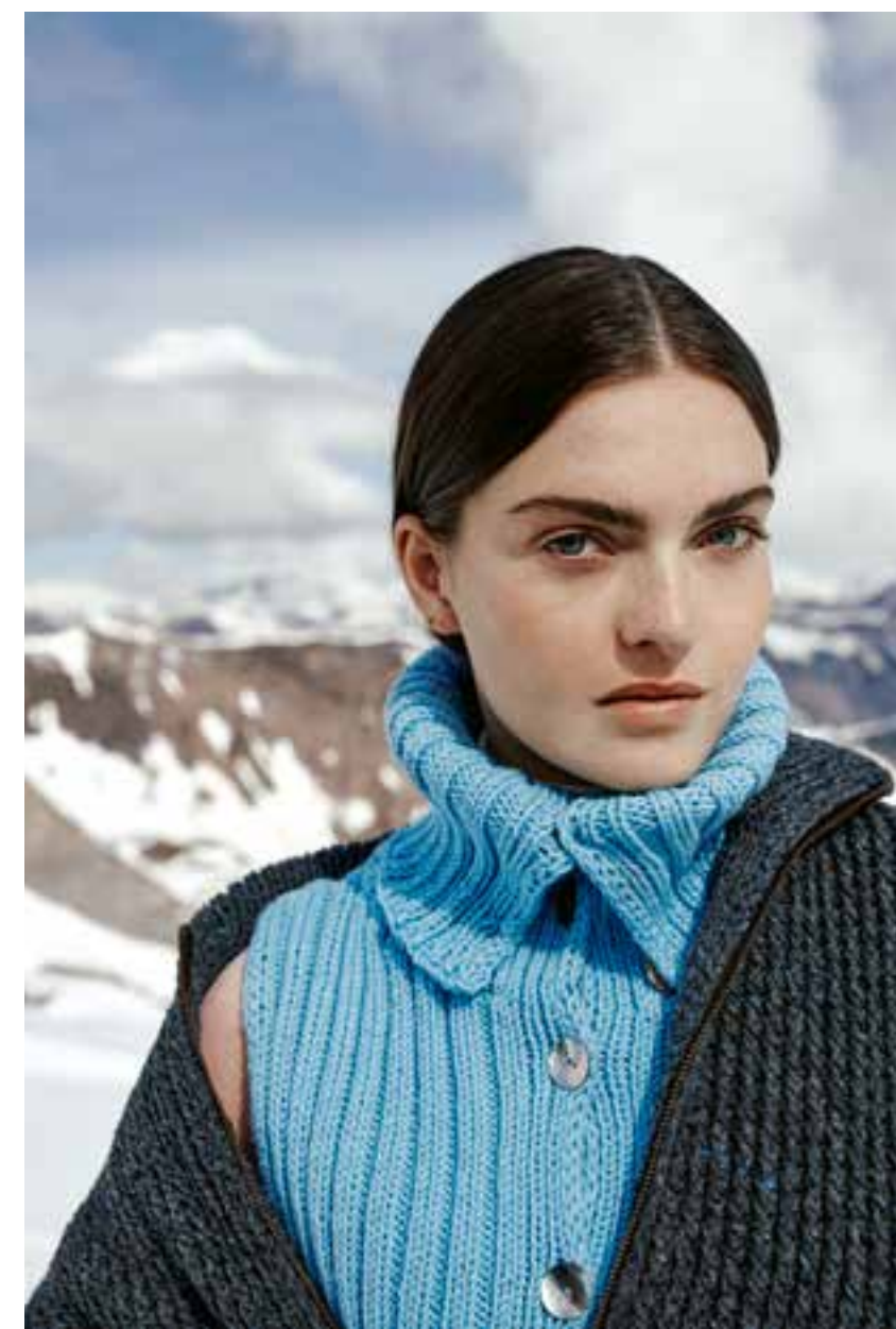
33 // KRAGEN_Bingo