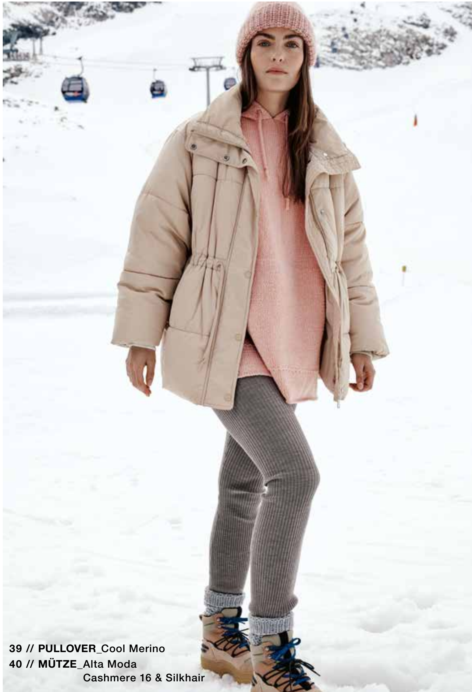
39 // PULLOVER_Cool Merino 40 // MÜTZE_Alta Moda Cashmere 16 & Silkhair