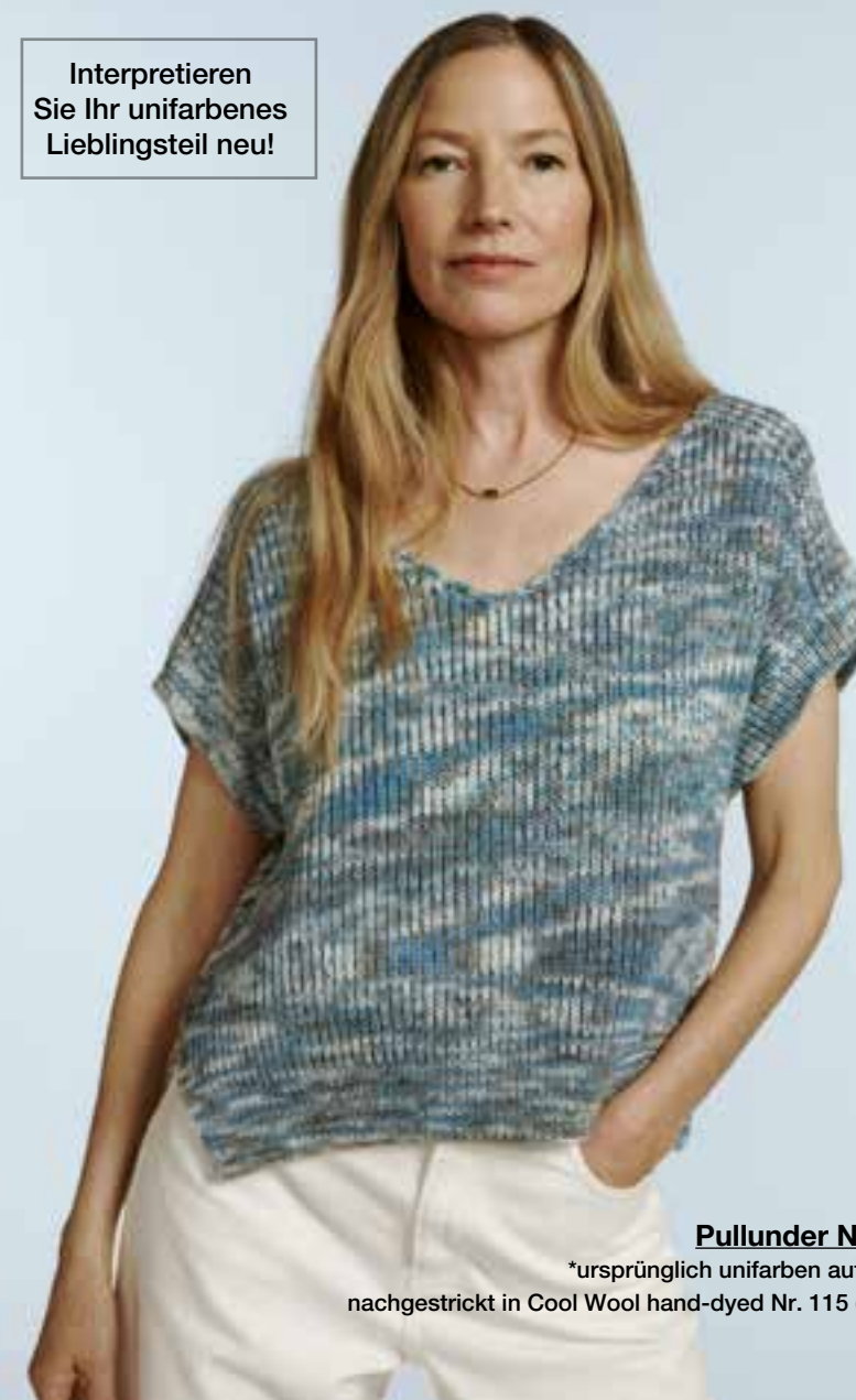
Pullunder Nr. 30

Interpretieren Sie Ihr unifarbenes Lieblingsteil neu!