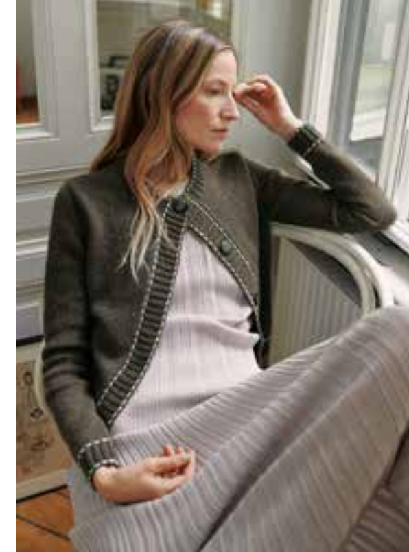
17 // CARDIGAN_Cashmere Verde