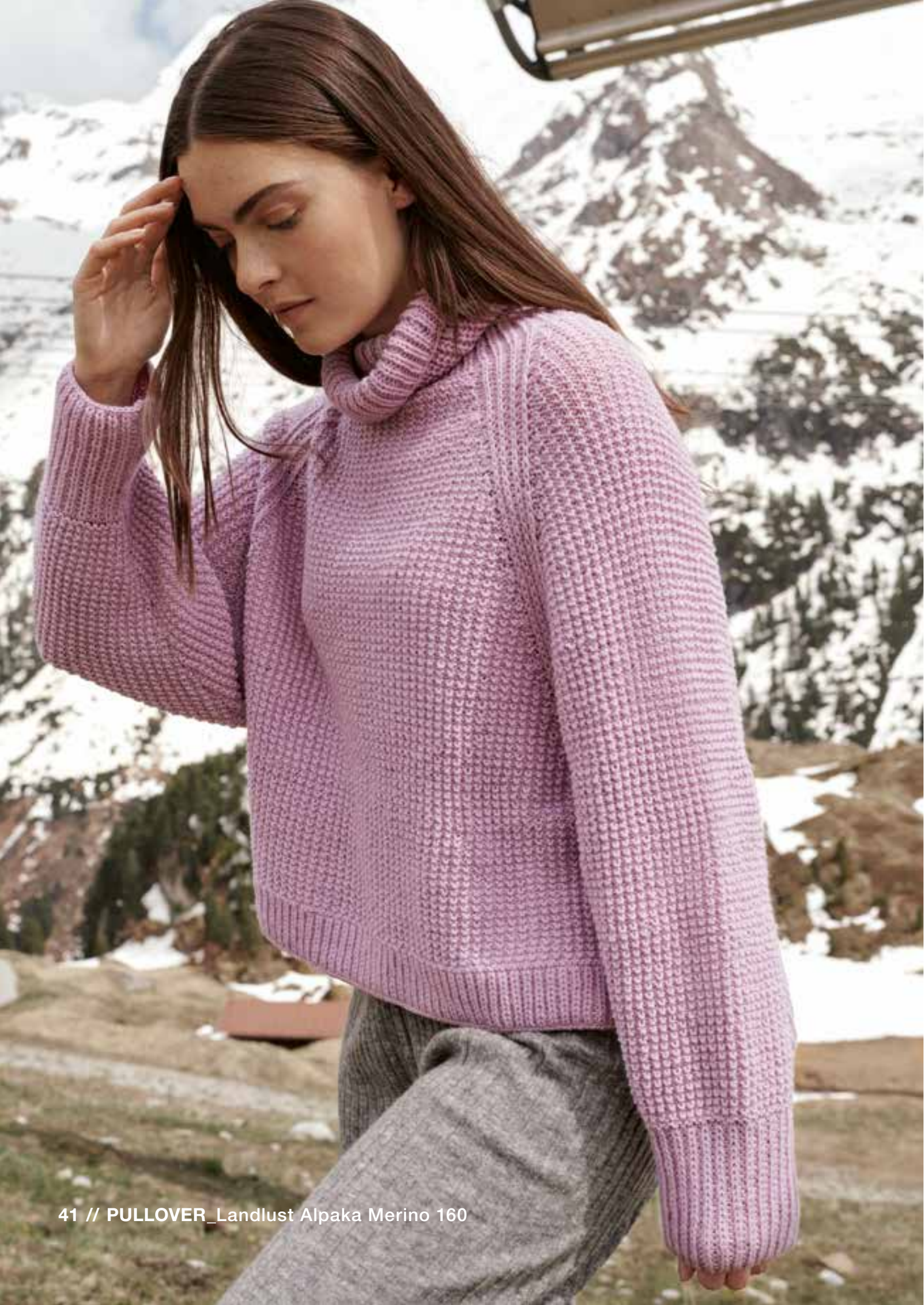
41 // PULLOVER_Landlust Alpaka Merino 160