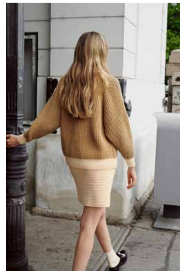
9 // JACKE_Cool Wool Big 10 // ROCK_Cool Wool Big