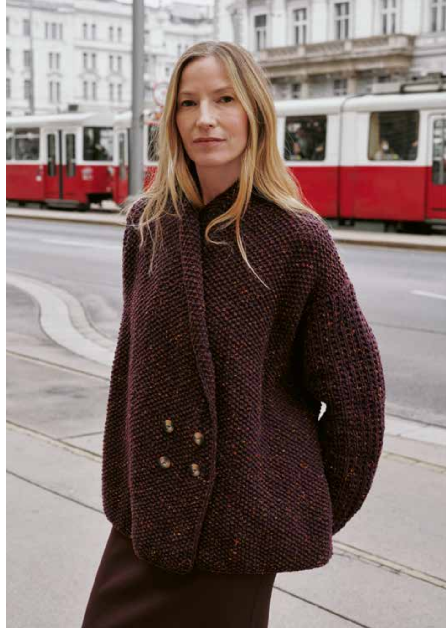
2 // JACKE_Country Tweed