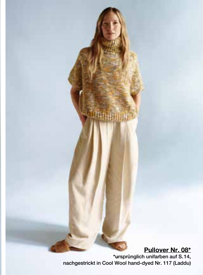
Pullover Nr. 08*

*ursprünglich unifarben auf S. 14, nachgestrickt in Cool Wool hand-dyed Nr. 117 (Laddu)