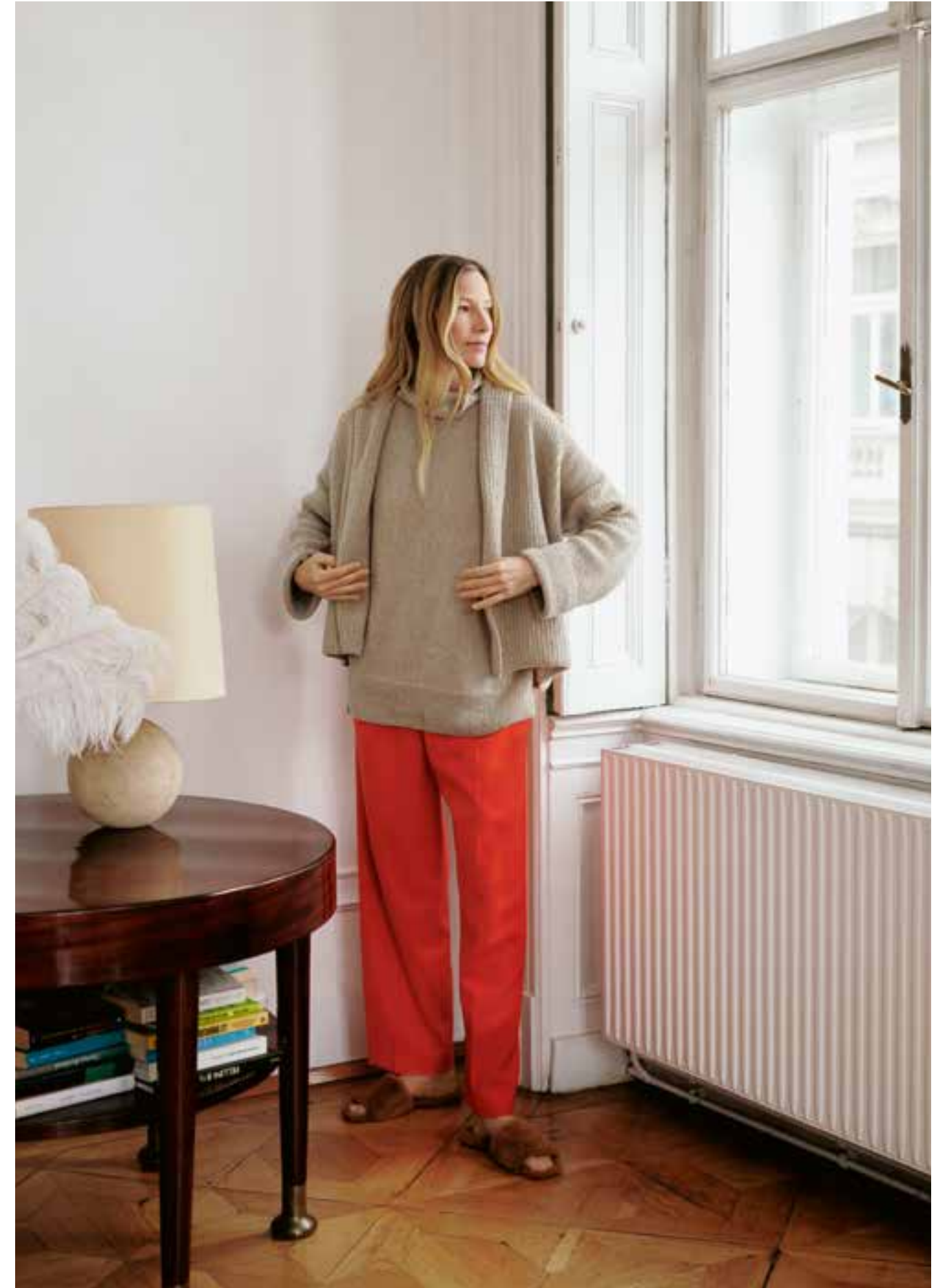
7 // CARDIGAN_Cashmere Verde