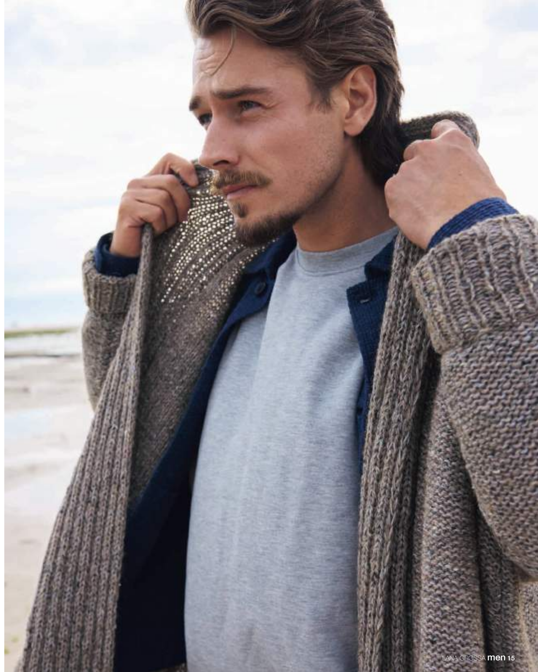
07_COUNTRY TWEED FINE + PUNO DUE