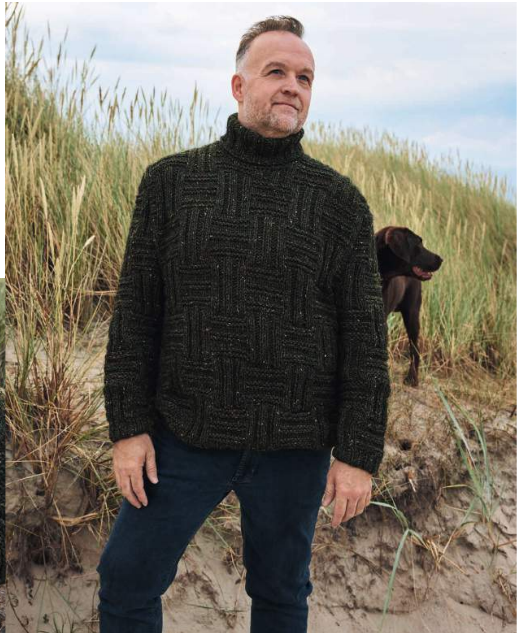
02_COUNTRY TWEED + PUNO DUE

„Rollkragenpullis sind ein toller Jacken-ersatz für die Übergangszeit. Hier habe ich ein klassisches Schurwoll-Tweedgarn mit dem changierenden Puno Due verstrickt. Dazu ein großes Rechts-Links-Muster – so wirkt das Ganze sehr modern.“