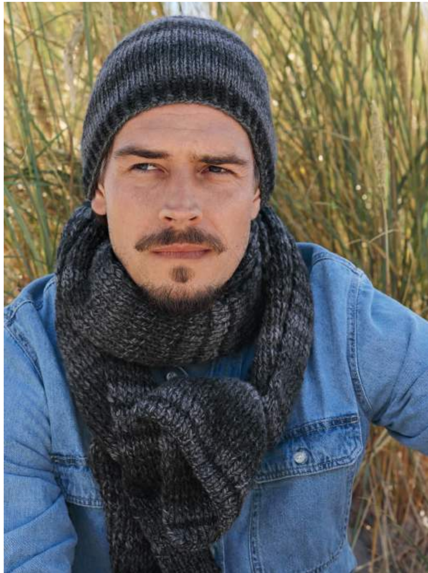
23_DUETTO CLASSICO | 24_ DUETTO PUNO+DUETTO CLASSICO