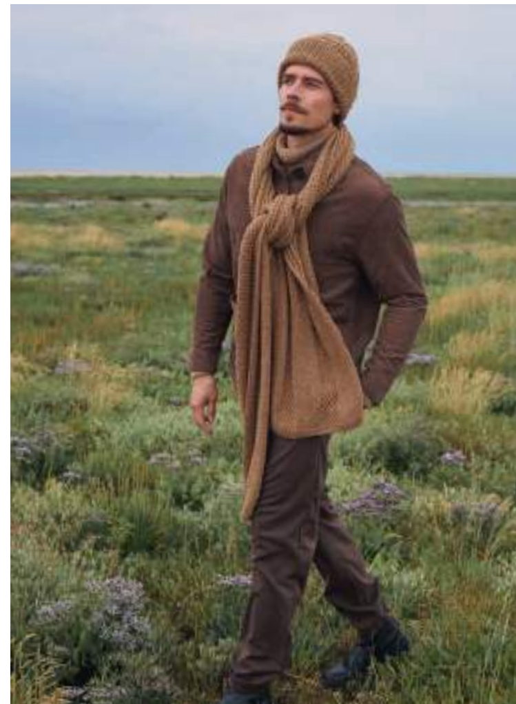
links: 09_COOL MERINO PRINT | 10+11_COOL MERINO BIG