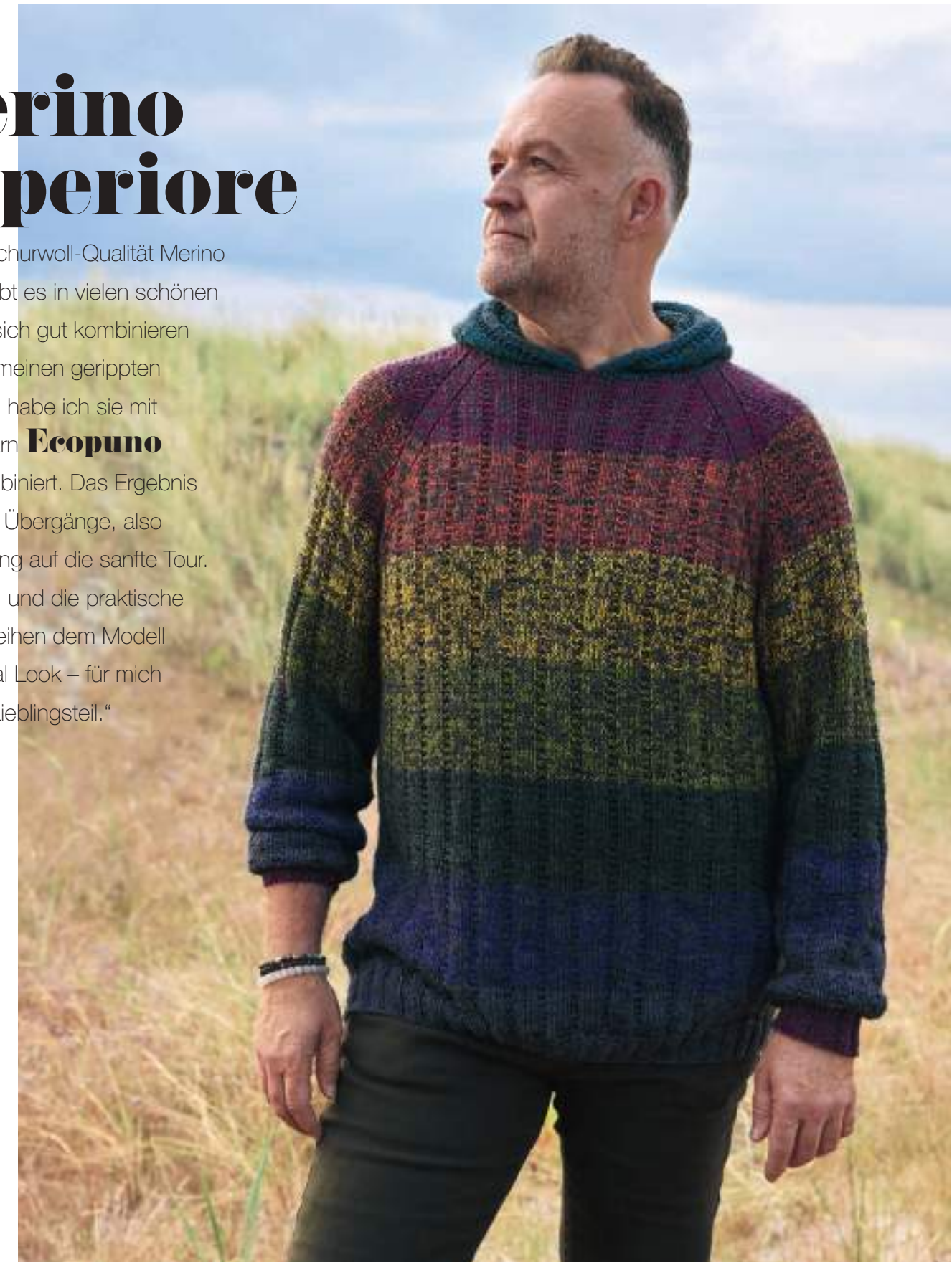
03_ECOPUNO + MERINO SUPERIORE

„Die reine Schurwoll-Qualität Merino Superiore gibt es in vielen schönen Tönen, die sich gut kombinieren lassen. Für meinen gerippten Streifen-Pulli habe ich sie mit dem Netzgarn Ecopuno in Grau kombiniert. Das Ergebnis sind weiche Übergänge, also Color Blocking auf die sanfte Tour. Raglanärmel und die praktische Kapuze verleihen dem Modell einen Casual Look – für mich ein echtes Lieblingsstück.“