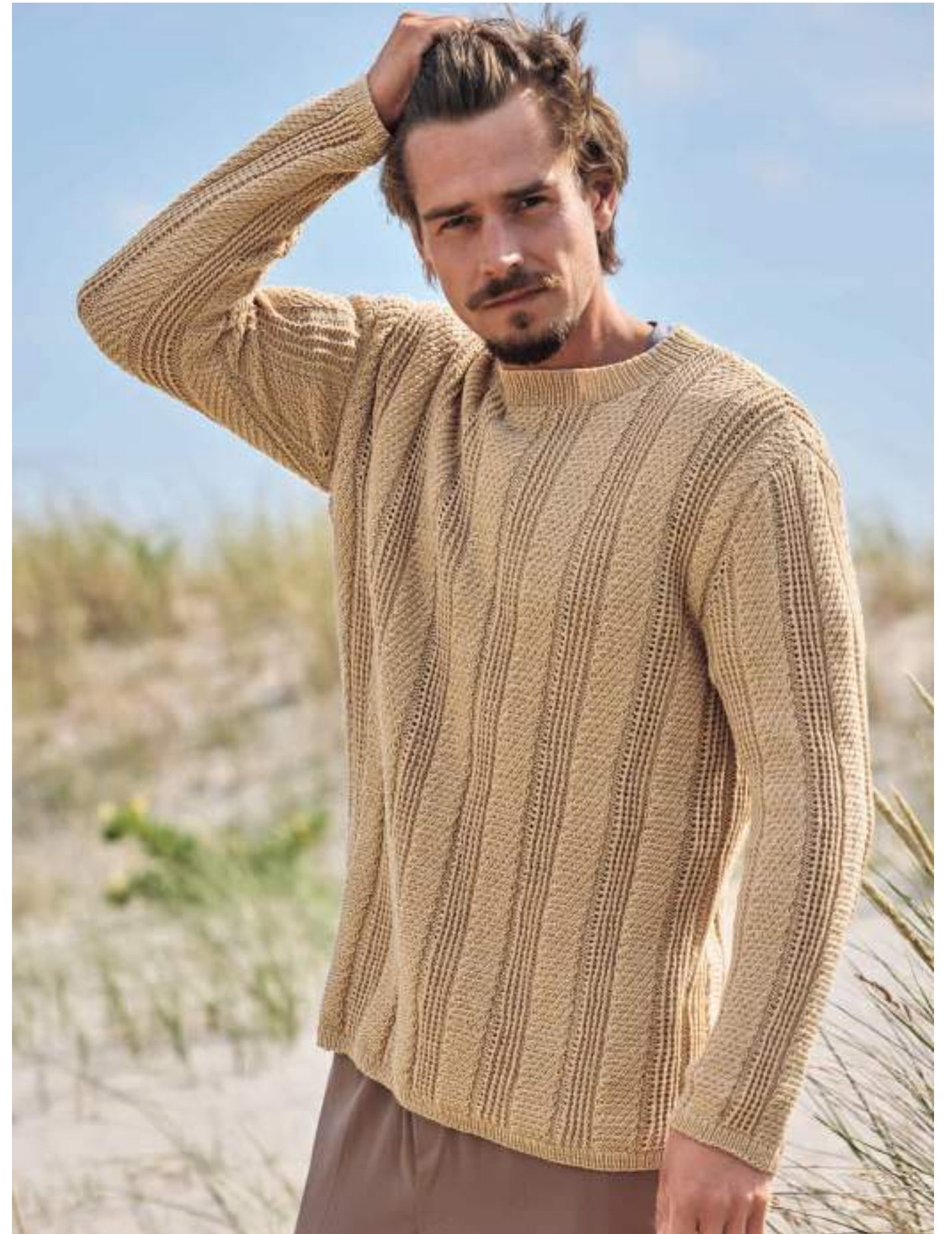
links: 05_COOL MERINO BIG + SETASURI | 06_MERINO SUPERIORE