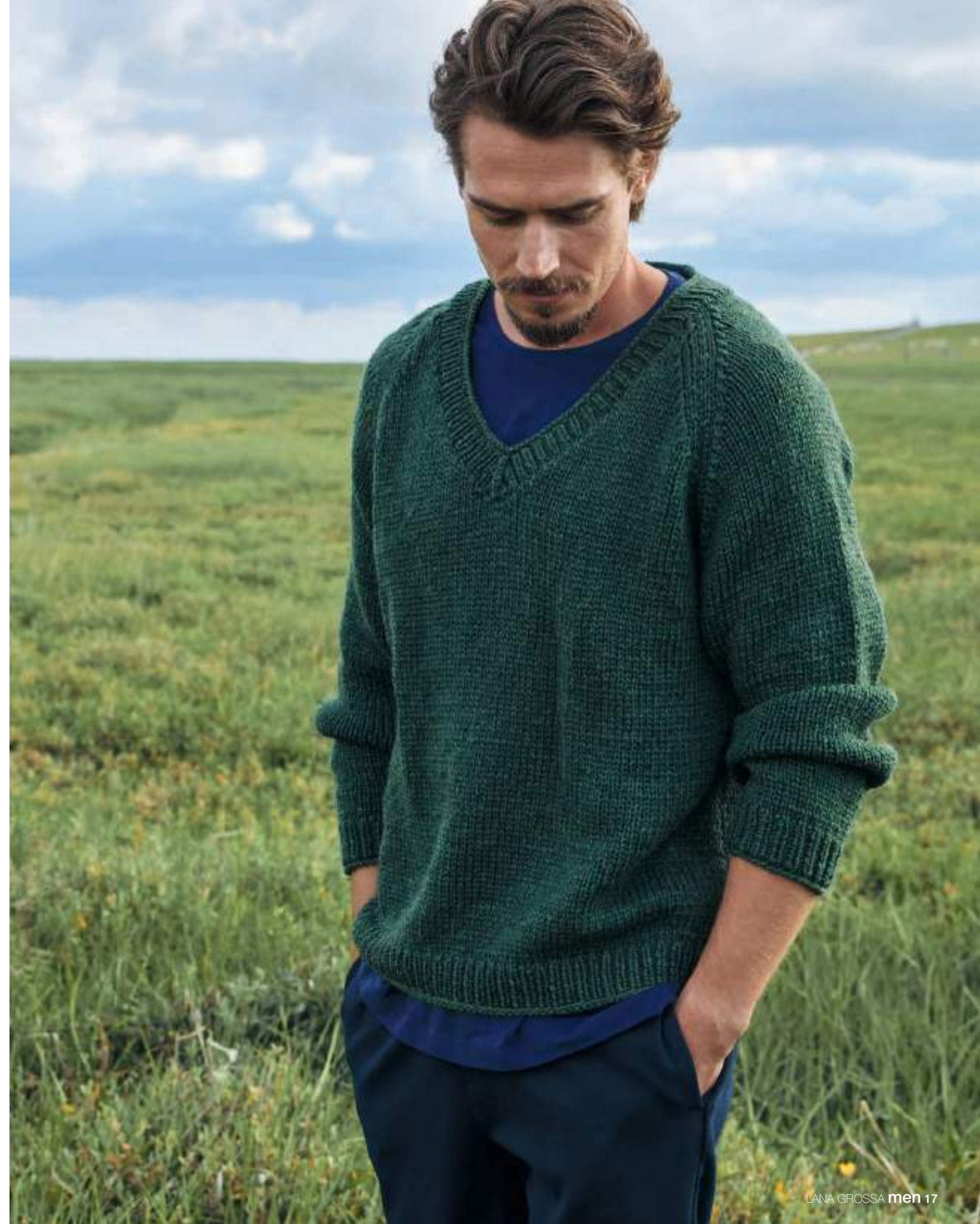
05_COOL MERINO BIG + SETASURI | rechts: 08_COOL MERINO BIG