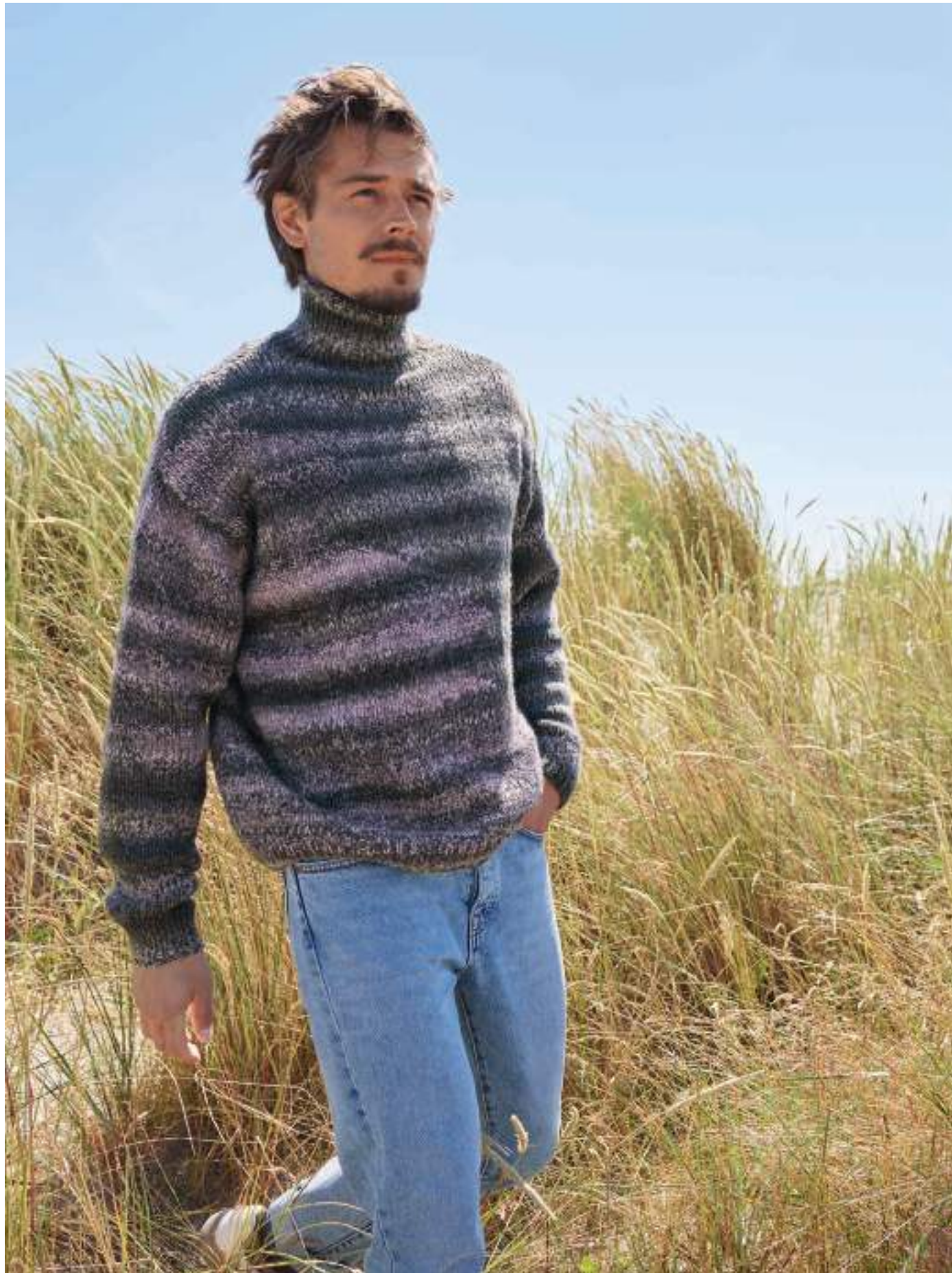
13_ DUETTO CLASSICO+DUETTO PUNO+COOL MERINO | rechts: 14_COOL MERINO BIG+PAPPAGALLO