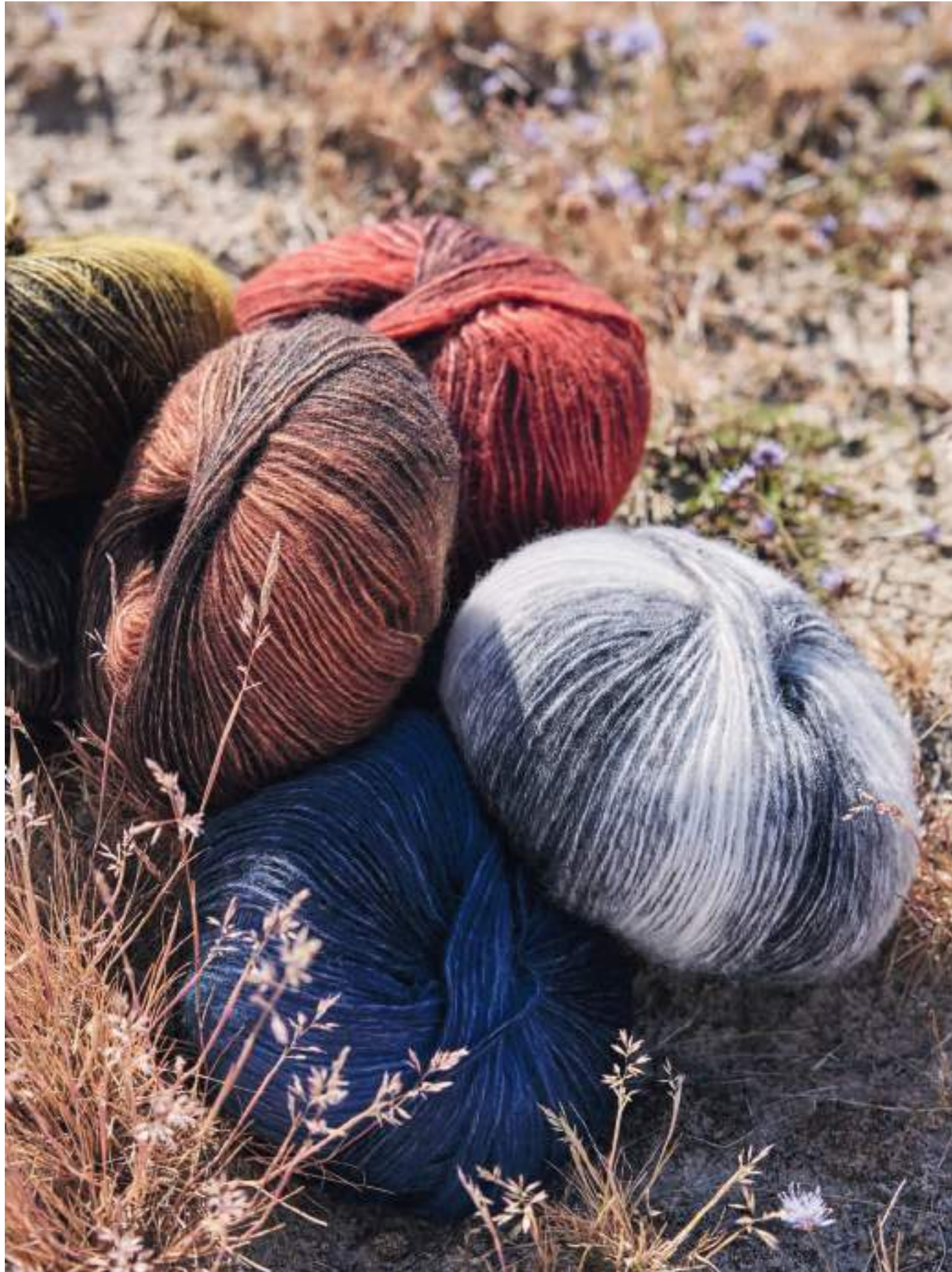
16_DUETTO CLASSICO+COOL MERINO