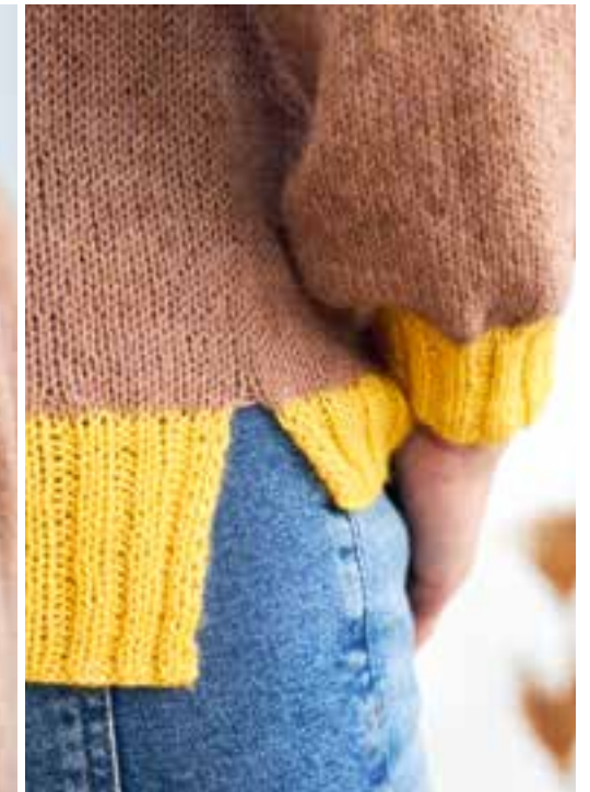
9 - mapala cardigan ECOPUNO № 5+7+32+52