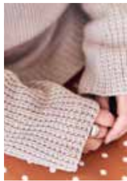
cool wool big