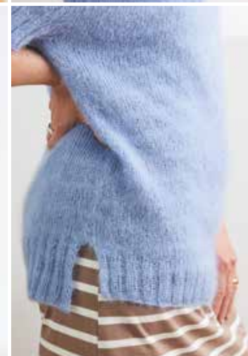
14 – mapala shirt SILKHAIR № 92