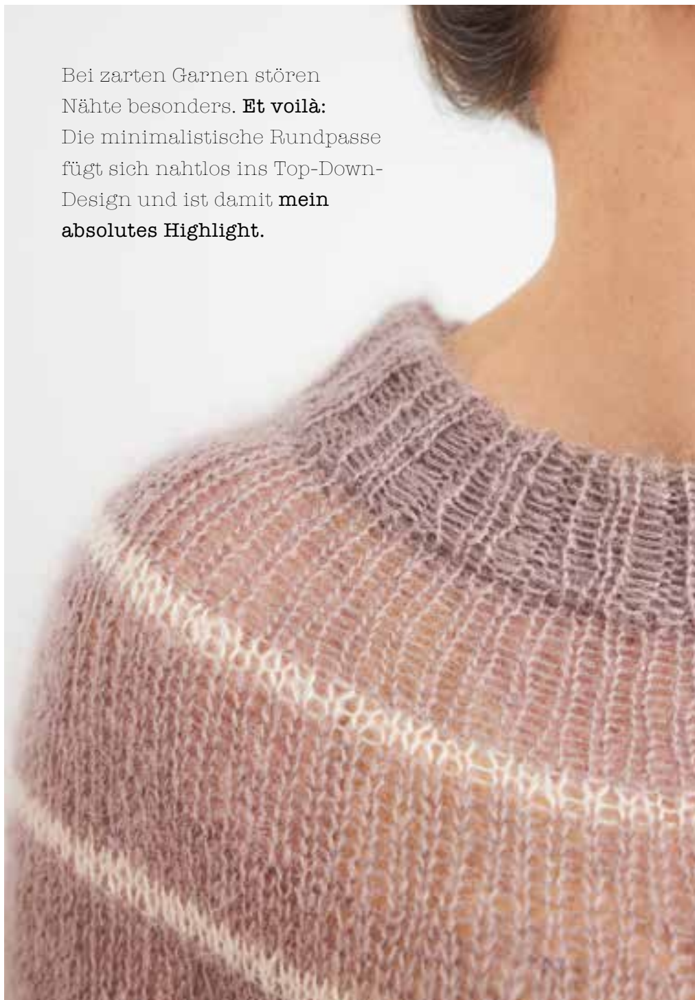
3 - mapala sweater mohair edition SILKHAIR № 18+35

Bei zarten Garnen stören Nähte besonders. Et voilà: Die minimalistische Rundpasse fügt sich nahtlos ins Top-Down- Design und ist damit mein absolutes Highlight.