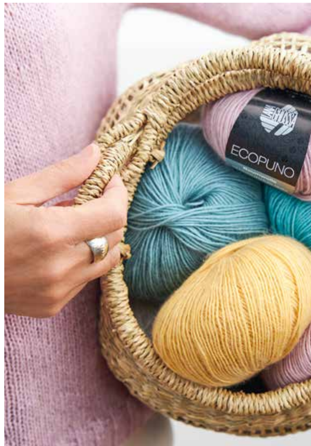
8 - manoppa sweater ECOPUNO № 8+28+61+72

Die süßen Noppen in Softeis-Farben sind die i-Tüpfelchen dieses Entwurfs, aber auch 300% Meditation! Das bedeutet: Eine gute Portion Geduld ist gefragt. Ich finde, die Mühe lohnt sich!