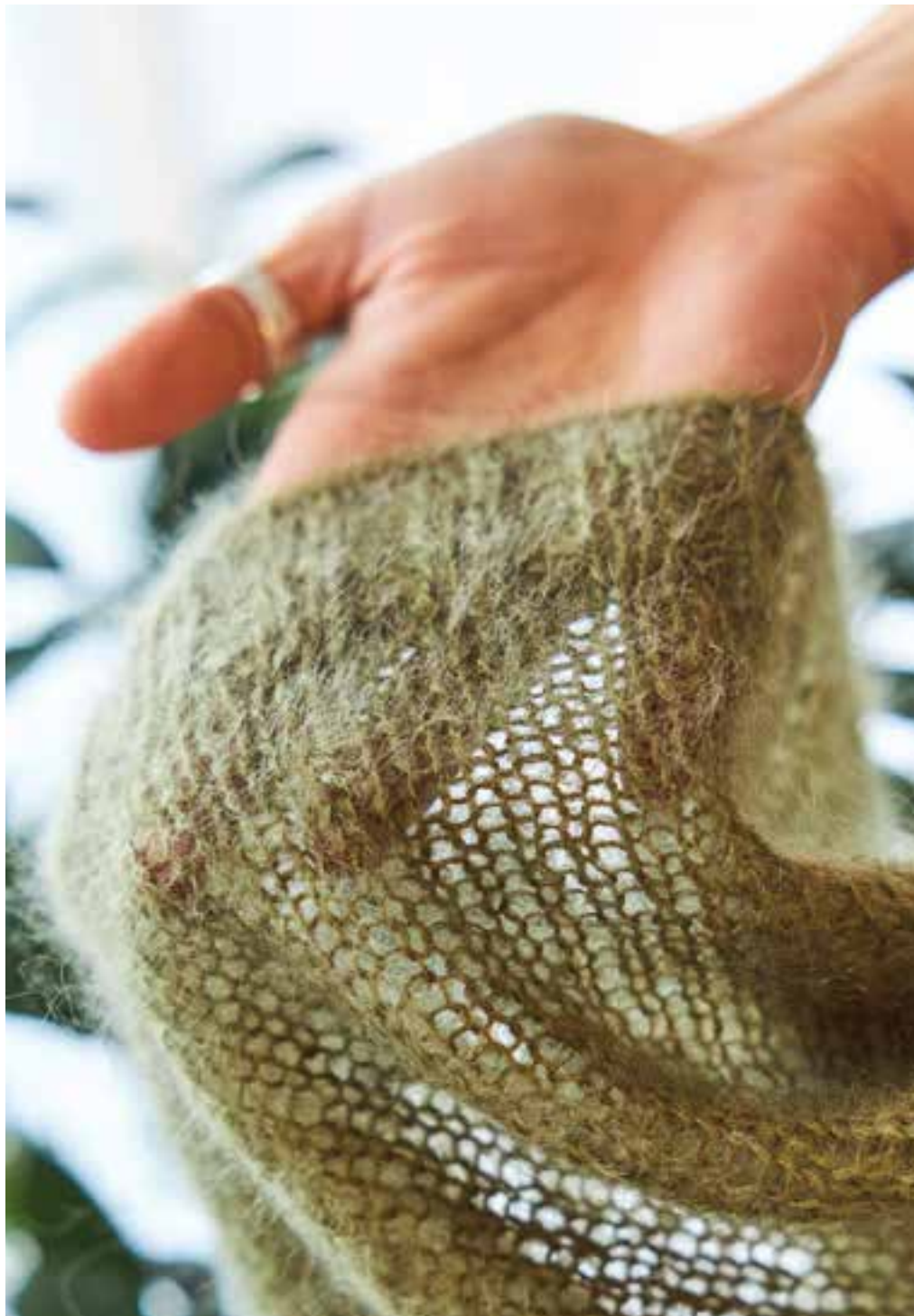
1 - mapala sweater mohair edition SILKHAIR N° 166