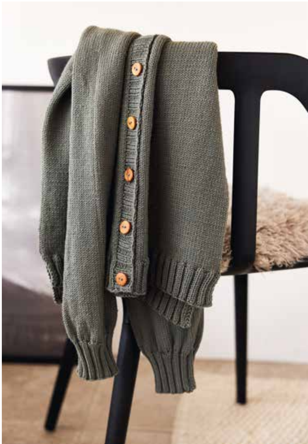
10 - mapala cardigan COOL WOOL № 2079

Wie Material und Farbe einen Look verändern , ist immer wieder verblüffend: Dieser Cardigan, im sanften Schilfgrün der Cool Wool, hat nämlich die gleiche Anleitung , wie die 4-farbige Version zuvor!