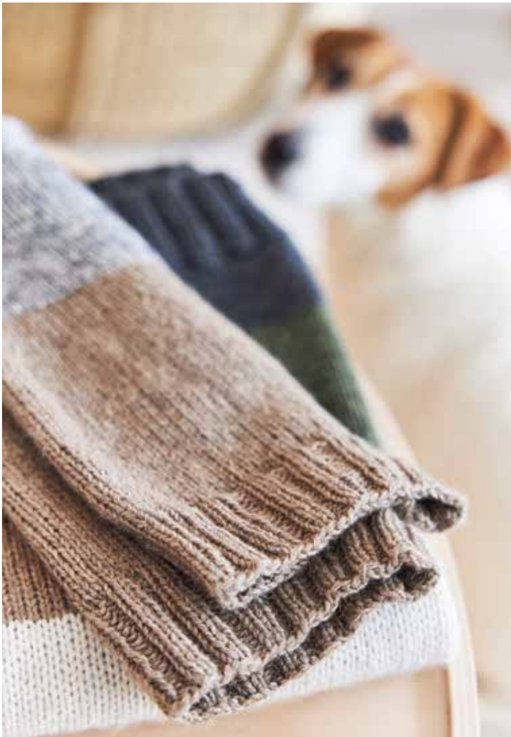
13 - mapala shirt ALLORA № 4, 10, 13, 28, 29