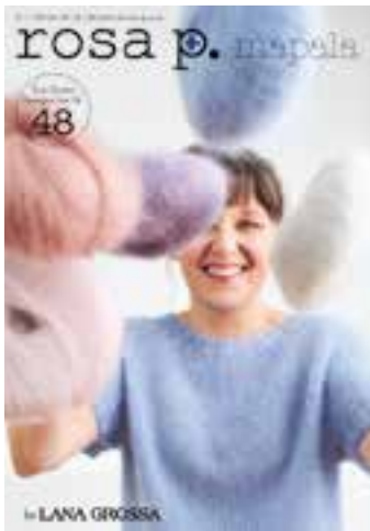
mapala sweater mohair edition