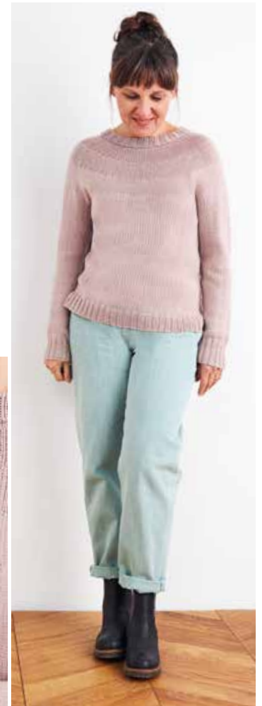
5 - mapala sweater COOL WOOL № 2010