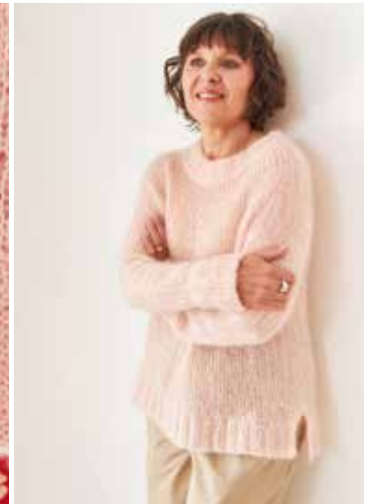
2 - mapala sweater mohair edition SILKHAIR № 86+93