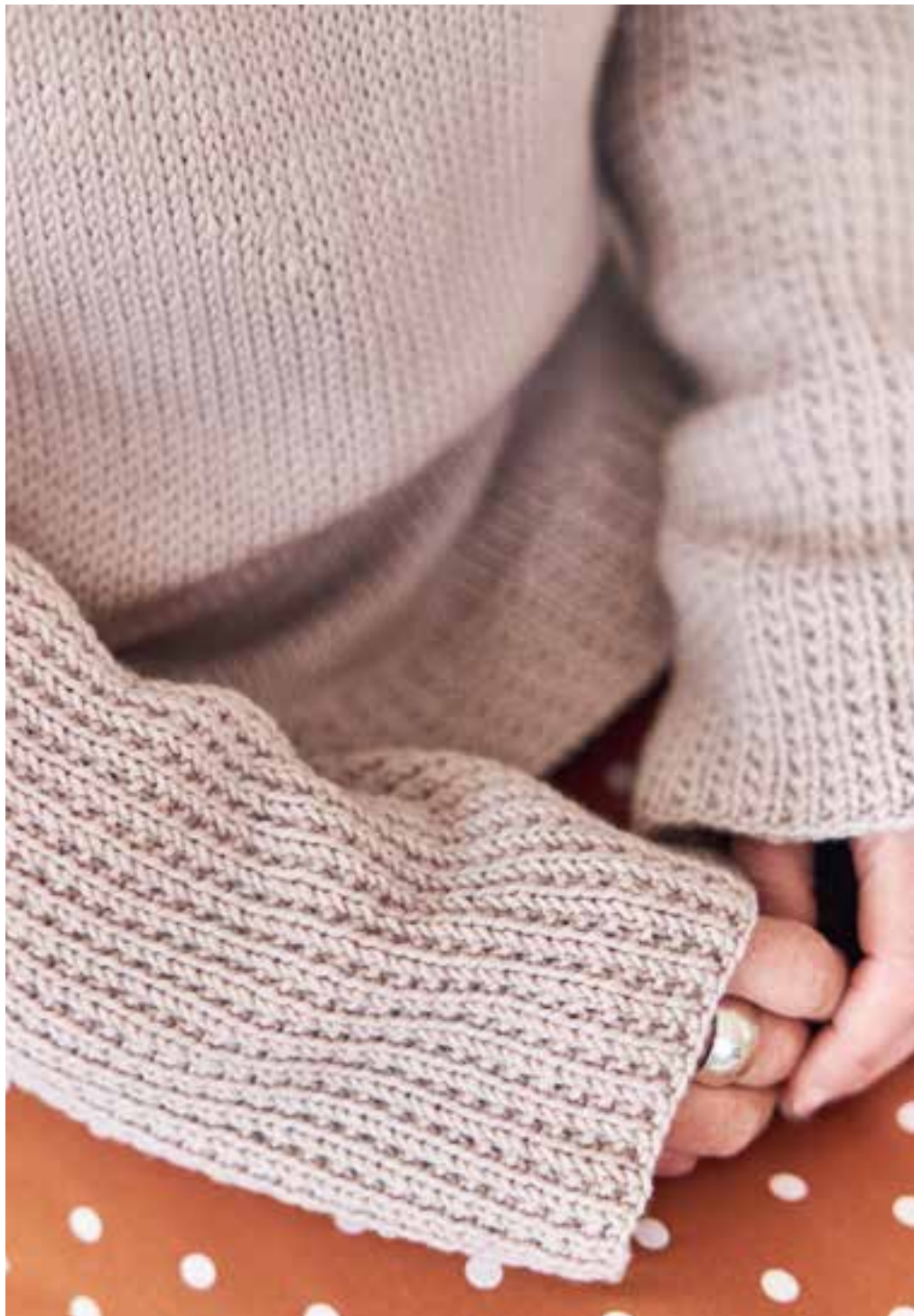
7 - mapalli sweater COOL WOOL BIG № 945