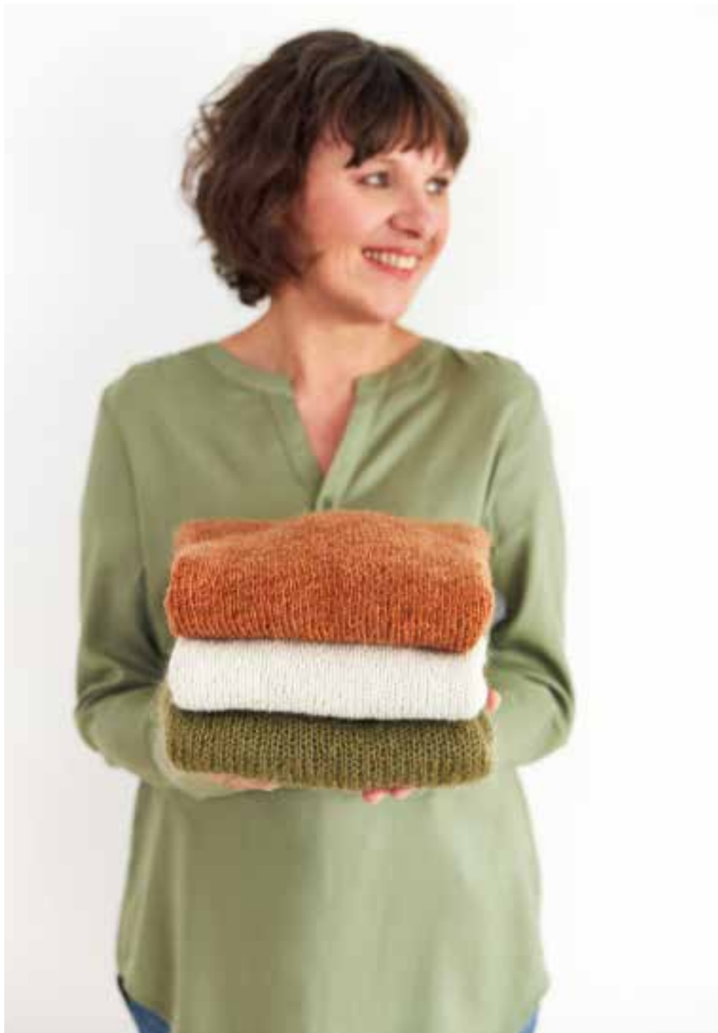
15 - mapala shirt PUNO DUE № 5

„Schimmernde Farben werden den edlen Look des Shirts fantastisch betonen“, dachte ich mir. Eine gute Entscheidung! Einfache Bündchen, keine Nähte, dazu die feine Netzstruktur von Puno Due - das ist Purismus von seiner schönsten Seite.