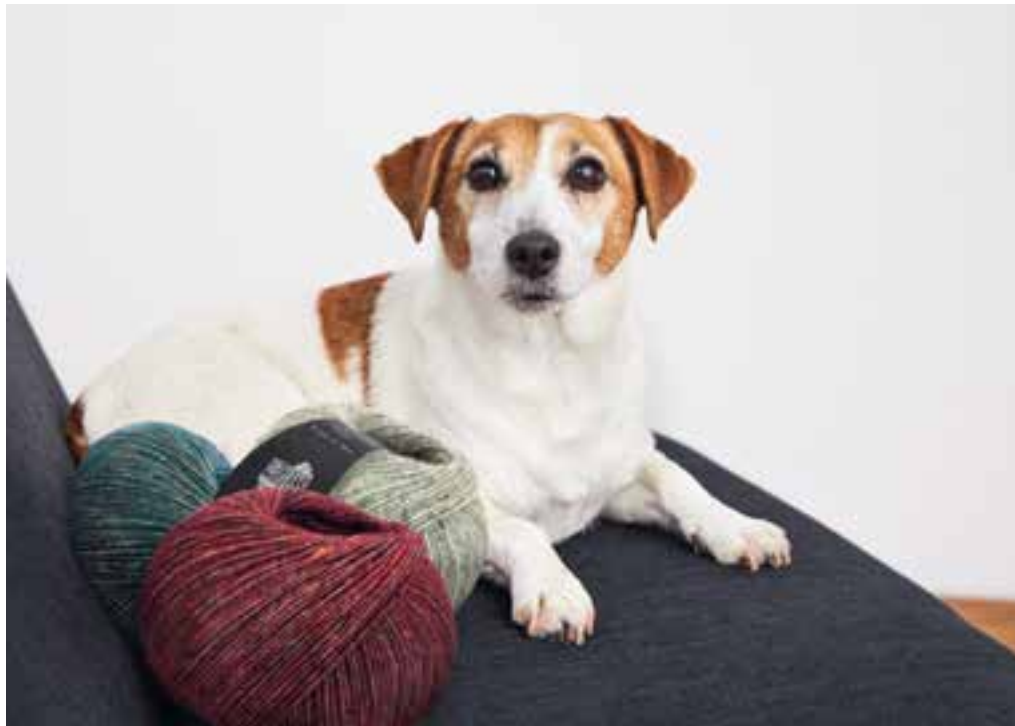
6 - mapala sweater ECOPUNO TWEED № 301 + 306 + 309 + 312

Hazel spielt ( super! ) gern mit der Wolle, ich lieber mit Farben. Und bin begeistert: Die sanften Melange-Töne von Ecopuno Tweed harmonieren nämlich nicht nur – wie der maritime Ringelsweater beweist – wunderbar miteinander, sie funktionieren auch mit den Unis der Ecopuno-Family ( super! ) gut!