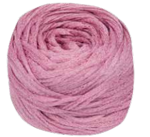
About Berlin Chilly