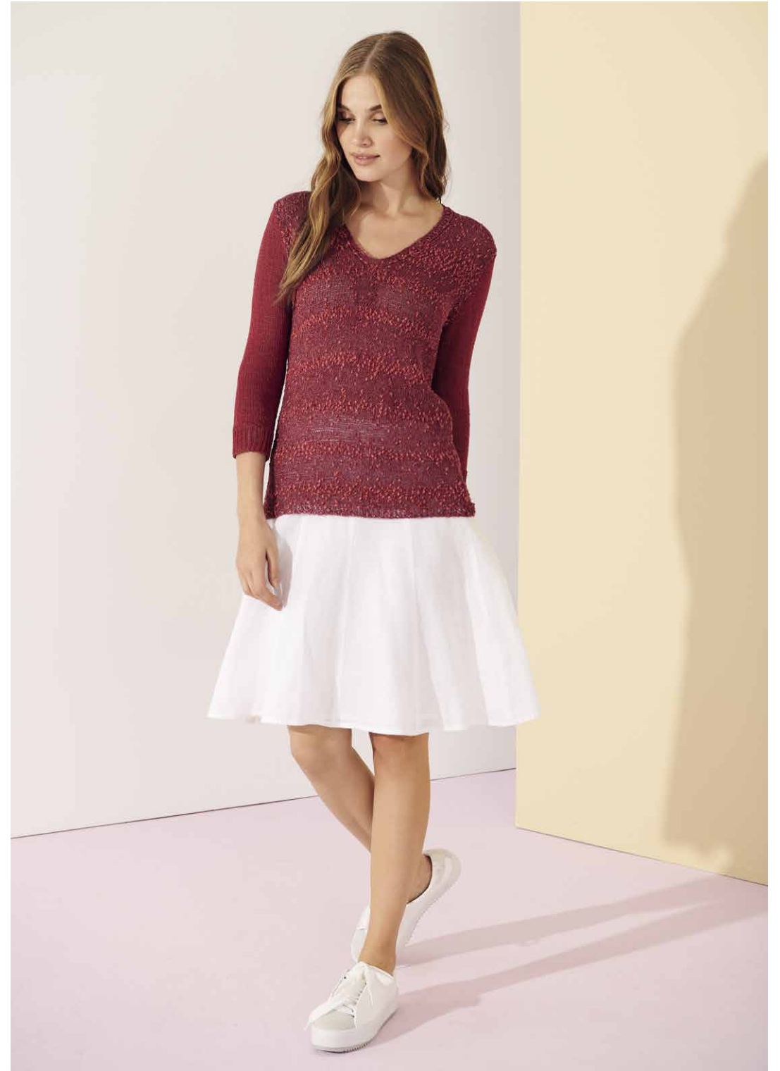
13 CAPRI / STROMBOLI