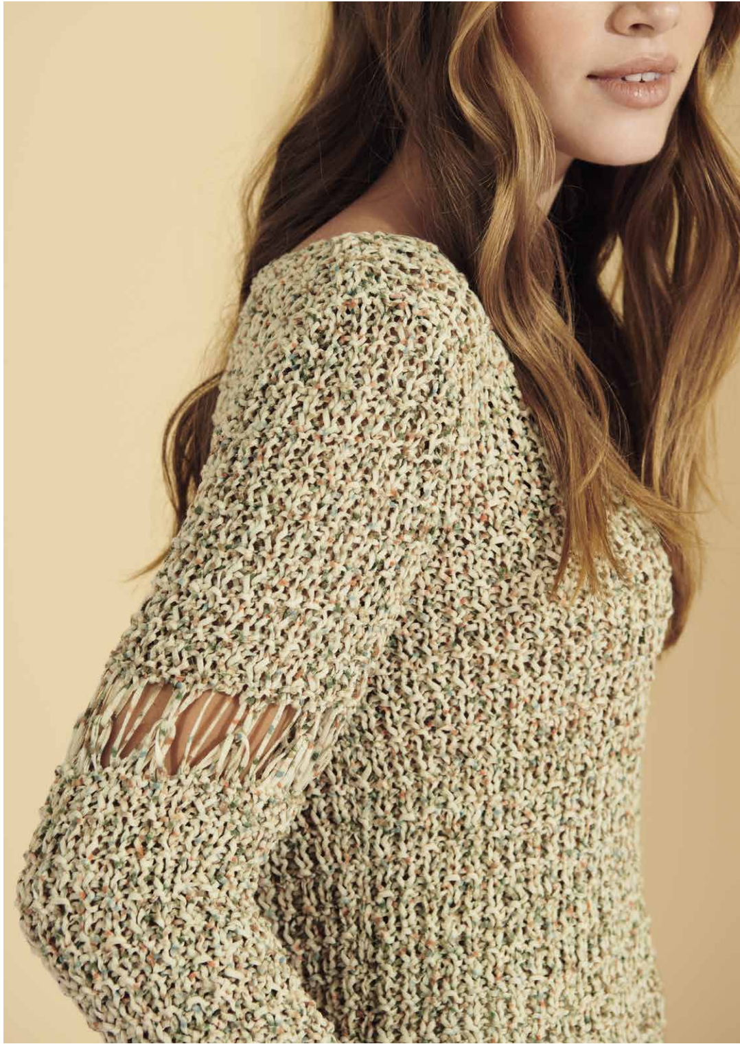
7 ABOUT BERLIN SPARKLY