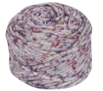
About Berlin Sparkly

So schön wie Winterabende mit kuscheligen Decken und warmem Punsch auch sind, nichts ist schöner als der erste Cappuccino in der Frühlingssonne und die Spitzen der Hyazinthen und Tulpen, die sich vorsichtig der Sonne entgegenstrecken. Genau dieses Gefühl haben wir in unserem Lookbook mit zarten Modellen in vielen frischen Grün- und Pastellnuancen, den leichten Strukturen unserer neuen Garne und luftigen Schnitten eingefangen. ABOUT BERLIN SPARKLY und ABOUT BERLIN CHILLY sind beides Bändchengarne mit kühlem Griff. Bei CHILLY sorgt dafür 100% Leinen und bei der für einen melierten Effekt bedruckten SPARKLY ein hoher Baumwollanteil. PAPPAGALLO ist unsere sommerliche Antwort auf den noch anhaltenden Tweed-Trend. Kunterbunte oder Ton-in-Ton miteinander verdrehte Fäden sorgen für einen tollen Effekt, für den man sich aufwändige Muster getrost sparen kann. CAPRI und STROMBOLI verarbeitet man idealerweise in einem Modell und hat mit den aufeinander abgestimmten Farbtönen zum einen ein glattes, glänzendes und elegantes Garn, zum anderen kleine Noppen für Streifen, Blenden oder Bündchen. Der Anteil von Seide sorgt für eine dezente Portion Glamour. Unsere ECOPUNO ist nicht neu, wird aber von allen innig geliebt: Luftig, leicht, sommerlich, schlicht, tolle Farben, eben ein Garn für alle Lebenslagen. Zumindest gefühlt sind die Tulpen doch nun schon da, oder? Durchhalten und die Wartezeit mit Stricken verkürzen!