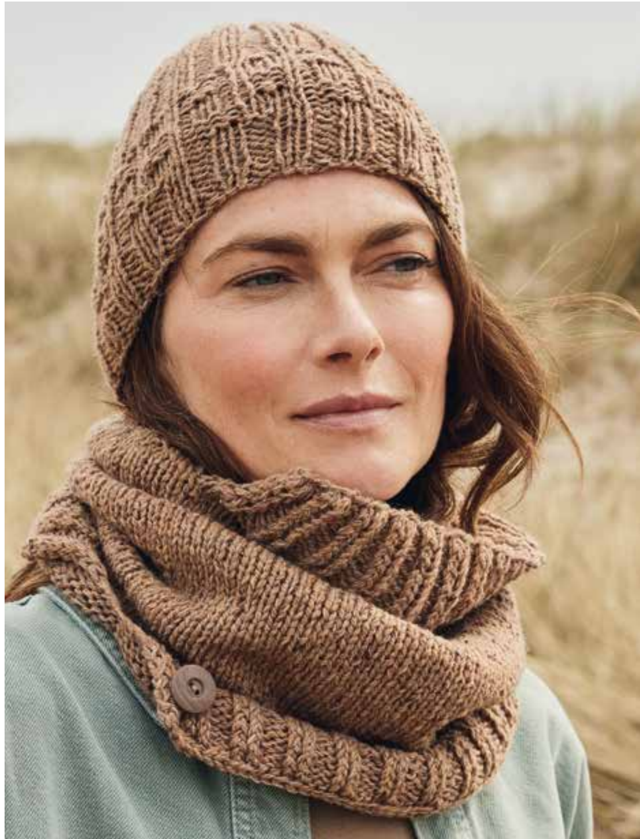
04 + 05 – MÜTZE, LOOP COUNTRY TWEED FINE (LANDLUST SOFT TWEED 180) + COOL WOOL LACE | 06 – LOUNGE PANTS COOL WOOL