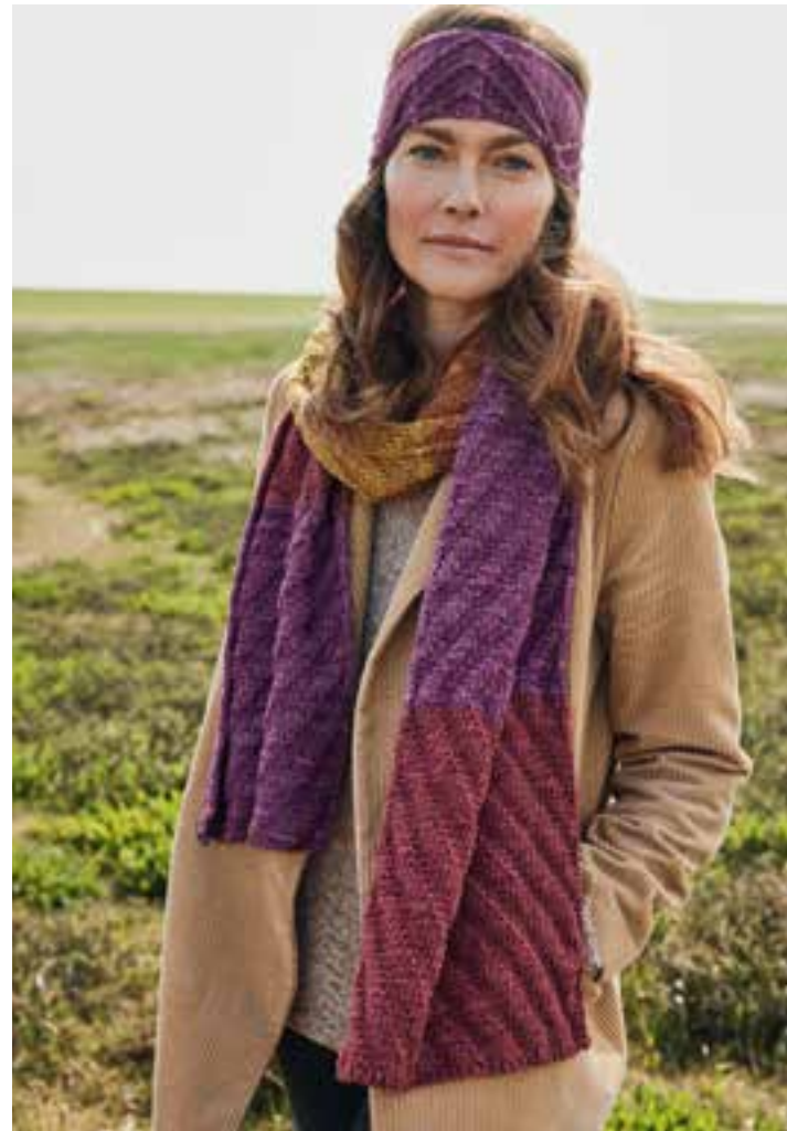
08 + 09 – MÜTZE, SCHAL COOL WOOL VINTAGE