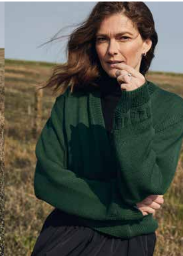
03 – JACKE MERINO SUPERIORE