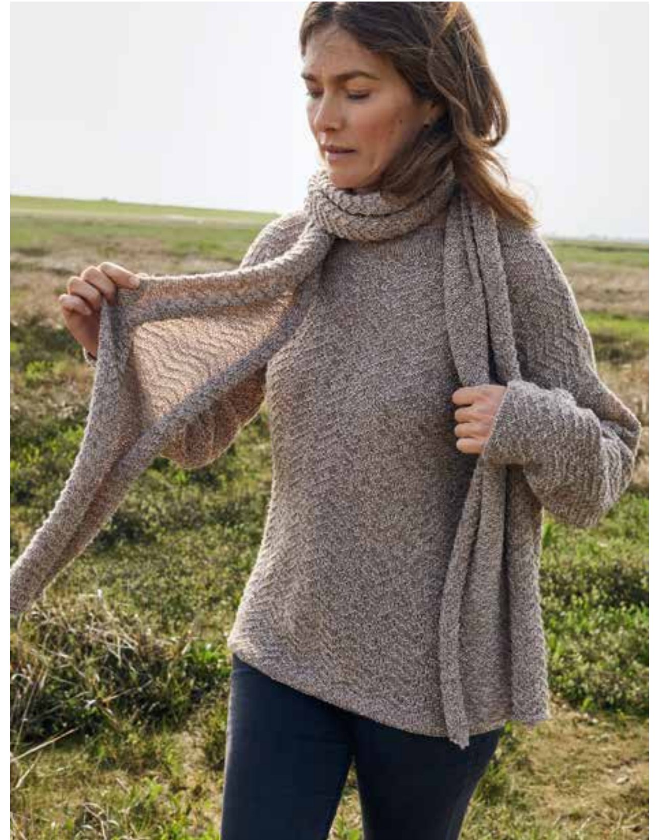
16 + 17 – PULLOVER, SCHAL COOL WOOL LACE