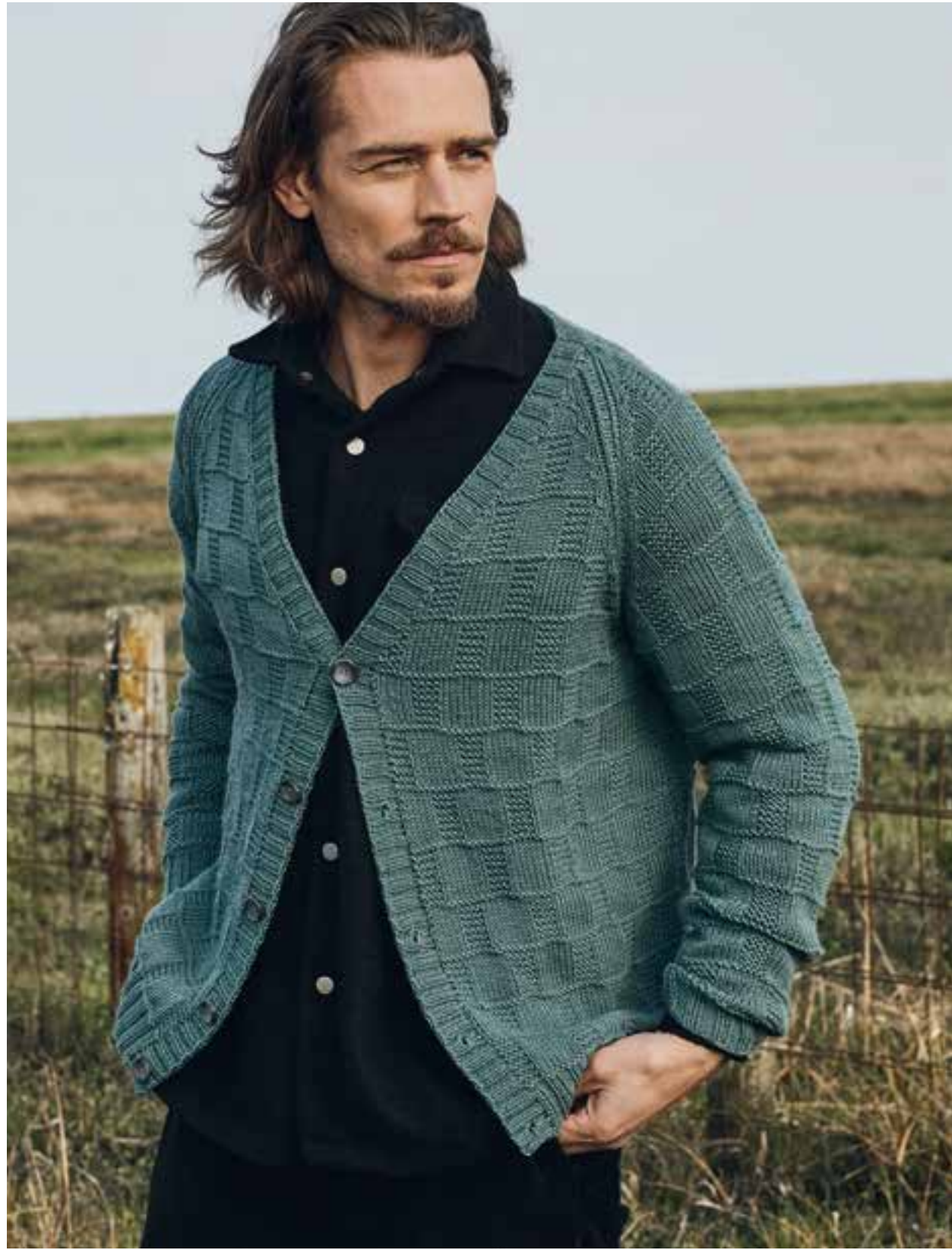
23 – JACKE COOL WOOL BIG | 24 + 25 – MÜTZE, SCHAL MERINO UNO