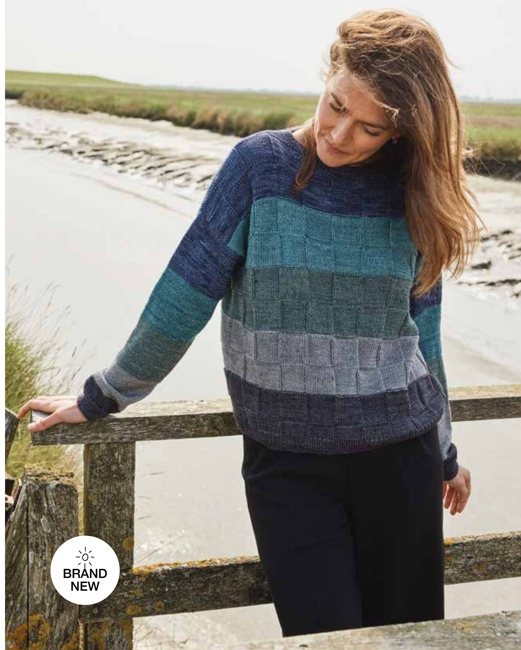
rechte Seite: 12 – PULLOVER COOL WOOL VINTAGE (Die Anleitung funktioniert auch mit COOL WOOL )