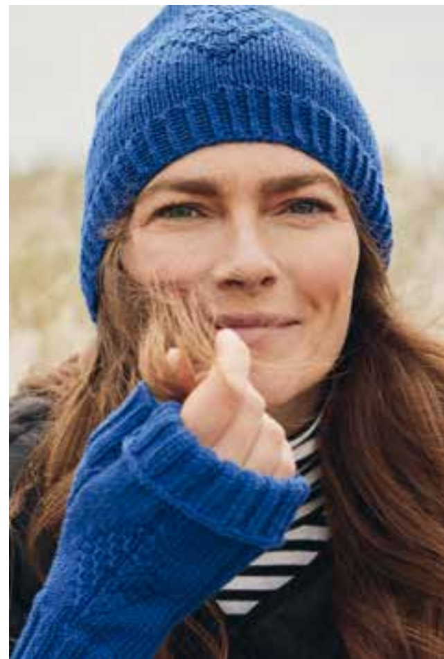
01 – PULLOVER COOL WOOL BIG | MÜTZE, STULPEN COOL WOOL (Mod. 14 + 15, Seite 17)