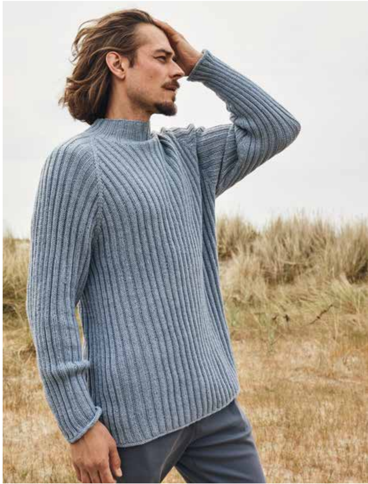
18 – PULLOVER MERINO UNO | 19 – JACKE COOL WOOL SETA