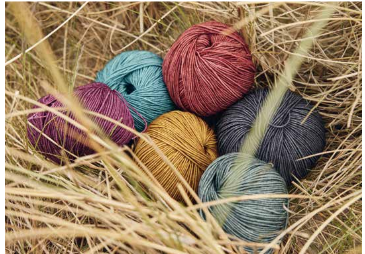
07 – ROLLKRAGEN-EINSATZ COOL WOOL VINTAGE

Auf den Nadeln unverzichtbar sind die bewährten Klassiker COOL WOOL und COOL WOOL BIG. In dieser Saison überraschen beide Qualitäten als dezent bedruckte Version in zehn Farben. Neben Anthrazit und Hellgrau gibt es acht edle Töne, die durch ihre leicht changierende Optik an Juwelen erinnern. Das Ergebnis sind ausdrucksvolle Strickbilder, die auch einfache Teile gut aussehen lassen.