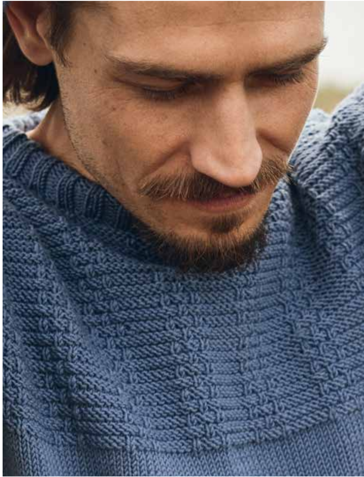
26 – PULLOVER COOL WOOL