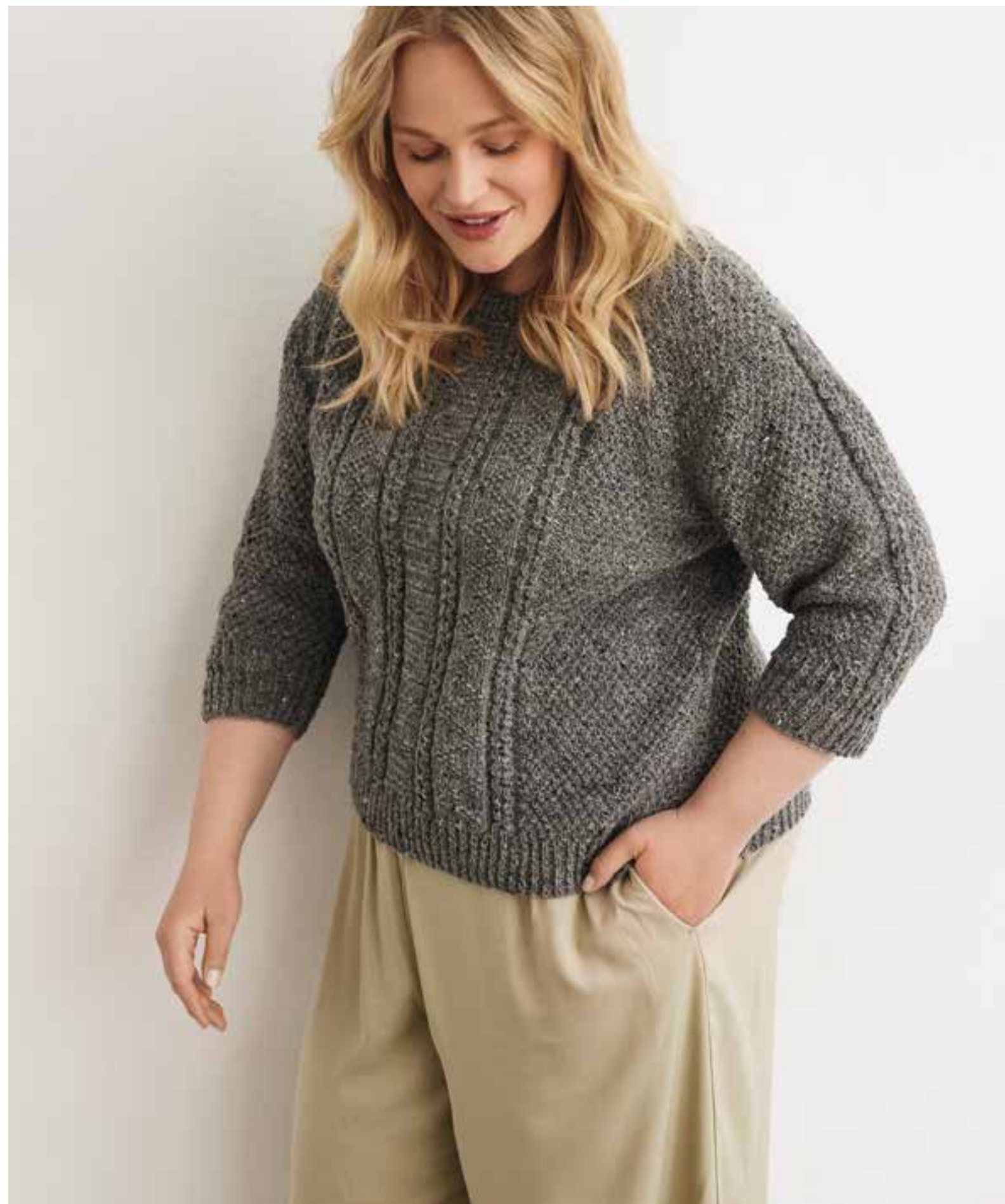
42 – PULLOVER COUNTRY TWEED FINE (LANDLUST SOFT TWEED 180)