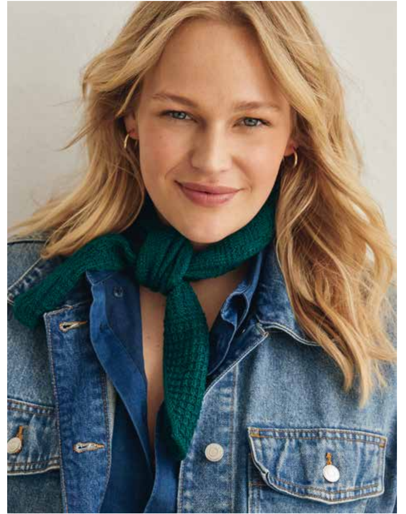
38 – PULLOVER MERINO UNO | 39 – HALSTUCH COOL WOOL LACE