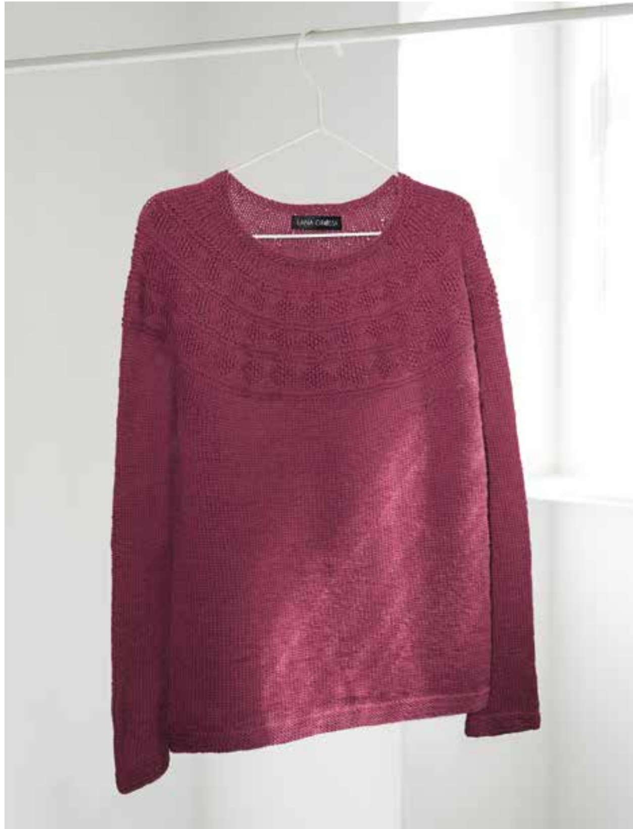
32 – PULLOVER MERINO UNO