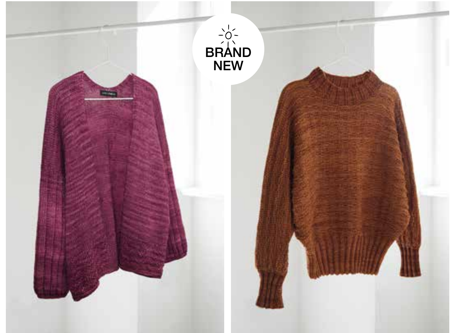
33 – CARDIGAN COOL WOOL BIG | COOL WOOL BIG VINTAGE rechts: PULLOVER COOL WOOL BIG VINTAGE (Mod. 01 von Seite 4/5)