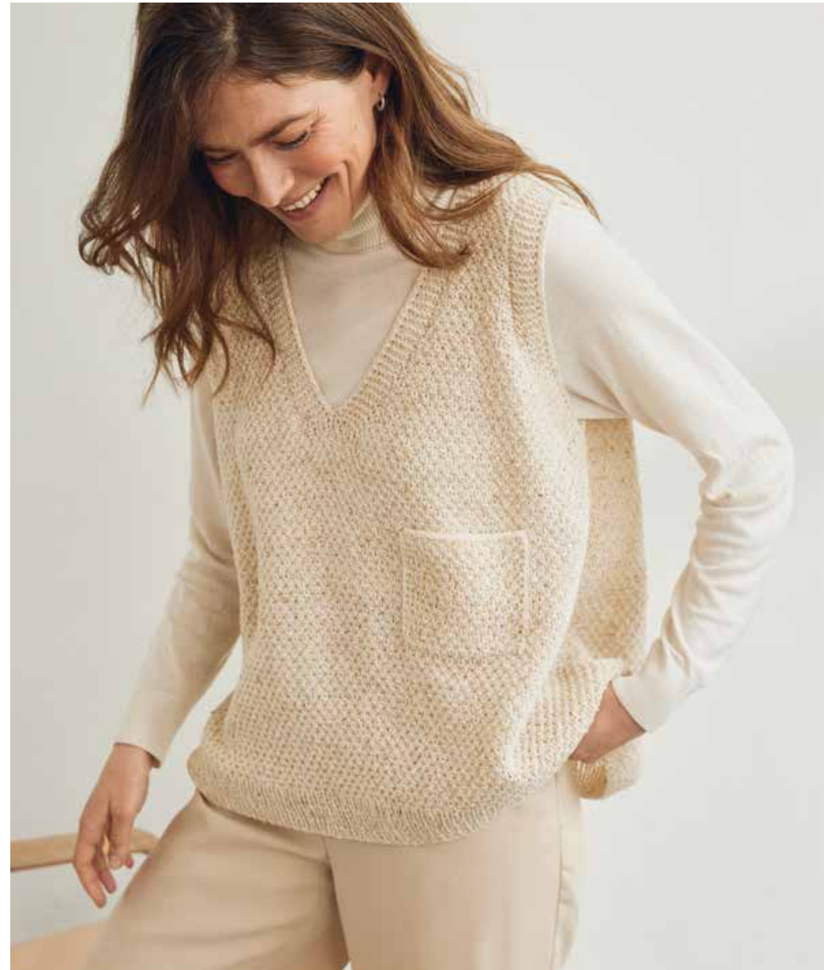
36 – PULLUNDER MERINO SUPERIORE | 37 – COUNTRY TWEED FINE (LANDLUST SOFT TWEED 180)