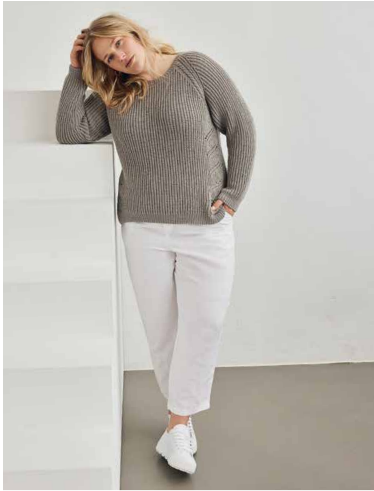
34 – PULLOVER COOL WOOL , rechts: 35 – ROLLKRAGEN-EINSATZ BINGO