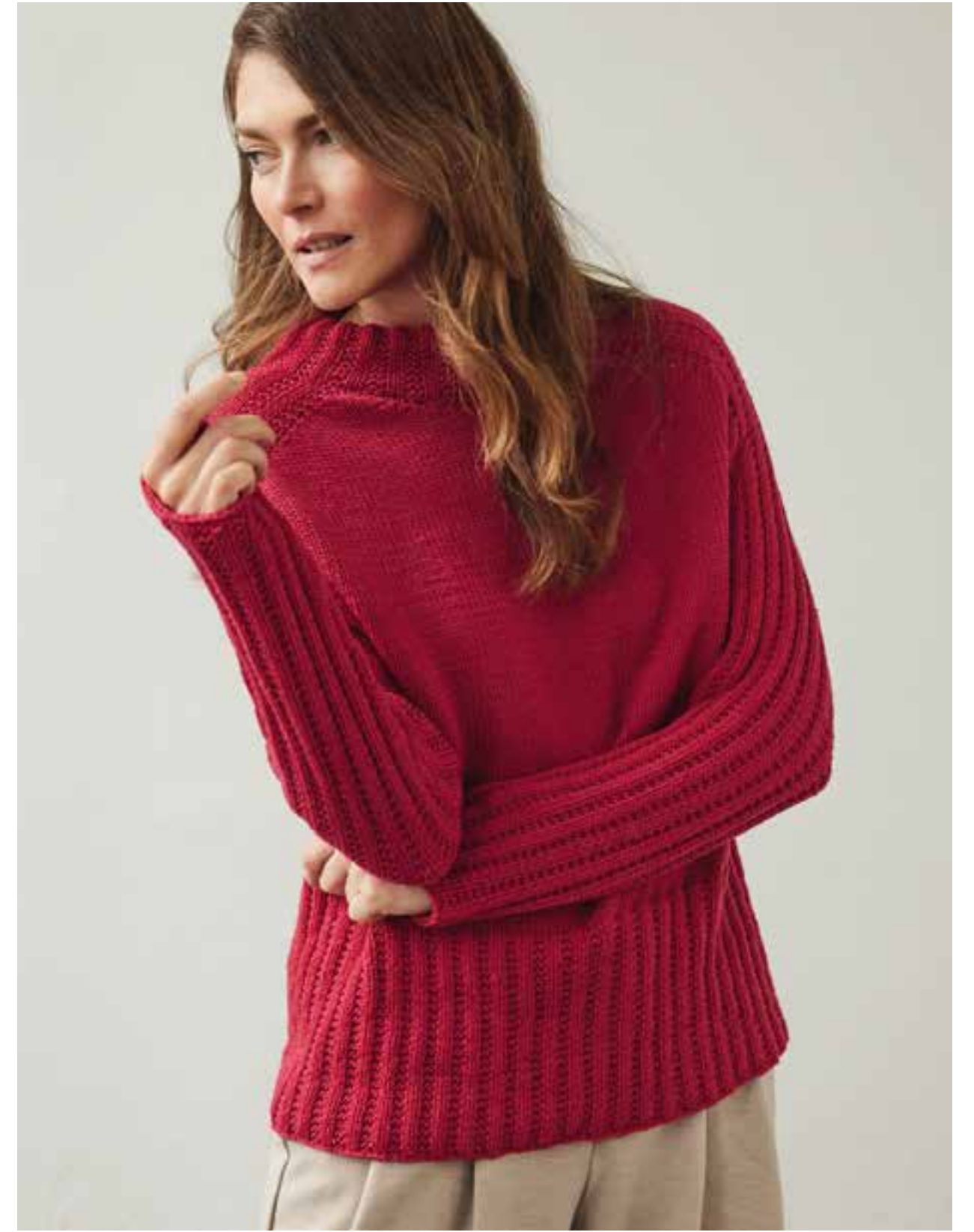
50 – V-PULLOVER MERINO UNO | 51 – PULLOVER COOL WOOL BIG