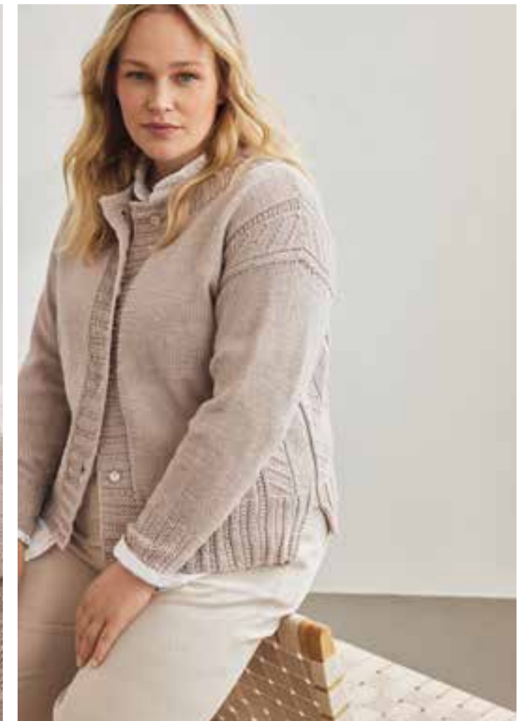
29 – JACKE COOL WOOL BIG