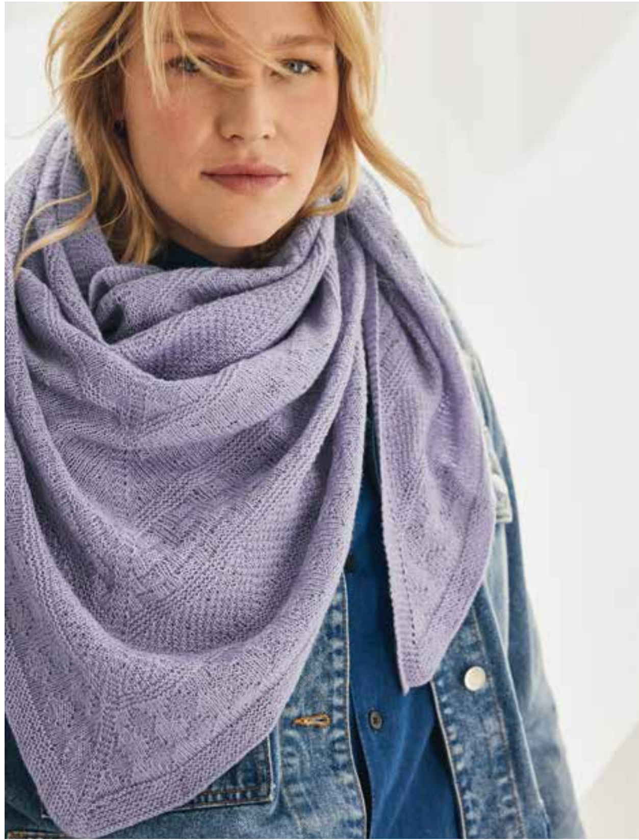
43 – DREIECKSTUCH COOL WOOL LACE | 44 – PONCHO BINGO