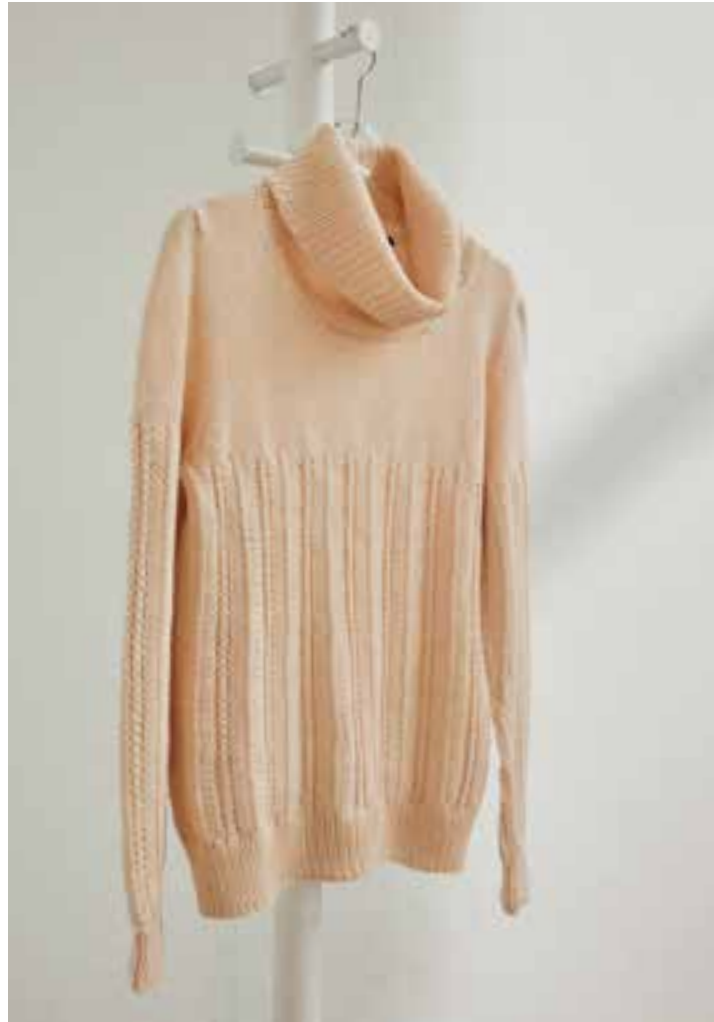
40 | 41 – PONCHO | PULLOVER (Mitte und rechts) COOL WOOL BIG