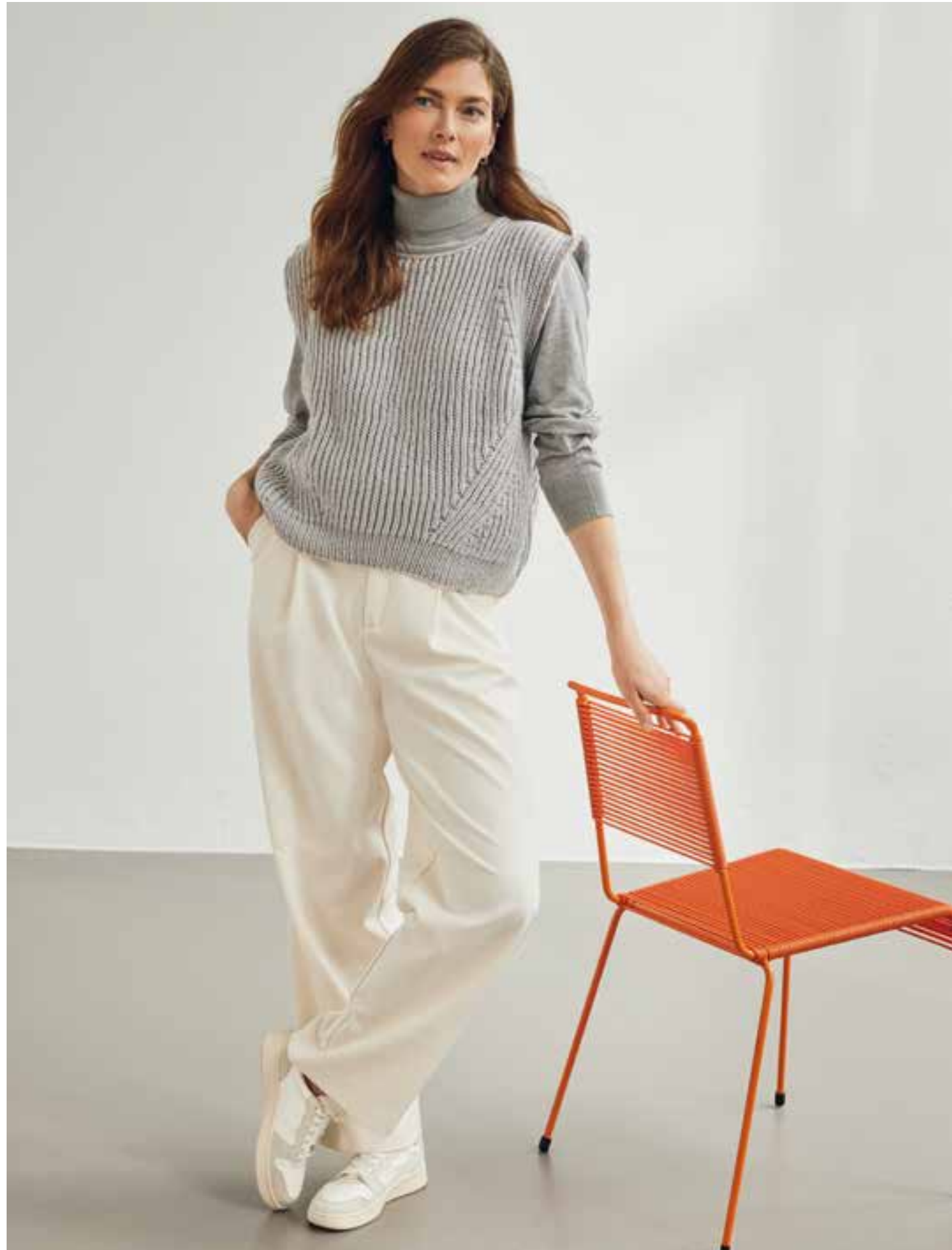
47 – PULLUNDER MERINO UNO