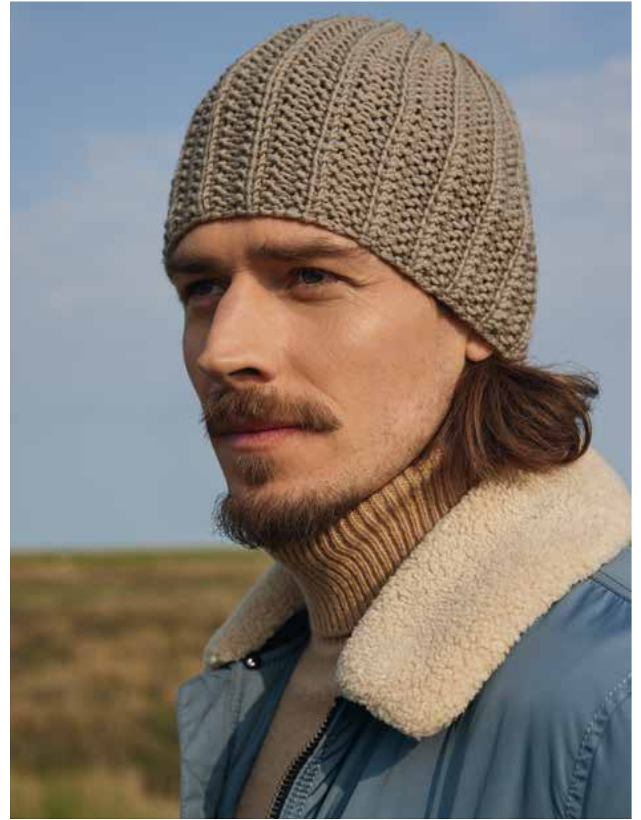
27 – ROLLKRAGEN-EINSATZ COOL WOOL BIG | 28 – MÜTZE BINGO