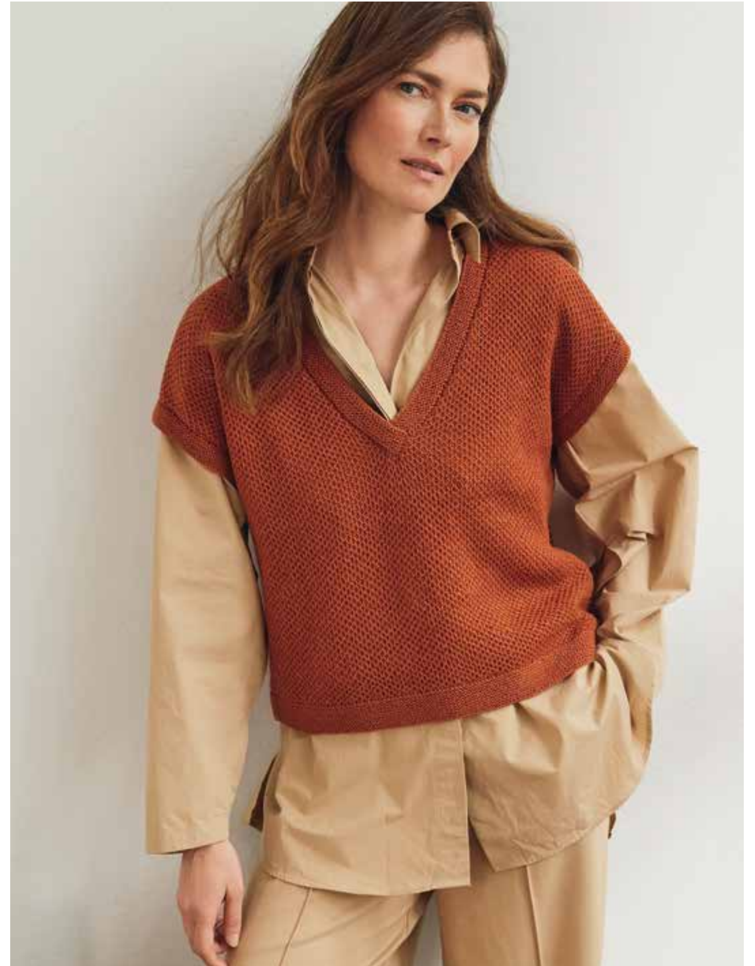
48 – PULLUNDER COOL WOOL LACE