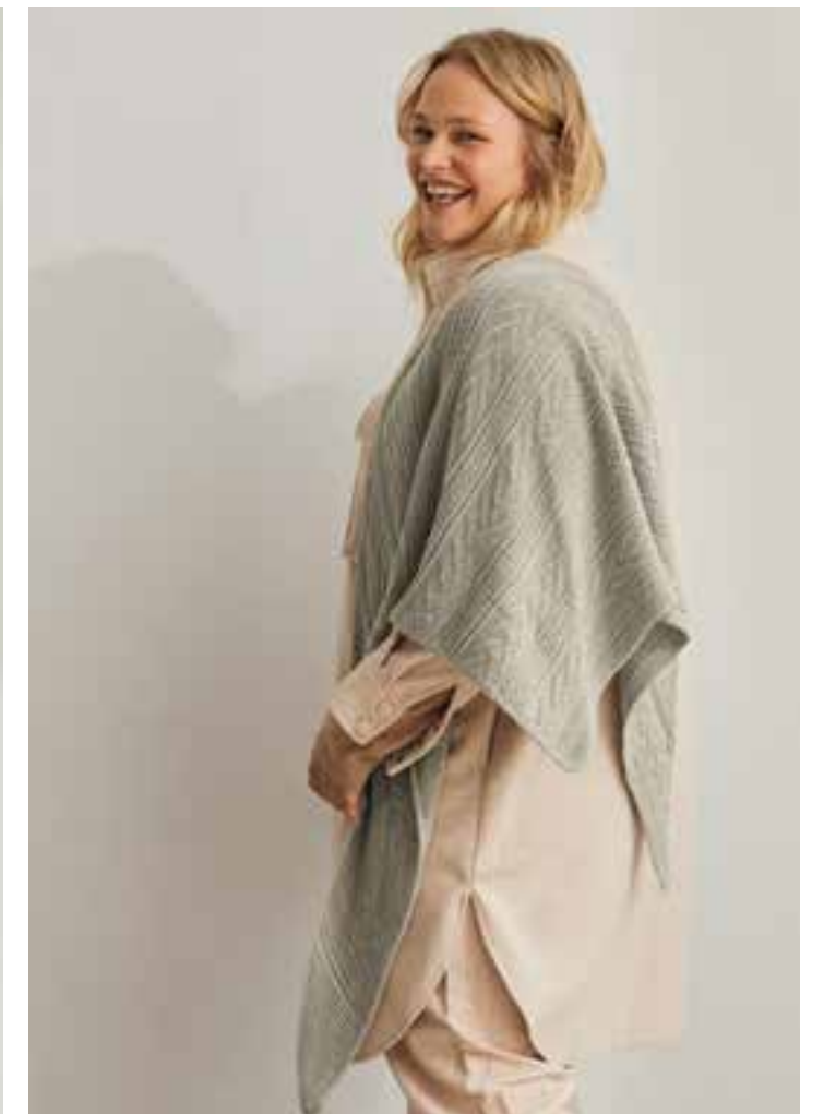
45 – DREIECKSTUCH COOL WOOL SETA