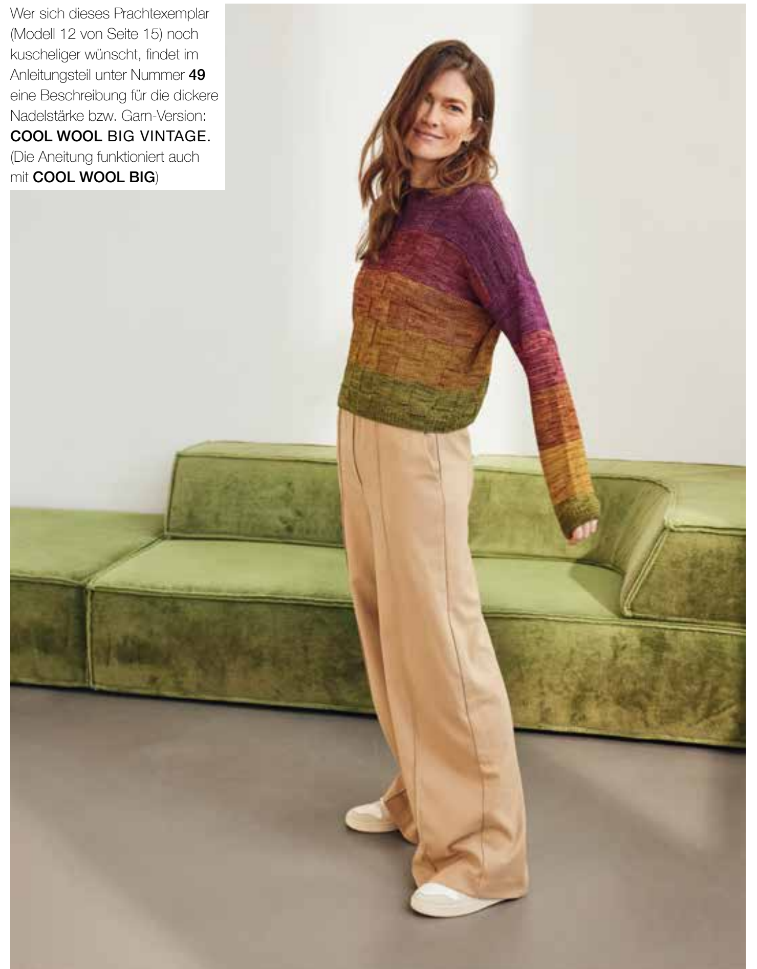
PULLOVER – COOL WOOL VINTAGE , Mod.12 von Seite 15

Wer sich dieses Prachtexemplar (Modell 12 von Seite 15) noch kuscheliger wünscht, findet im Anleitungsteil unter Nummer 49 eine Beschreibung für die dickere Nadelstärke bzw. Garn-Version: COOL WOOL BIG VINTAGE . (Die Anleitung funktioniert auch mit COOL WOOL BIG )