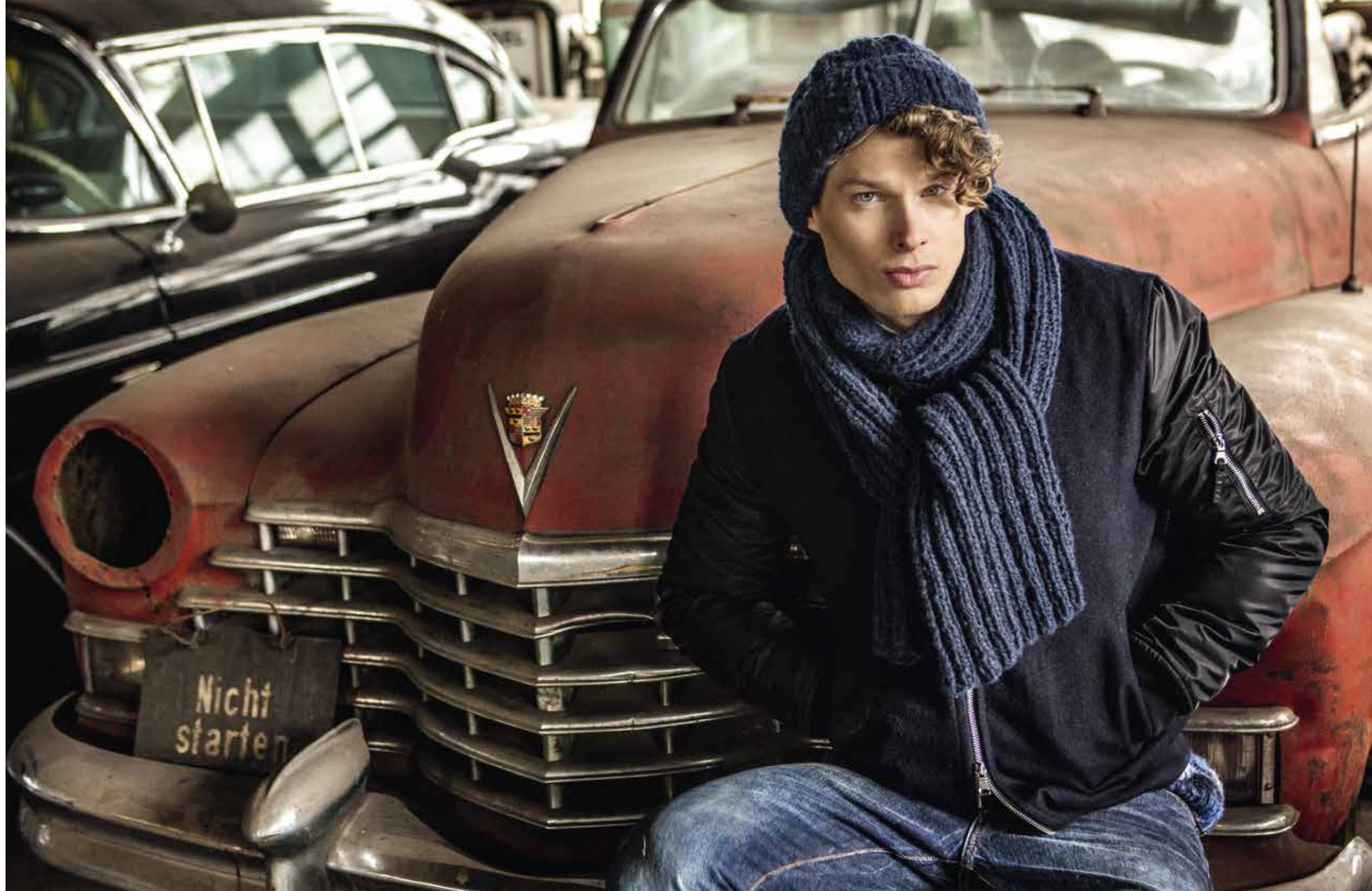
06 Mütze + 07 Schal - PIÙ COLORI