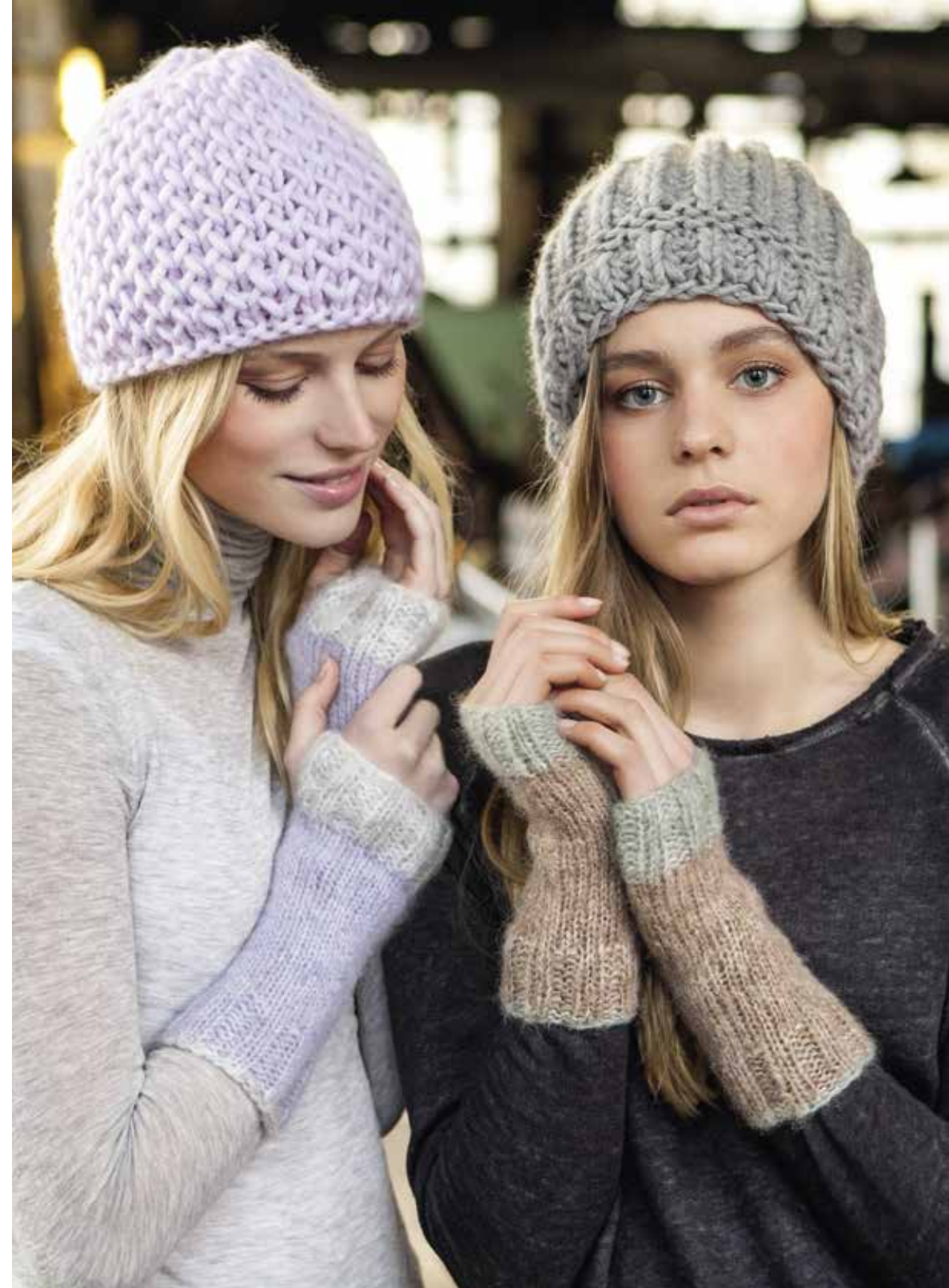
links: 34 Pulli - VOI | Titelmodelle: Mützen (4 + 15) von den Seiten 6 und 15 - LEI Stulpen (10) von Seite 11 - VOI