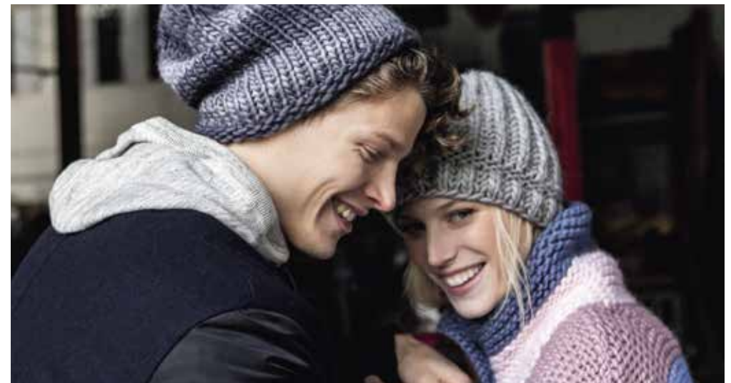
links: ♀ Mütze (29) – AMICI DUE + Pulli (28) – VOI von den Seiten 46 und 47 | ♂ Mütze (11) von Seite 13 + 32 Schal – LEI DEGRADÉ | unten: ♀ ♂ Mützen von Seite 15