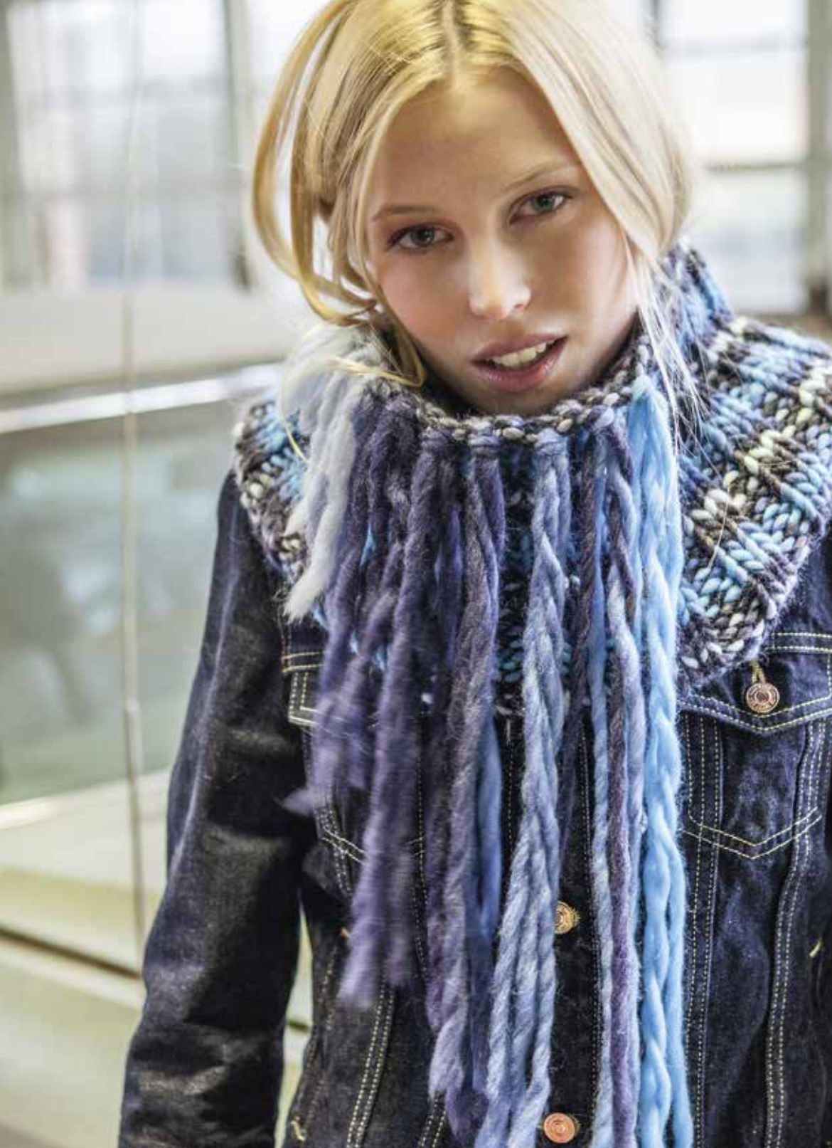
oben: 22 Loop – LEI COLORMIX | rechts: 23 Jacke – AMICI DUE