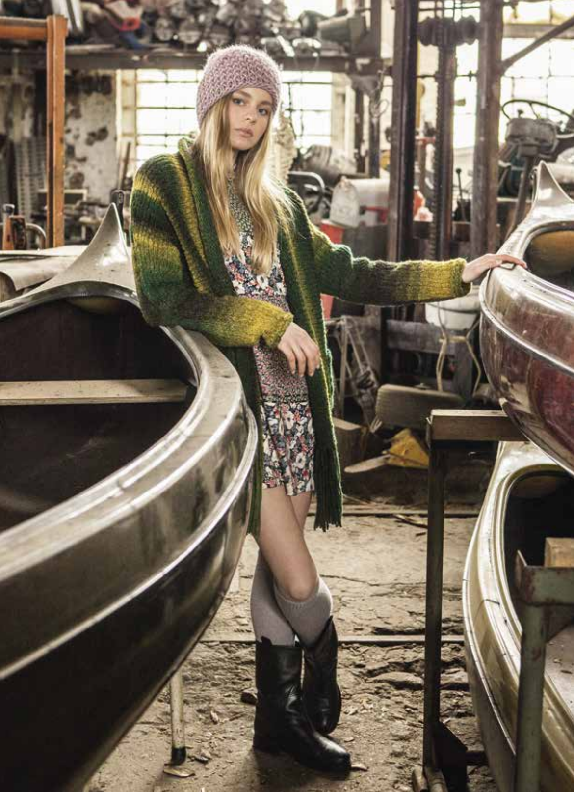
04 Mütze - LEI | 05 Jacke - PIÙ COLORI DEGRADÉ