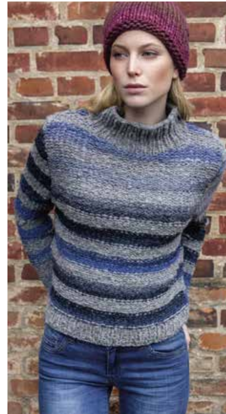
links und oben: 11 Mütze - LEI DEGRADÉ 12 Pulli - PIÙ COLORI + PIÙ COLORI DEGRADÉ ♂ Mütze (11) - LEI DEGRADÉ