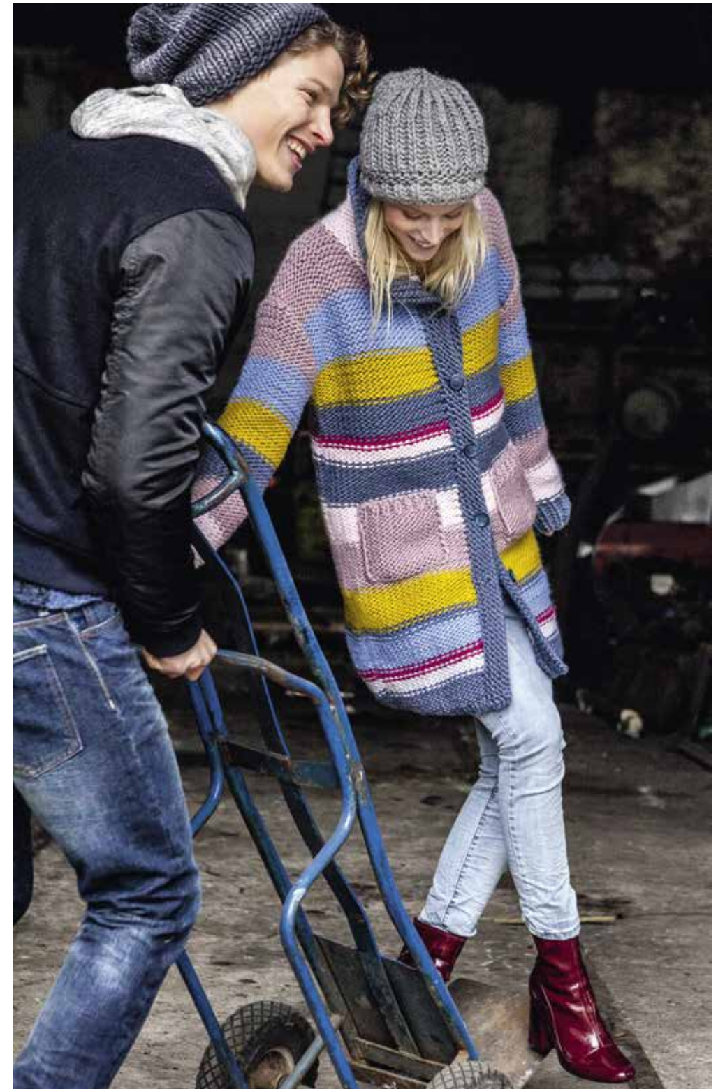
links: 14 Pulli – LEI | oben: ♂ Mütze (11) von Seite 13 + ♀ 15 Mütze + 16 Jacke – LEI