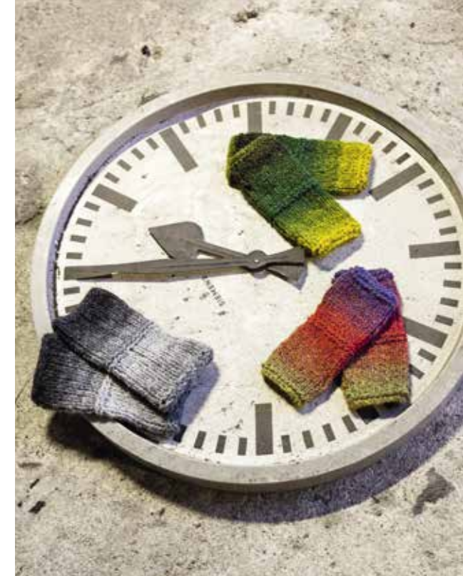
13 Stulpen - PIÙ COLORI DEGRADÉ Pulli (08) von Seite 10 - VOI