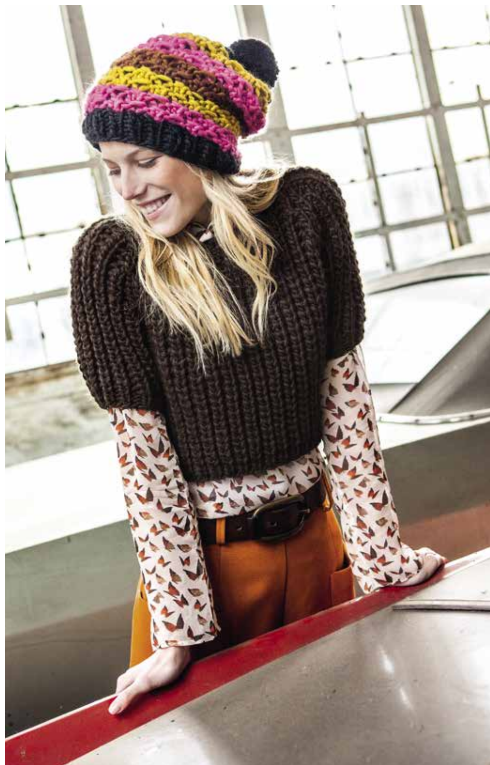
17 Mütze + 18 Pulli - LEI