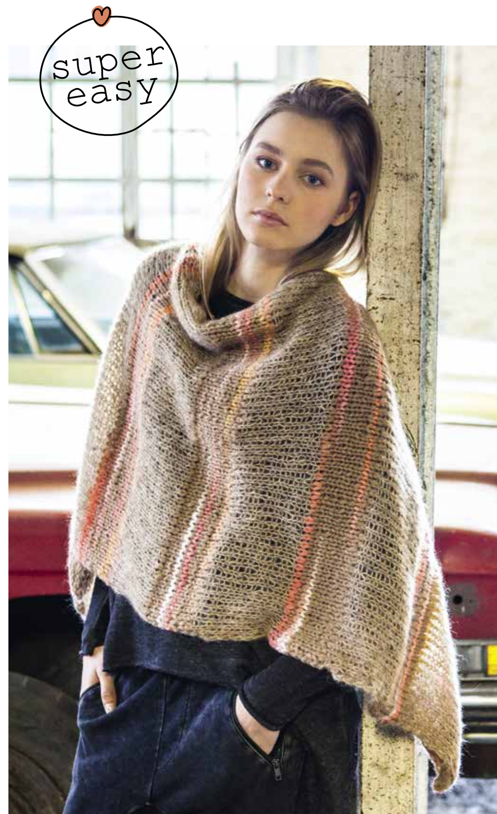
19 Poncho - AMICI DUE + VOI